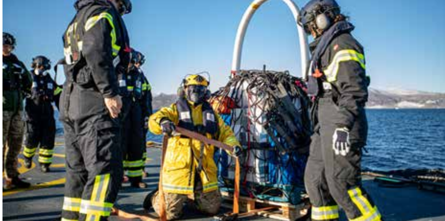
▲ Besætning sikrer sling.

Under årets depotudlægning fik TRITON hjælp af en MH-60R Seahawk fra flyvevåbnet. Seahawken opererer hele året fra Søværnets Inspektionsskibe ved Grønland eller Færøerne. Helikopterne benyttes blandt andet til farvandsovervågning, fiskeriinspektioner, eftersøgning og søredning. Under turen var helikopterens primære opgave dog transport, samt sekundært at hjælpe skibet med at danne et billede af de is forekomster der ventede forude. Helikopteren var uundværlig under operationen, og med en aktionsradius på 250 sømil fra skibet, kunne helikopteren bevæge sig over storisen og ind over den grønlandske kyst, for at nå nogle af de hytter der ligger allerlængst væk. Helikopteren har normalt brændstof op til 3,5 times flyvning og med nogle ekstra tanke