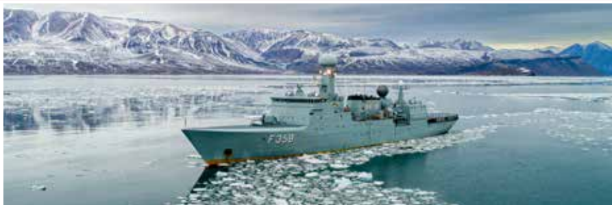
▲ TRITON for anker udenfor station Daneborg

Efter tiden hvor Nordøstgrønland fra 1814 officielt var et ingenmandsland krævede Danmark