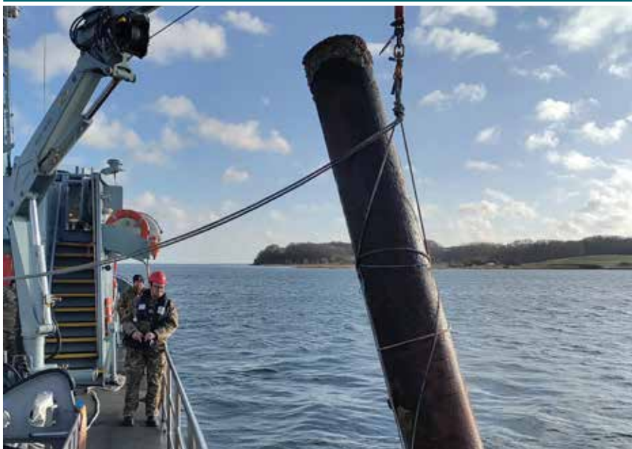
▲ Jernrøret så uskyldig ud. Men kunne i værste fald eksplodere.

Frivillige fra Hjemmeværnsflotille 136 Sønderborg fik sig lidt af en overraskelse, da de under en sejlads primo januar med MHV 814 BUD-STIKKEN blev kontaktet af Forsvarets Joint Rescue and Coordination Center (JRCC) om, at et metalrør med en betonklods drev rundt i Flensborg Fjord og potentielt kunne være til fare for skibstrafikken.