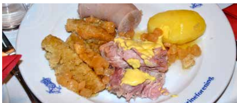
▲ Der er serveret. Fanøspecialiteten Sakkuk.