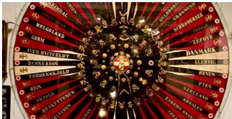
▲ Sammenhold fortalt gennem huebånd, maritime emblemer og Danmarks Marineforenings emblemer.