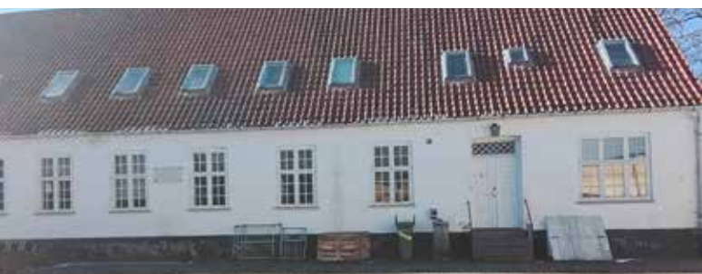
▲ Den tidligere herregård Store Almegård lægger, til Bornholm Marineforening igen får søstøvlerne under egen bord, lokale til afdelingens mange effekter.