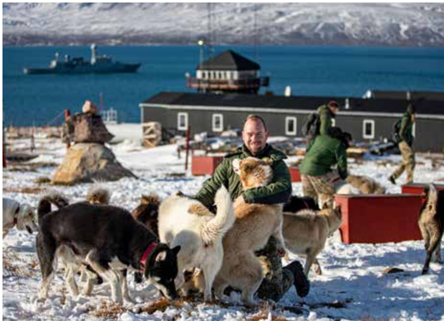
▲ TRITONS kok overfaldes af vapper.