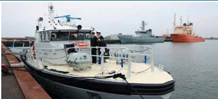
▲ A 548 MUNIN ved kaj på Flådestation Korsør.

- Presset på EU's ydre grænser er fortsat stort, og derfor er det vigtigt for regeringen, at vi bidrager aktivt til den fælles europæiske indsats på området. Danmark bidrager, ud over de to nye patruljebåde, med både fly, helikopter, personel og køretøjer. Med de danske bidrag styrker vi beskyttelsen af EU's ydre grænser, og værner om danskernes sikkerhed og tryghed, sagde forsvarsminister Troels Lund Poulsen i sin tale. Også Udlændinge- og Integrationsminister Kaare Dybvad Bek talte ved dagens arrangement. - Europas ydre grænser er også Danmarks grænser. Irregulær migration er en stor trussel mod Europas sammenhængskraft, og det er helt afgørende, at vi kæmper for at få kontrol med tilstrømningen til Europa. Derfor skal de europæiske lande stå sammen for at beskytte vores ydre grænser. Vi skal ikke sidde i Danmark langt fra Middelhavet og lukke øjnene for de enorme udfordringer, som eksempelvis Italien og Grækenland står i. Derfor er jeg glad for at vi nu har fået overdraget de to