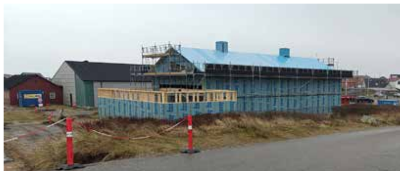
▲ Folkene bag "Æ Motorrum" i Thyborøn har det nye museums- og marinehus klar medio 2025.

Generalforsamlingen blev afsluttet med den traditionsrige bespisning i form af Eisbein mit Sauerkraut und Erbspuree.