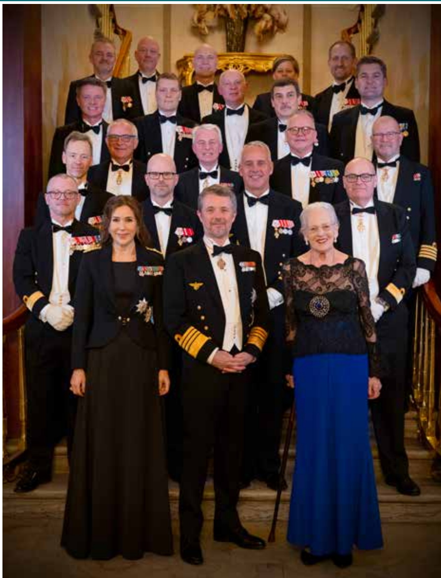
▲ Kongeparret og H.M. Dronning Margrethe sammen med en række søofficerer og orlogsprovsten ved taffelevnten den 29. januar 2025.