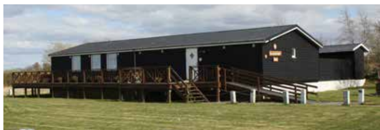
▲ Marinehuset på strandengen ved Skive Jollehavn bejler stærkt til titlen som Danmarks Marineforenings smukkeste placeret lokalafdeling.