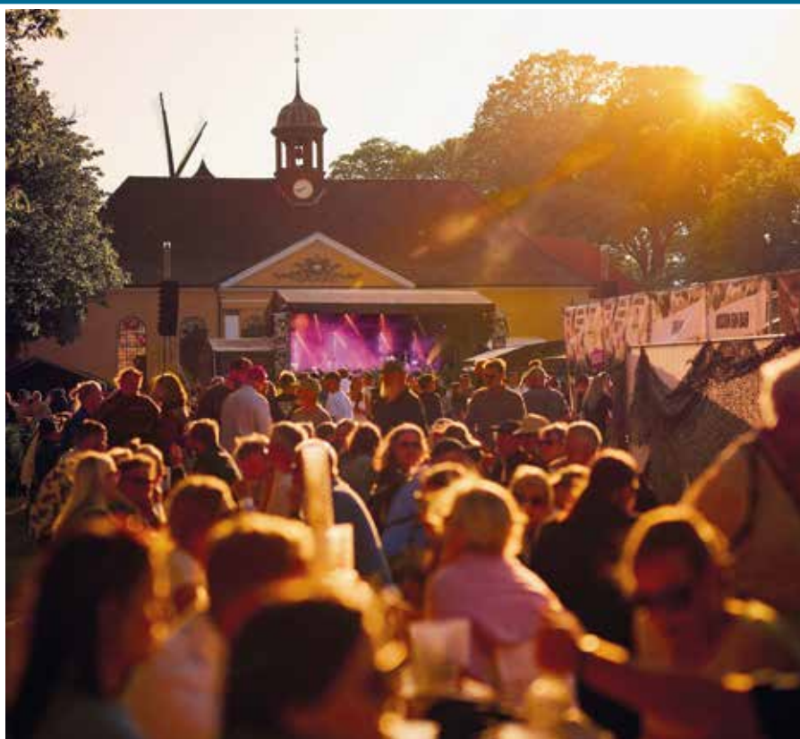
▲ Festival hygge ENGAGE Festival 2024