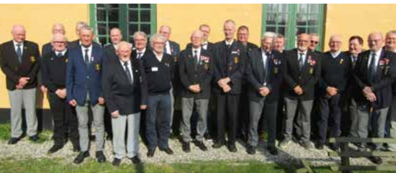
▲ Mellem møde og skafning blev der tid til fotoseance under distriktsmøde i Ærøskøbing.

Vi skal også kigge fremad. Hvordan får vi fat i de næste generationer? Hvordan gør vi Marineforeningen relevant for dem? Jeg tror, at sociale medier kan være en af vejene frem. Det er jo der, mange unge mennesker er i dag. Vi kan bruge de platforme til at fortælle vores historie, skabe debat om maritime emner og måske lokke nogle nye ansigter til. Jeg har også været rundt til generalforsamlinger i vores lokalafdelinger, og der er både positive og negative nyheder. Det er jo ikke alt, der er rosenrødt. Desværre må vi sige farvel til Ishøj Marineforening. Det er altid trist, når en afdeling lukker ned. Og i Kongens Lyngby er de i lidt af en limbo omkring deres lokaler. Det er da en tanke, at de måske ender med at stå uden tag over hovedet. Men midt i det hele, så er der en kæmpe portion positivitet. Jeg mærker virkelig en vilje i de fleste afdelinger til at kikke fremad, til at udvikle sig. Og det allervigtigste. Vi medlemmer er, som jeg føler det, simpelthen så glade for at være en del af Danmarks Marineforening. Det giver mig en enorm tro på fremtiden.