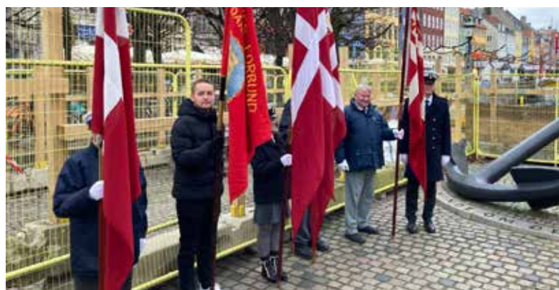
▲ Fire flag fra Danmarks Marineforening samt en fane fra Søværnet dannede flag og faneborg ved Mindeankret under højtideligheden den 24. december 2024.

Afdelingen har også været aktiv i debatten om bevarelsen af den maritim kulturarv i København. Et møde i marinestuen under overskriften "Kampen for masterne i Københavns Havn" samlede sejlskibsejere og andre foreninger for at udveksle synspunkter om en ny cykelbro i Københavns havn, der potentielt ville forhindre adgangen for mastefartøjer. Udover de faglige og debatskabende arrangementer har afdelingen også afholdt traditionsrige begivenheder som juleaftensdag i Holmens Kirke med efterfølgende kranselægning ved Mindeankret ved Nyhavn, hvor ▶