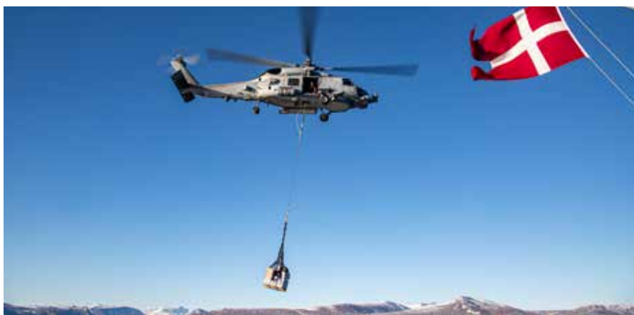
▲ MHR-60 med sling.

der kan fastspændes, bliver aktionsvidden øget yderligere.