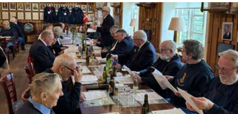
▲ Stor koncentration blandt deltagerne ved generalforsamlingen i Marstal Marineforening.