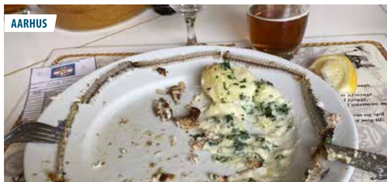
▲ Åleben tallerkenen rundt, er for mange fans af stegte ål et must. Også blandt medlemmerne i Aarhus Marineforening.

Som fortalt i noten fra Randers Marineforenings Skyttelav blev det til et nederlag ved venskabskydningen mod kollegaerne fra Randers.