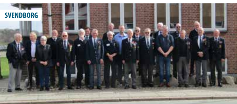
▲ Deltagerne ved distriktsmødet for distrikt Fyn er mellem møde og skafning forevige foran Marinehuset i Svendborg.