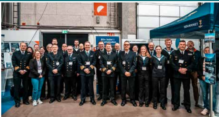
▲ Søværnet var positivt synligt på den store NATO messe i Fredericia.

Udover fregatten PETER WILLEMOES i Fredericia havn, deltog Søværnet på Totalforsvarsmessen Aktion 24 i Fredericia med et samlet display, der repræsenterede Søværnets operative virke bredt. I messecenteret var der deltagere og materiel fra myndighederne 1., 2. og 3. Eskadre samt Søværnskommandoen, herunder Center for Sømiliter Teknologi, Center for Våben, Center for Taktik, Center for Maritim Uddannelse og Skibssikkerhed, Kystredningstjenesten, Søværnets Dykkertjeneste, Mine Countermeasures Denmark, Flådestationerne, Søværnets Tamburkorps og Havmiljøvogterkampagnen. Dertil også Søværnets Officersskole og Søværnets Sergentskole, der til dagligt er underlagt Forsvarsakademiet.