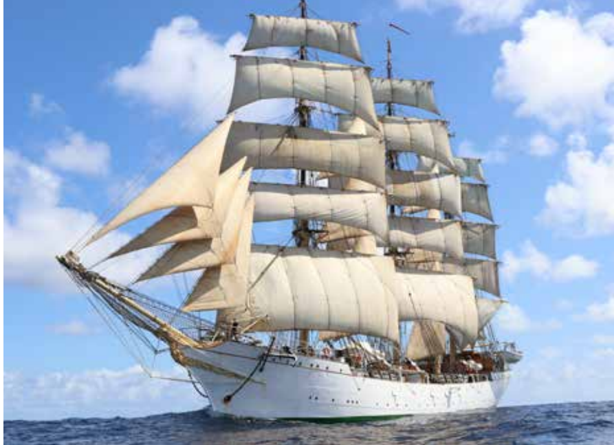
▲ "Danmark" under sejl med vind tværs agter styrbord halse.

I de senere år, har MARTEC's bygninger, lokaler og undervisningsudstyr gennemgået en rivende udvikling. Fra mørke og kolde lokaler med få studerende, til et livligt og lyst miljø med topmoderne faciliteter. Det har været tiltrængt, men det har også været en nødvendighed, for at kunne tilbyde det bedste af det bedste, som i dag er en forudsætning for at kunne tiltrække de unge, som har rigtig mange uddannelser at vælge imellem men også for at skabe den bedst mulige forberedelse til de jobs, der venter i erhvervslivet efter endt uddannelse.