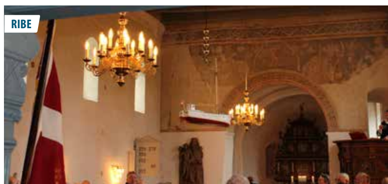
▲ Kirkeskibet "Karen af Mandø" er nu ophængt i Vilslev Kirke.

Til distriktsmødet i Horsens den 24. marts stillede afdelingen med 12 medlemmer.