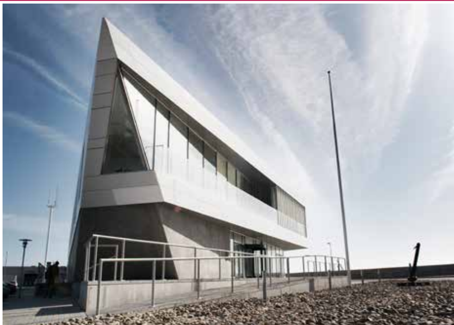
▲ Skipperskolen i Skagen er i dag en vigtig hjørnesten i de maritime udbud fra Martec.

I sommeren 2017 blev Skagen Skipperskole, den traditionsrige navigationsskole i Skagen der uddanner, fiske-, sætte- og kystskippere samt konventionelle skibsførere, også en del af MARTEC. MARTEC Skagen fejrede i 2021 sit 100-års jubilæum, og er alderen til trods en