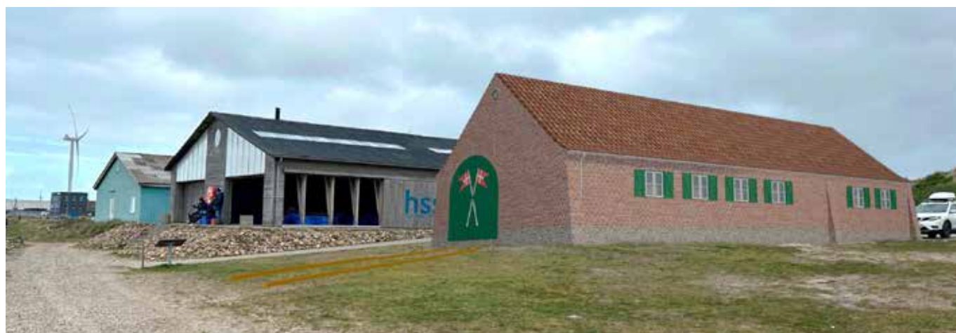
▲ Klintens Tegnestues visuelle tegning af huset på havnen i Hvide-Sande.

de mange tiltag fra Danmarks Marineforenings 72 lokalafdelinger, der er med til, at Det Blå Danmark i det store og hele anerkender organisationens position som et af de tunge maritime interessepartnere i det danske rigsfællesskab.