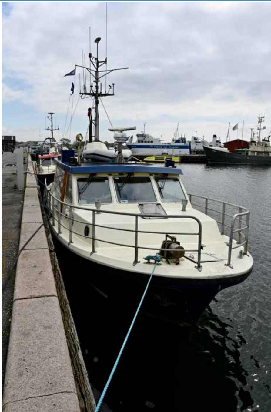
▲ Ex. "Marsvinet" ved kaj i Haderslev.

"Marsvinet" blev bygget på Faaborg Værft i 1988. Skibet er 13 meter lang, 4 meter bred og har en dybgang på 1,5 meter. To stk. Volvo Penta TAMD 61 på hver 230 HK giver fartøjet en fart på 13 knob. De to besætningsmedlemmer skulle sammen med af hoc besætningspecialister overvåge vandkvaliteten i det daværende Storstrøms Amt. For at løse opgaven var "Marsvinet" udstyret med en CTD sonde og en automatik vandhenter, således at besætningen i real time kunne monitorer vandets indhold af ilt, salt, temperatur samt vandets indhold af fytoplankton (små alger). Med vandhenteren kunne besætningen indsamle vand fra forskellige dybder, oftest top og bund og sende disse prøver til laboratorium i land som analyserede for kvælstof og fosfor mv.