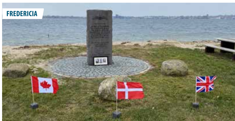
▲ Mindestenen for de syv britiske flyvere der omkom ud for Lyngsodde den 10. marts 1943.