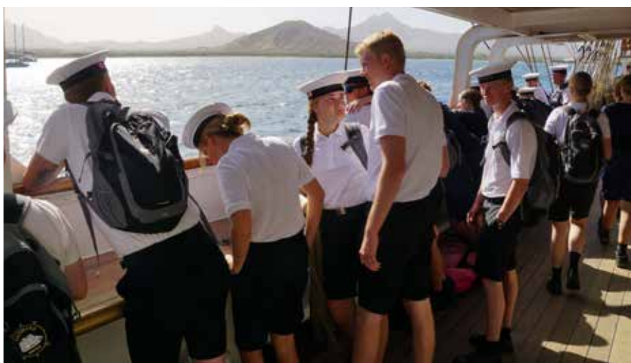
▲ Første step på en livslang maritim karriere kan starte som elev på skoleskibet "Danmark".

topmoderne skole med en af Danmarks nok bedste placeringer. I 2019 åbnede MARTEC en afdeling i Aalborg med en maskinteknisk afdeling, der fungerer som 1. semester på maskinmesteruddannelsen.