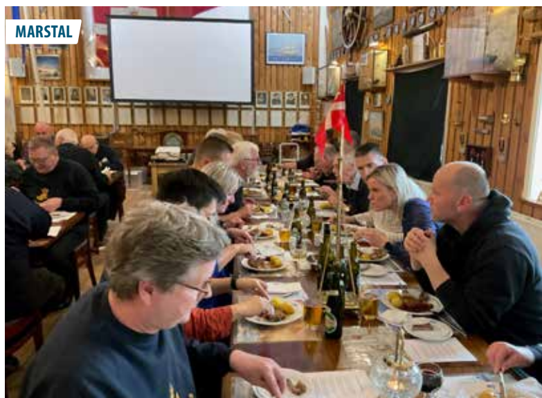
▲ Hyggeaften i Marstals gamle biograf der i dag huser Marstal Marineforening.