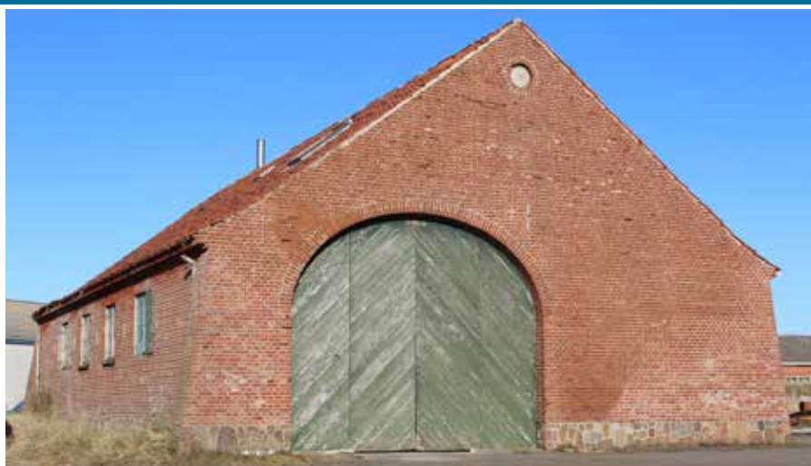
▲ Materiale fra den tidligere redningsstation genbruges i det nye marine- og kulturhus i Hvide Sande.

Genanvendelige materialer fra det nedrevne redningshus bliver brugt i det nye marine- og kulturhus og skal dermed give luft i materiale finansieringen. Selv om afdelingen fra et tidligere medlem har modtaget en arv på omkring