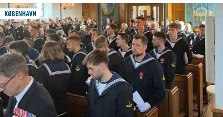
▲ Holmens Kirke er fyldt godt op af besætningsmedlemmer fra de af søværnets skibe, der i weekenden i uge 15 2024 havde lagt til kaj i Københavns Havn.

hovedstyrke stod ved Taps, derfor blev Brødremenighedens kirke i Christiansfeld indrettet som lazaret for sårede Slesvig/Holstenere, men også for sårede tilfangetagne danske soldater. På lazarettet døde 38 soldater, heraf 14 danske soldater. De blev alle begravet i en fællesgrav ved Gudsager i Christiansfeld.