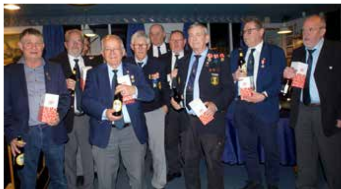
▲ De bedste holdskytter fra de enkelt skyttelav hjemmebaneskydningen 2023.