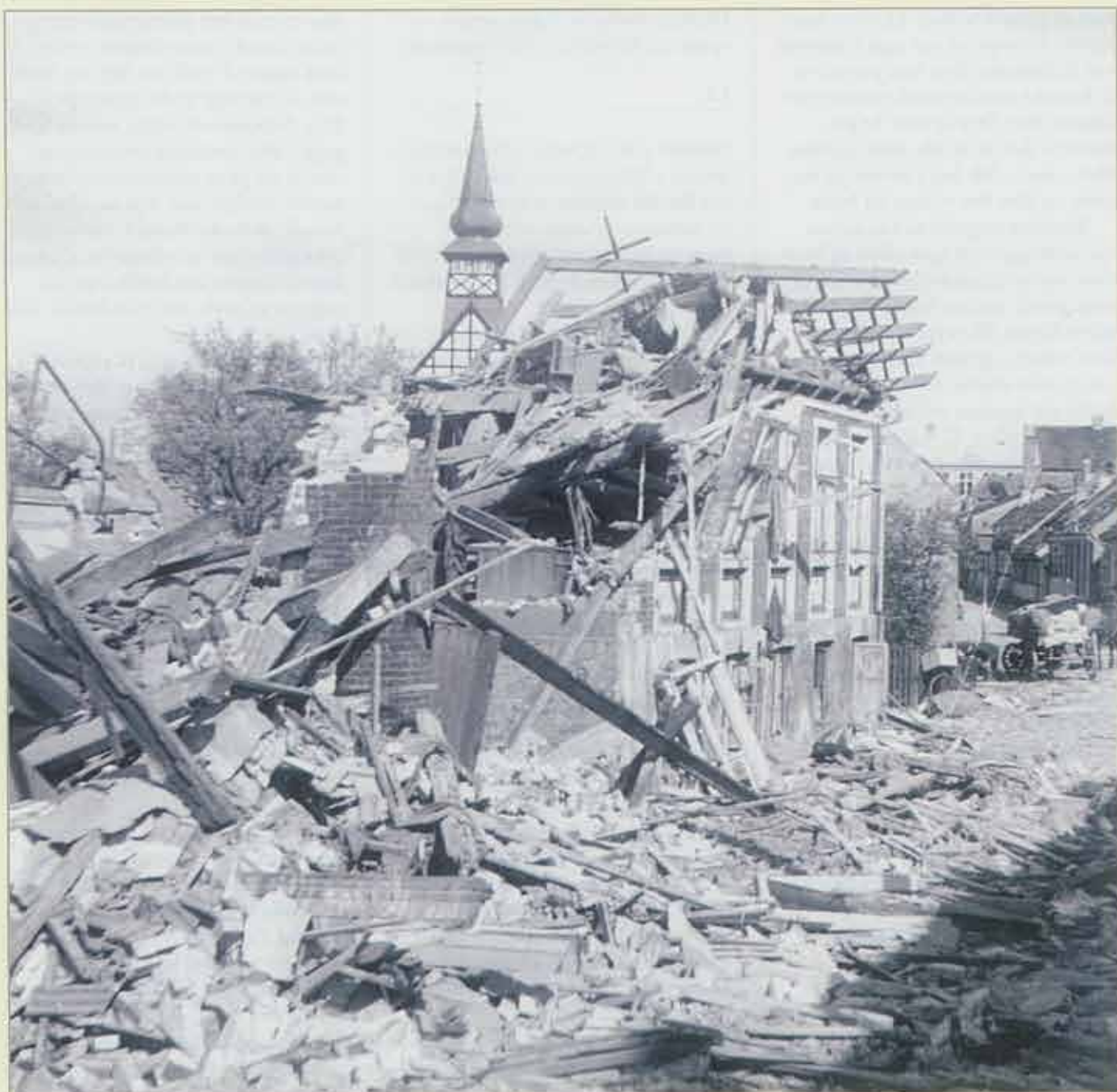
Kirken i Nexø klarede bombardementet, men det gik hårdt ud over omgivelserne.