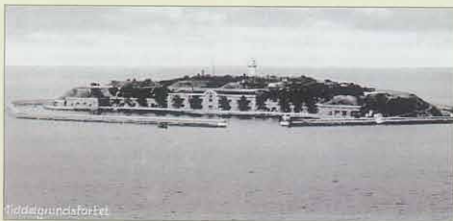
Luffoto af Middelgrundsfortet som det så ud i 1930'erne