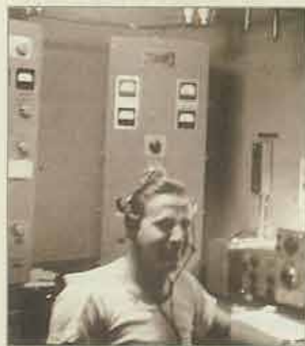
Artiklens forfatter i radiatorummet medens han lytter til BBC som sender til modstandsfolk i Danmark.

Skibene kom under engelsk, eller et andet allieret flag. Vi blev armerede. I begyndelsen var det en 4 tomers kanon agter og et halv dusin 30 kaliber maskingeværer som viste sig