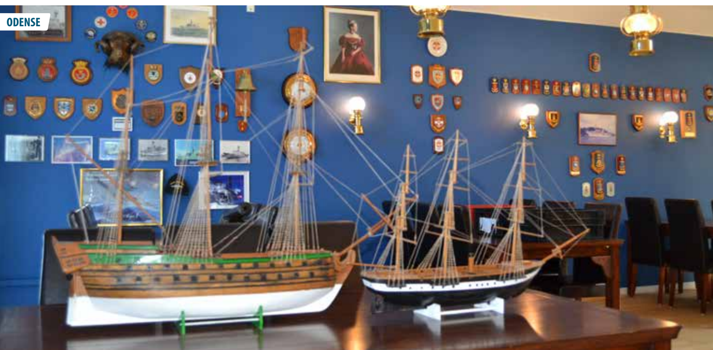
▲ Medlemmerne i Odense Marineforening var yderst aktive under coronakrisen. Blandt indsatsområderne var en overhaling af marinestuen og stuens forskellige rariteter, blandt andet de viste skibsmodeller.

Noten er skrevet den 29. maj 2020. Så når dette magasin er på gaden, er der ifølge planen formodentligt gang i aktiviteterne i Odense Marineforening.