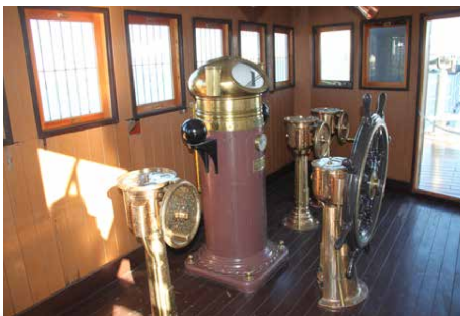
▲ Styrehuset på MISAKA.