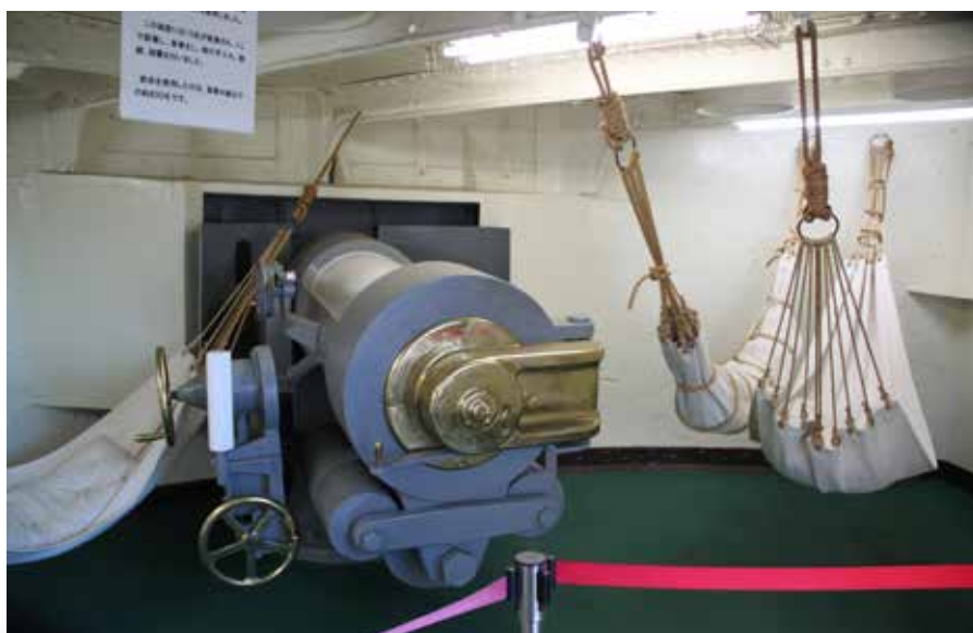
▲ Foto af kanon på hoveddækket. Mandskabets sovepladser er tæt på deres arbejdsplads.

vostok. Den forenede russiske styrke bestod af 28 krigsskibe og en række hjælpefartøjer. Chefen var den før omtalte viceadmiral Rojstjensky, der befandt sig om bord på flagskibet SUVOROFF.