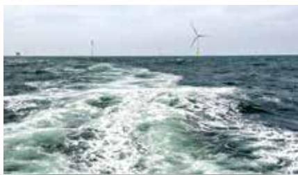
▲ I sagens natur er det umuligt at drive havvindmøller uden hjælp fra søfartsbranchen.