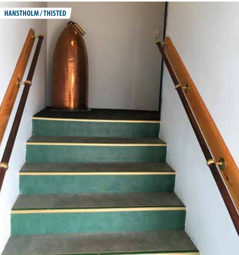
▲ Trappen fra entréen op til marinestuen i Hanstholm udstyres snarest med en stolelift