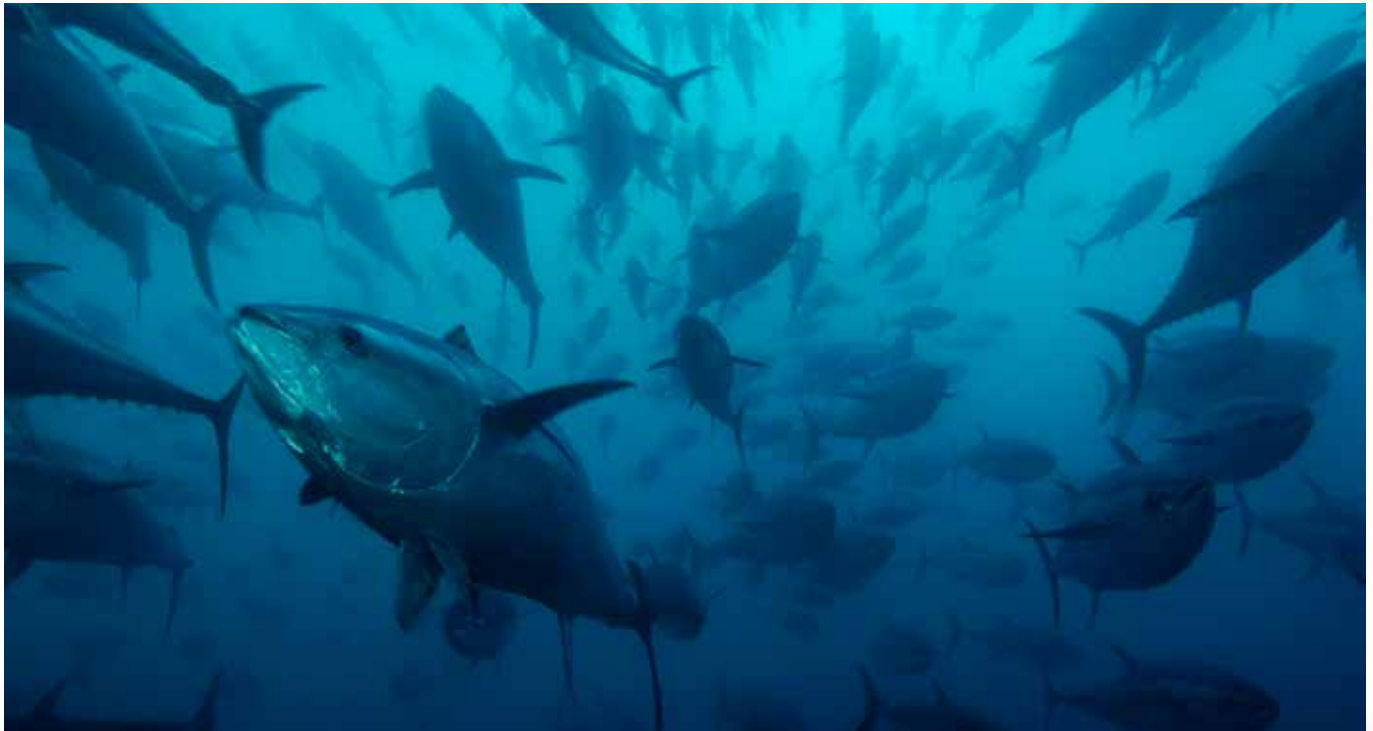
▲ Det vrirler med tun i danske farvande.