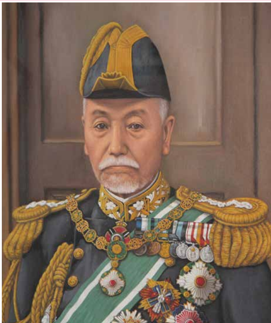
▲ Foto af et maleri af admiral Heihachiro Togo udstillet på MISAKA museet.

Admiral Togo blev 1913 udnævnt til medlem af Det Øverste Krigsråd for Hans Majestæt Kejseren. I årene 1914-1924 var admiral Togo den øverste leder af uddannelsen af den senere japanske Kejser Hirohito. Admiral Togo døde den 30. maj 1934 (86 år), og han modtog en statsbegravelse. Orlogsskibe fra nationerne Storbritannien, USA, Holland, Frankrig, Italien og Kina deltog i en flådeparade i Tokyo-bugten i den anledning.