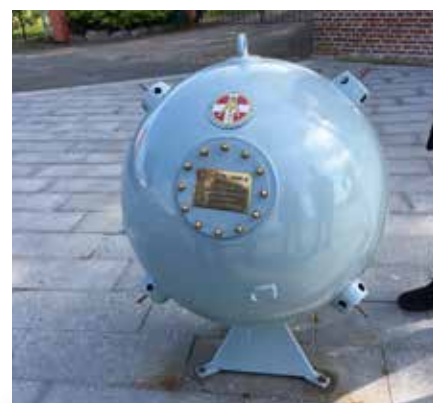
▲ Den nyrenoverede minebøsse indviet i 2004 er en amerikansk øvelsesmine. Minen er uden møntindkast, idet de tidligere miner ofte blev udsat for hærværk, og pengene blev stjålet.

Mine nummer tre, der blev opstillet i 2004 som en gave fra Faaborg Marineforening til Faaborg by i anledningen af 750-års-købstadsjubilæet, har som skrevet under noterne gennemgået en