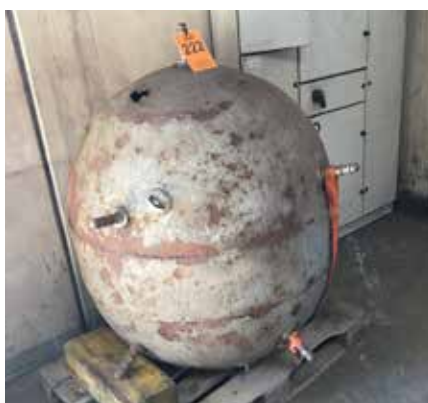
▲ Den ovale minebøsse fra 1960.

Mine nummer tre, der blev opstillet i 2004 som en gave fra Faaborg Marineforening til Faaborg by i anledningen af 750-års-købstadsjubilæet, har som skrevet under noterne gennemgået en