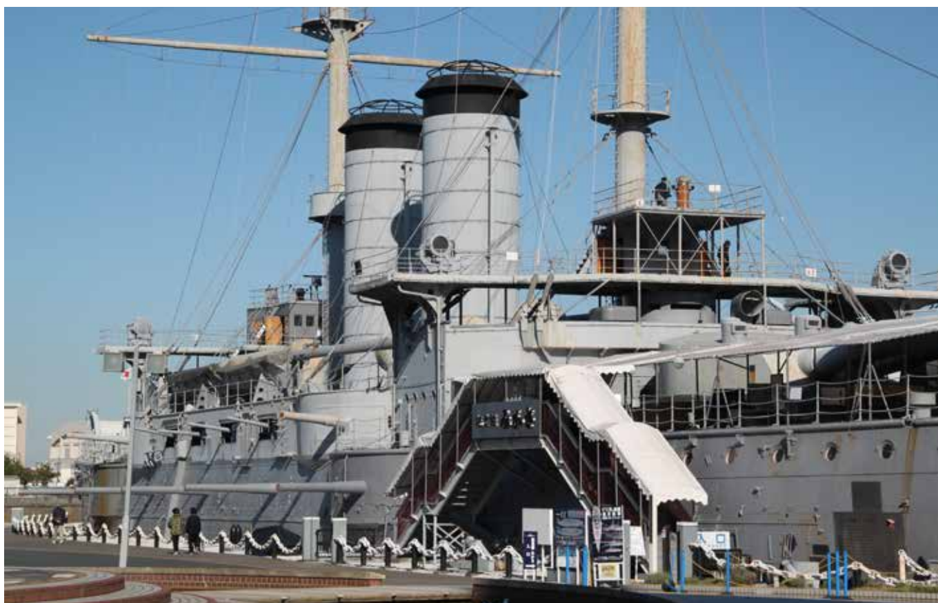
▲ Nærbillede af MISAKA.