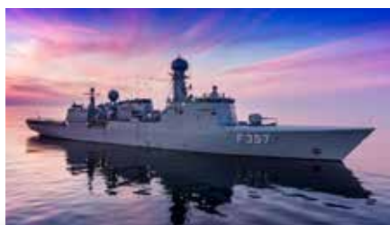
▲ F 357 inspektionsskibet THETIS i totalt havblik.

Så inden vi får set os om, er vi blevet en del af "de tidligere generationer", og måske er vi endda medlemmer af en marineforening, hvor vi med mellemrum får lejlighed til at sidde rundt om et bord og udveksle historier med besætninger fra Søværnets nye skibe.