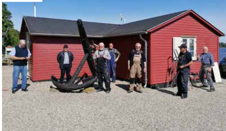
▲ Arbejdssjakket fra Middelfart Marineforening efter udlægning af 4 kubikmeter skærver ved Marnehuset.