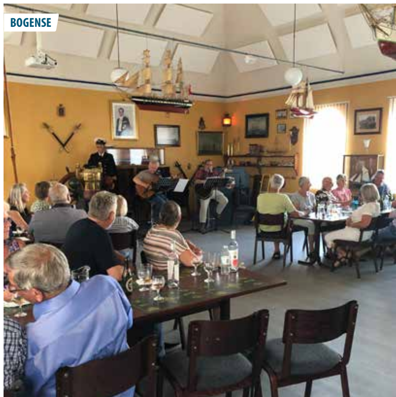
▲ Sommerhygge med musiksk underholdning i marinehuset i Bogense