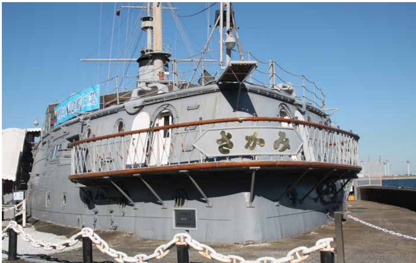
▲ Skibschefen på de større enheder boede stadig i smukke saloner agter. På MIKASA havde han endda egen altan.