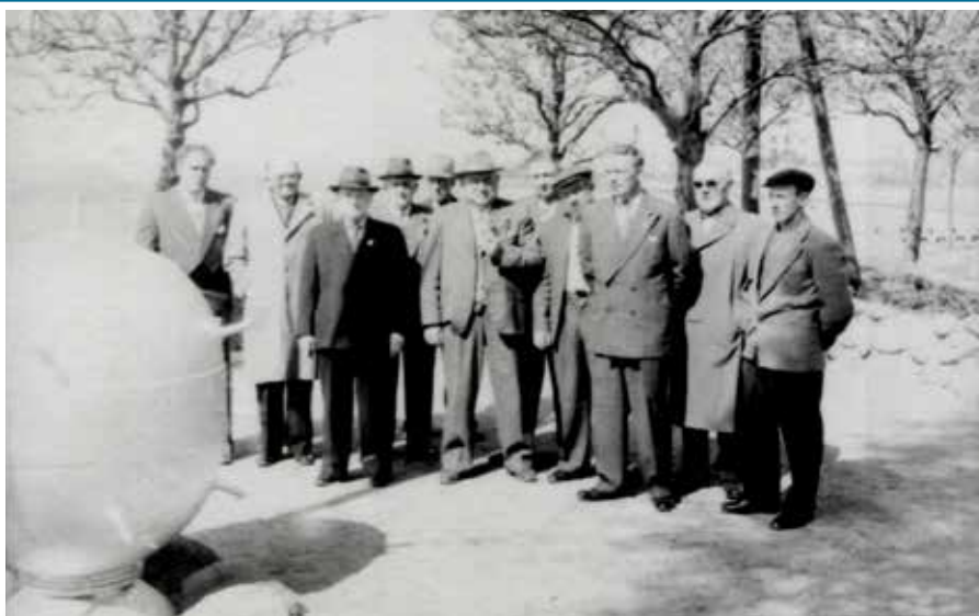
▲ Medlemmer fra Faaborg Marineforening indvier store bededag 1960 byens minebøsse nummer to, en oval hornmine fra 2. Verdenskrig.