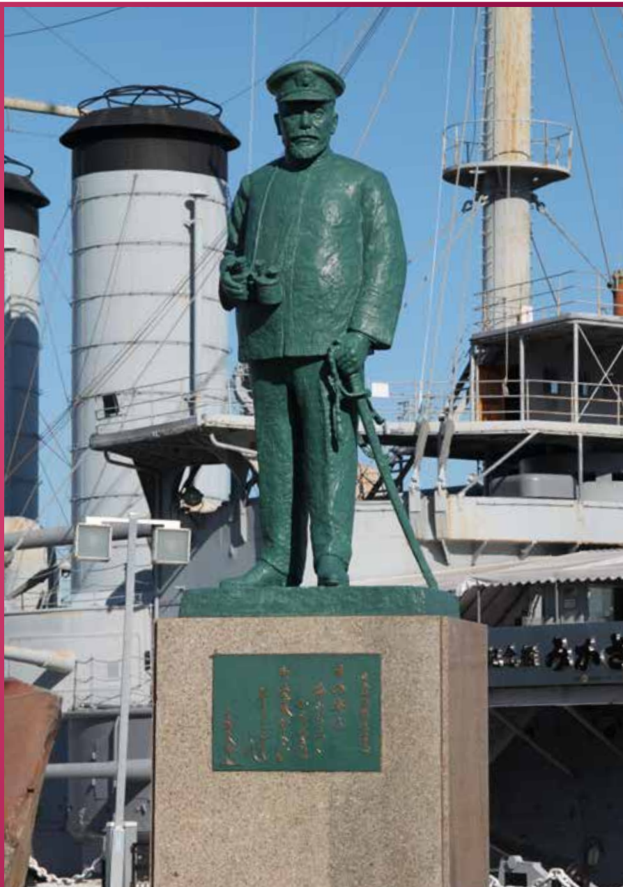
▲ Statue af admiral Heihachiro Togo placeret vis-a-vis HIJMS MIKASA.

Japan var militært ikke stærk nok til en holmgang med de tre nationer og gav sig.