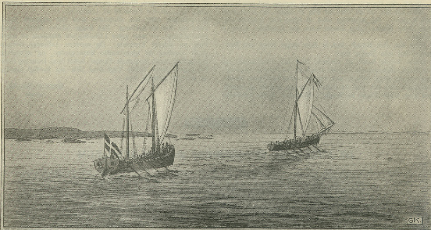
Afstanden mellem de to Skibe blev hurtigt mindre.