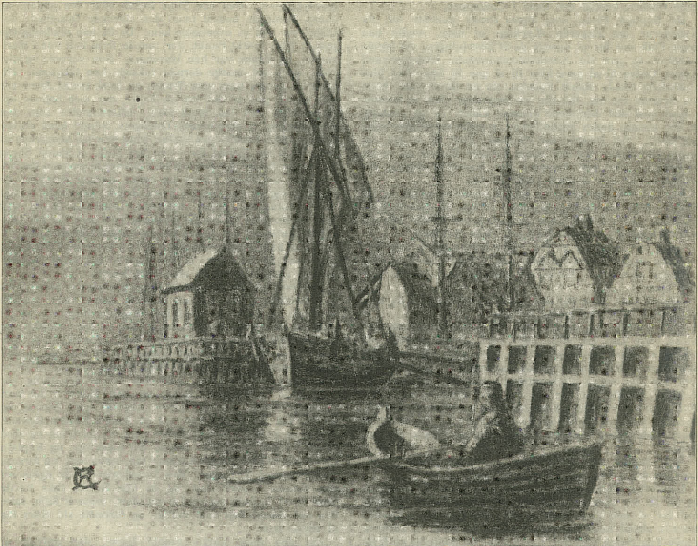
Kaperchaluppen staar ud fra Frederikshavn

TEGNING AF PREMIERLØJTNANT E. RIIS-CARSTENSEN