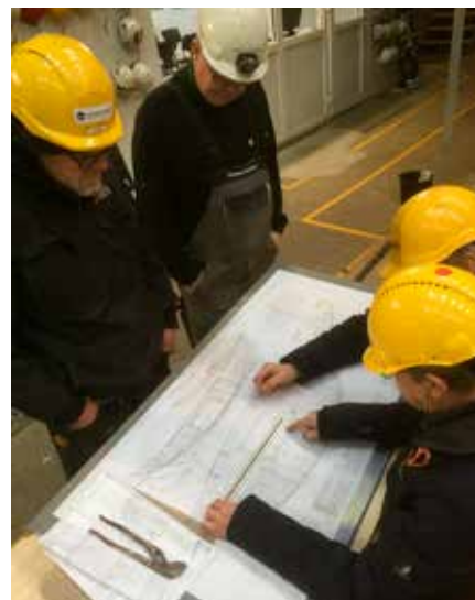
▲ Åledrivasen "Ulf II" er et eksempel på en delvis rekonstruktion af et fartøj, der ellers er forsvundet. Ulf II bygges efter de originale tegninger af drivasen ULF fra 1925.

I Skibsbevaringsfondens arbejder vi derfor på højtryk for at komme videre ad den vej og håber på skibenes og den danske kulturarvs vegne, at vi kan sikre den sejlede kulturarv en