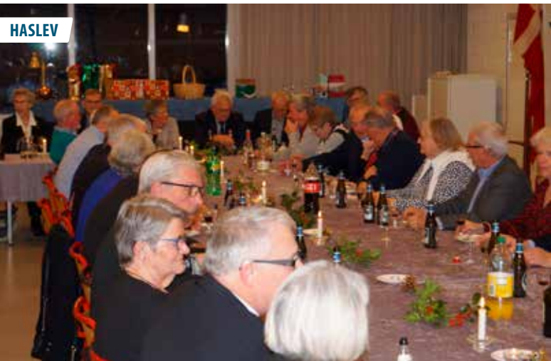
▲ Godt 40 personer deltog i årets julefrokost i Haslev Marineforening.