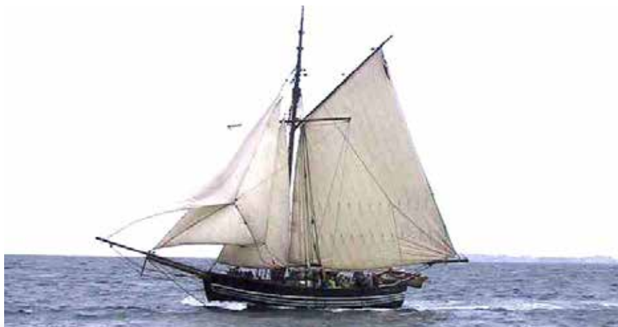
▲ Jagten "Jensine" (1853) er en typisk fynsk jagt fra det 17. og 18. århundrede. Fartøjet har levet en omskiftelig tilværelse, men er i dag fint restaureret og sejler som et eksempel på en fartøjstype, som tidligere dominerede de danske farvande, men som i dag er stort set forsvundet.