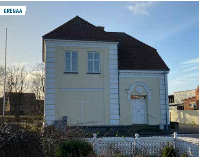
▲ Den smukke Simon Peters Kirke på havnen i Grenaa er her fotograferet af Steen Poulsen.