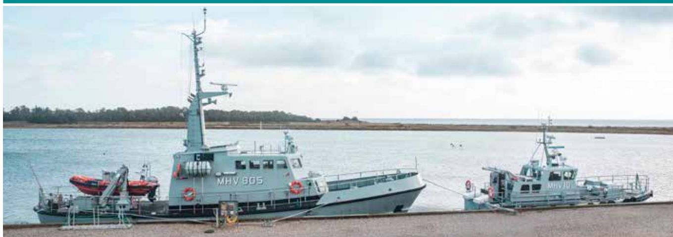
▲ Forrest MHV 10 BÅGØ ved kaj i Slipshavn. Agter for BÅGØ ligger MHV 805 GEMINI.