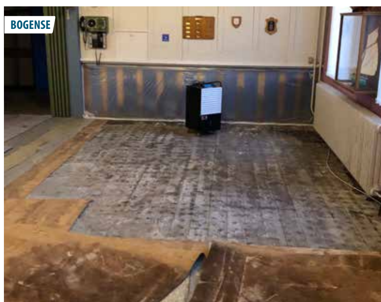
▲ Bogense Marineforenings marinehus er nu efter en kort men hidsig kamp med forsikringselskabet under den nødvendige reparation.