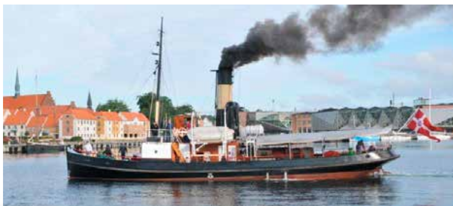
▲ Dampslæbebåden "Bjørn" (1908) blev bygget i Bremerhaven til Randers Havn som isbryder og bugserbåd. Skibet er udstyret med landets eneste bevarede tregangsmaskine – en dampmaskine, der tidligere var den almindeligste maskintype i danske dampskibe.

En gruppe ihærdige ildsjæle fik derfor etableret et vedvarende samarbejde mellem museer, private græsrodder, foreninger og andre interessenter i bevaringssagen, indtil det lykkedes at få stiftet fonden og dermed få Staten engageret i bevaringen af vor sejlene kulturarv.