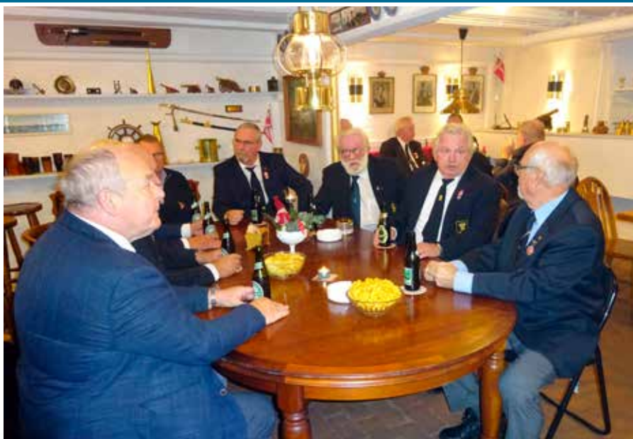
▲ Der hyggesnakkes ved åbningsreceptionen i Helsingør Marineforenings nyerhvervede marinestue.

– Vi er glade for, at så mange kiggede forbi, og vi takker for de gode gaver, de medbragte, lyder det fra afdelingssekretæren.