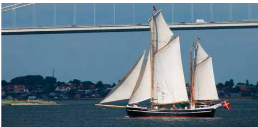
▲ Belønningen for de mange timers arbejde og økonomiske bekymringer kommer, når skibene endelig er at se i deres rette element. Her er det til Fyn Rundt for bevaringsværdige skibe i 2018.

Hvor långivningen nok er den mest synlige form for hjælp, som fonden yder til fartøjerne, så er en af de væsentligste opgaver for fondens se- kretariat at foretage rådgivning. Hovedparten af rådgivningen går til skibsejere, der har modtaget lån, og til ejere af bevaringsværdige skibe i øv- rigt. Desuden ydes der rådgivning til landets mu- seer og myndigheder, f.eks. Søfartsstyrelsen, Kulturstyrelsen, Miljøstyrelsen og Økonomi- og Erhvervsministeriet om emner, der berører den sejlene maritime kulturarv i bred forstand.