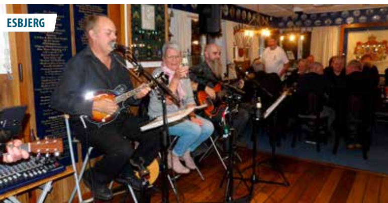
▲ "Vestjysk Folk Fighters" gjorde det godt under oktoberarrangementet "Irsk aften" i Esbjerg Marineforening.