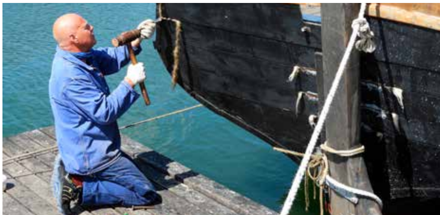
▲ Jagten "Kirstine" af Løgstør (1887). Når et fartøj modtager midler fra Skibsbevaringsfonden følger der en forpligtelse med til at restaurere skibet efter de kulturhistoriske retningslinjer. De fleste fartøjer restaureres på et af landets værfter, mens enkelte maritime museer har egne bådebyggere eller skibstømrere engageret.

Midlerne gives i form af rente- og afdragsfrie lån, hvorved der registreres pant i skibene. Pantebrevene forsynes med påtegninger ved- rørende obligatorisk vedligehold og med rådig- hedsindskrænkninger i forhold til salg af skibet. Derved opnås der sanktionsmuligheder i forhold til låntager, hvis låneaftalerne mod forventning ikke overholdes. Hvis manglende vedligehold forårsager forringelse af pantet, hvis ejer ønsker at sælge til udlandet eller fraviger forud aftalte restaureringsplaner, kan FONDEN kræve sit pant indløst ved tilbagebetaling af lånet.