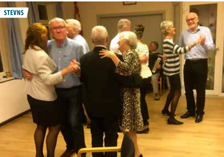
▲ Dansen går ved ålegildet i Stevns Marineforening i oktober.