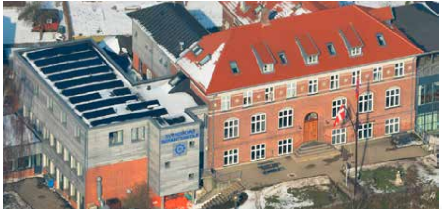
▲ En grunduddannelse på Svendborg Søfartsskole som først ubefarne og siden befarne skibsassistenter eller HF-Søfart er et godt springbræt til en efterfølgende udvidelse af de maritime kompetencer hos naboen Svendborg Internationale Maritime Academy (SIMAC).

– Dimissionen for det befarne skibsassistenthold var en historisk begivenhed. Aldrig før i Svendborg Søfartsskoles 113-årige historie har skolen haft mulighed for at udbyde denne uddannelse. Skolen har forud for opstarten af pionerholdet lagt voldsomt mange kræfter i planlægningen og har haft det som det primære mål, at det skulle være en succes helt fra start. Langt over skolens forventning startede der 17 elever på uddannelsen i juli 2019, og allerede nu ser det ud til, at den store tilstrømning fortsætter og endda øges i januar 2020. De dimitterende elevers slutevalueringer fortæller, at succeskriteriet er opnået. Dette betyder dog på ingen måde, at uddannelsen ikke skal videreudvikles og optimeres yderligere. Svendborg Søfartsskole har for kort tid siden opstartet en proces sammen med de øvrige udbydere, hvor