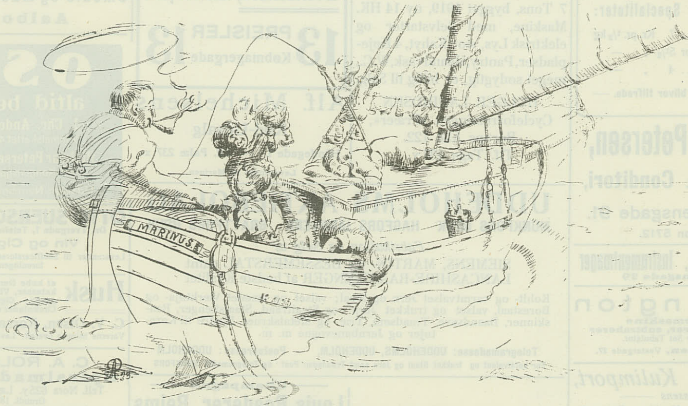
Sommersøndag i Sundet. „Familiebaaden“