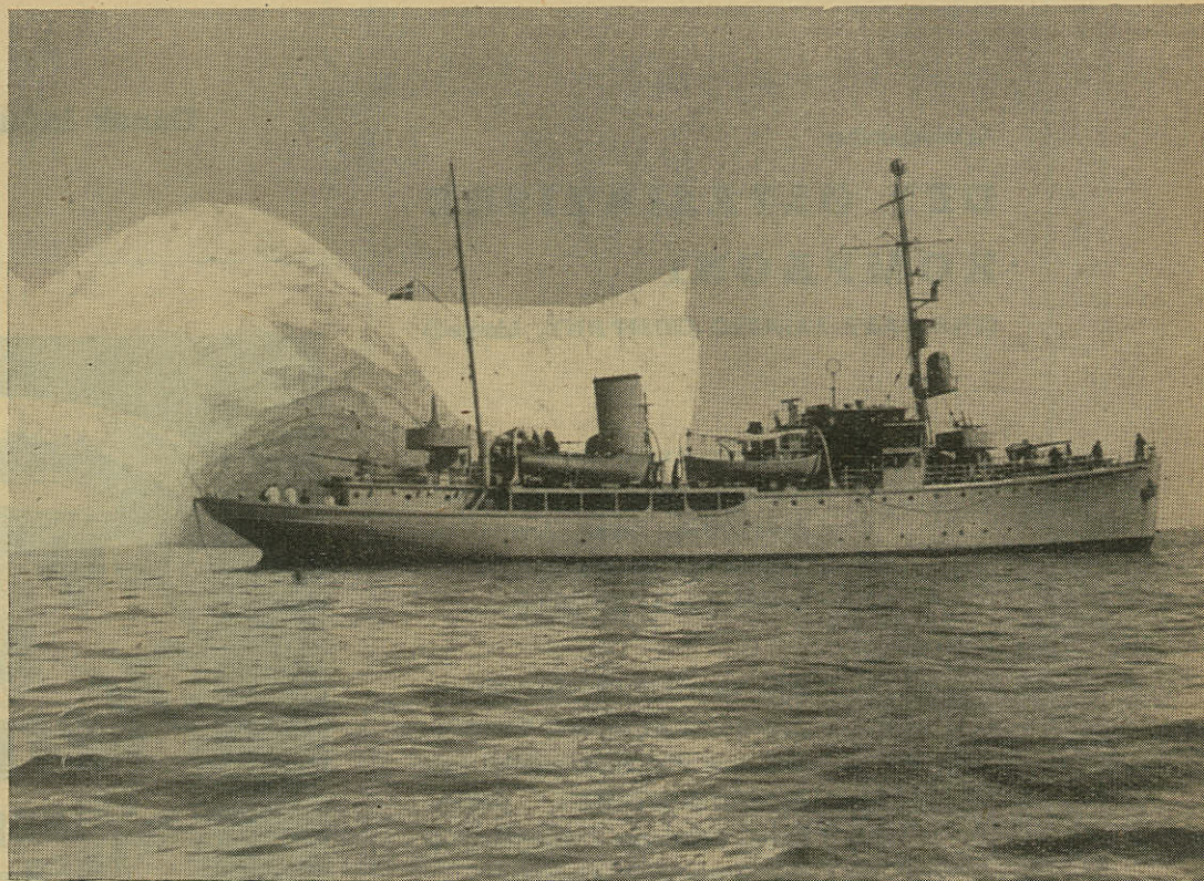
Opmaalingsskibet HEJMDAL i grønlandsk Farvand.