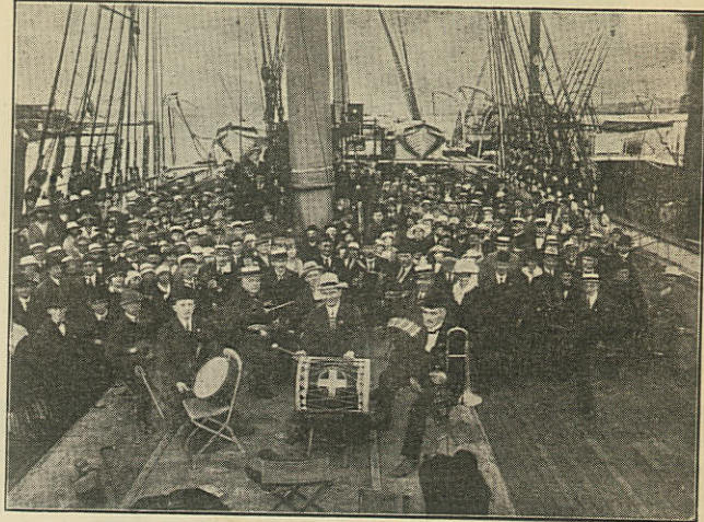
Ombord paa Fuldskipet »Viben«.

og Vinden løjede af, og selv om Varmen ikke var overvældende, blev Aftenen dog smuk og straalende. Ved Næstkommaderendes og Skibssergantens forenede Anstregelser var det store, smukke Skib bragt i den skønneste Orden, og medens Faldrebsgæsterne gjorde Honnør, og Baadsmandspiberne skingrede, myldrede Gæsterne i et Antal af ca. 400 Damer og Herrer om Bord, medens Politiet paa Kajen holdt Orden mellem de mange nysgerrige, der havde samlet sig for at se vore Medlemmer gaa om Bord og lytte til vort originale Orkestres smeltende Toner.