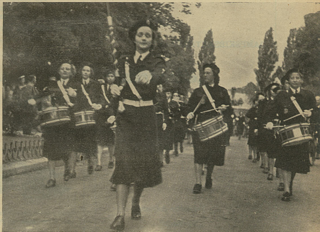
KVINDELIGE MARINERES Musikkorps med den nye — af Marineforeningen skænkede — Tambourstav.