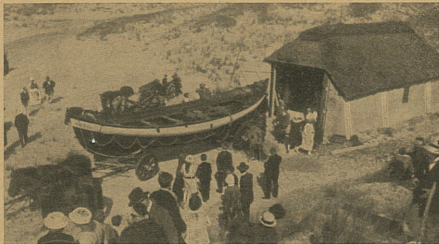
Sommergæster som interesserede Tilskuere ved en af Redningsvæsnets Øvelser paa Stranden.