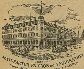
MANUFAKTUR EN GROS OG FABRIKATION DANSK PLYS OG MØBELSTOF-FABRIK I KÅSTRUP