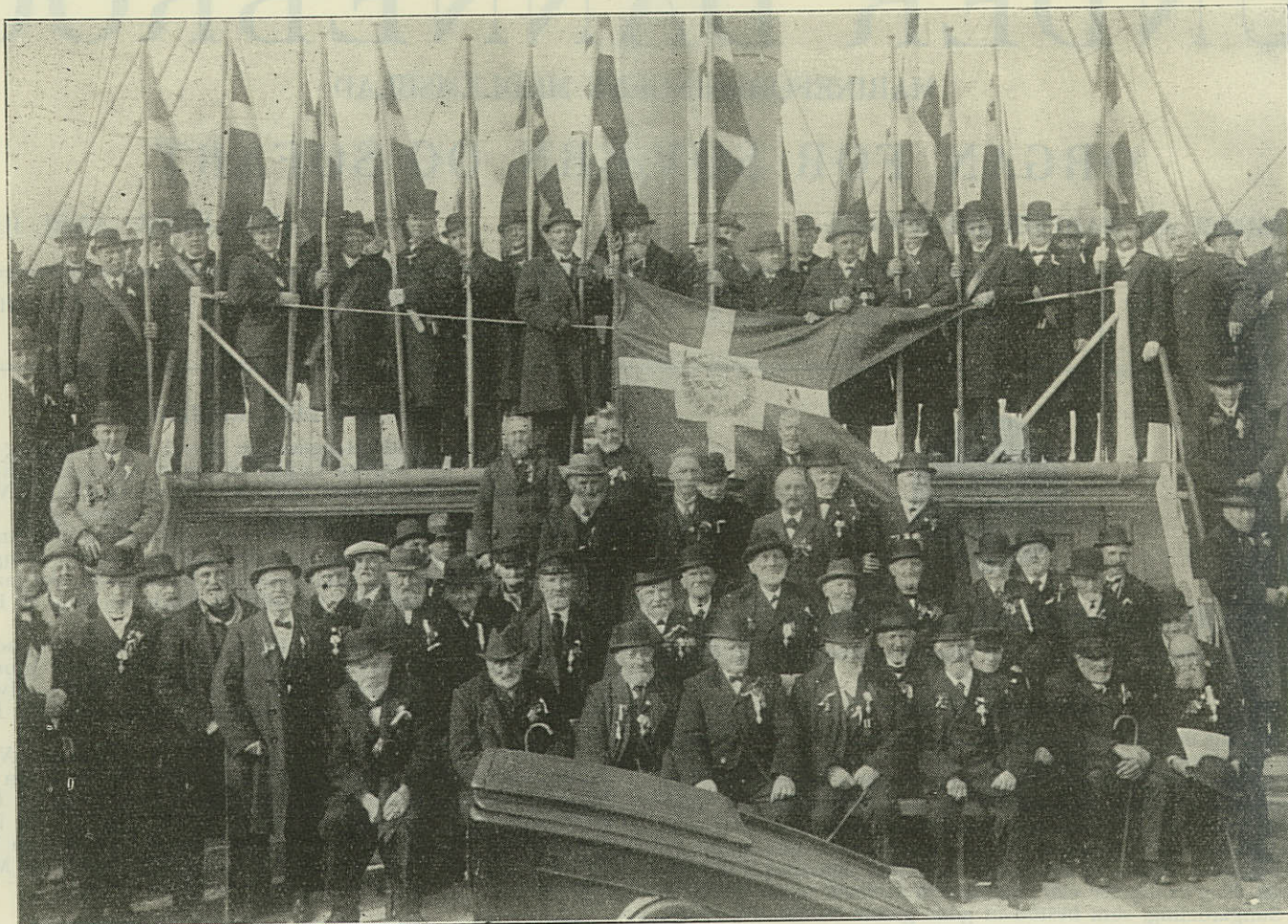
Veteranerne om Bord i Fregatten »Jylland« den 9. Maj.