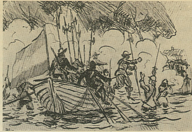
Landgangen ved Kjerteminde.

perne for at søge Fjenden, og Ruyter lod Broen ved Kærteminde over Fjorden bevogte af 130 Matroser, men Storm nødte ham til foreløbig at blive liggende med Flaaden. 12. November skrev Kong Frederik et Takkebrev til ham for hans tapre og mandige Assistentens ved den vellykkede Landgang.