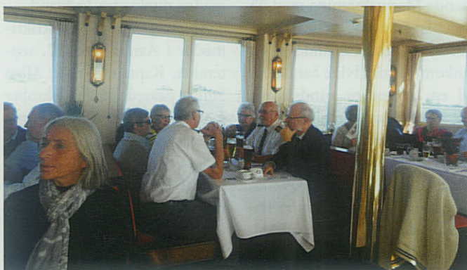
▲ Under Esbjerg Marineforenings udflugt til Nordtyskland blev der tid til en sejltur på floden Slien.