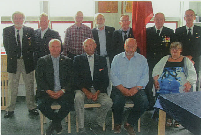
▲ 11 medlemmer modtog under sommerfesten i Horsens Marineforening deres retvisende tegn og emblemer.