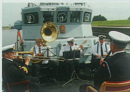
▲ Fem medlemmer af Marinehjemmeværnets Musik- og Tamburkorps i Randers musicerer på fordækket af en MHV 800-klassen fartøj.

Af Leif Bruun Eriksen. Marinehjemmeværnsløjtnant, presseofficer i MHV-distrikt Vest.