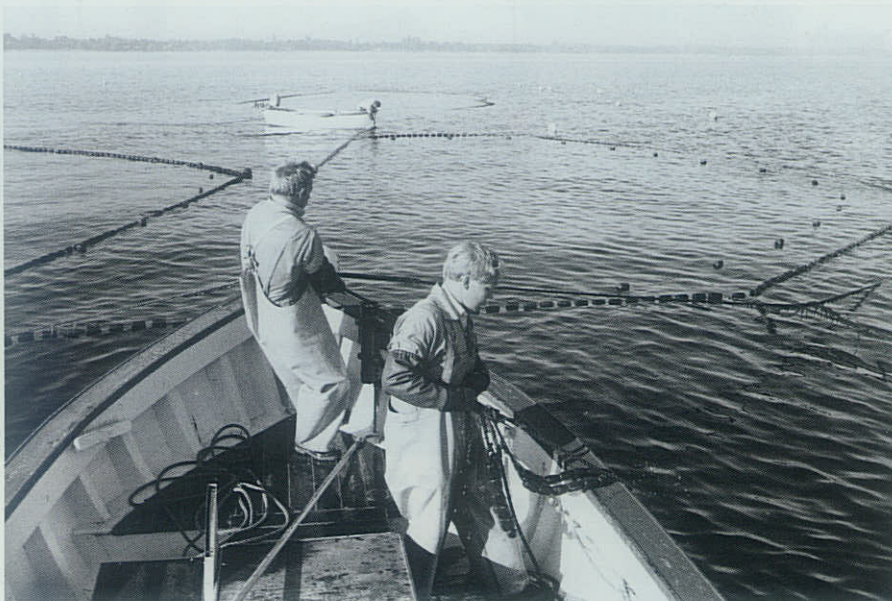
▲ Arbejdet med bundgarnsfiskeriet foregår primært under rolige vejrforhold.