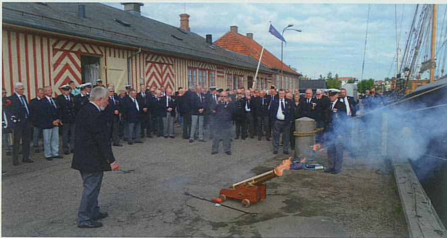
▲ Afskedssalut på Jessens Mole, Svendborg.

Svendborg Marineforening fik den 25. september foden under eget bord. Tidligere rederidomicil huser nu en af Danmarks Marineforenings største lokalafdelinger.