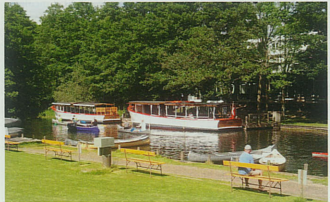
▲ De populære turbåde, der besejler Furesø, lagde den 25. august dæk til Kongens Lyngby Marineforening årlige sejltur.