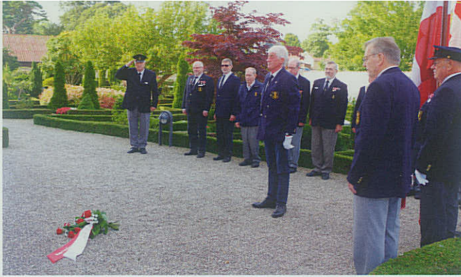
◀ Køge og Stevns Marineforeninger lægger den 4. oktober blomster ved mindetavlen på Herfølge Kirkegård.