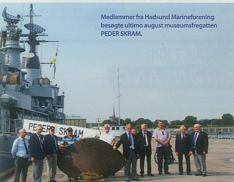
Medlemmer fra Hadsund Marineforening besøgte ultimo august museumsfregatten PEDER SKRAM.