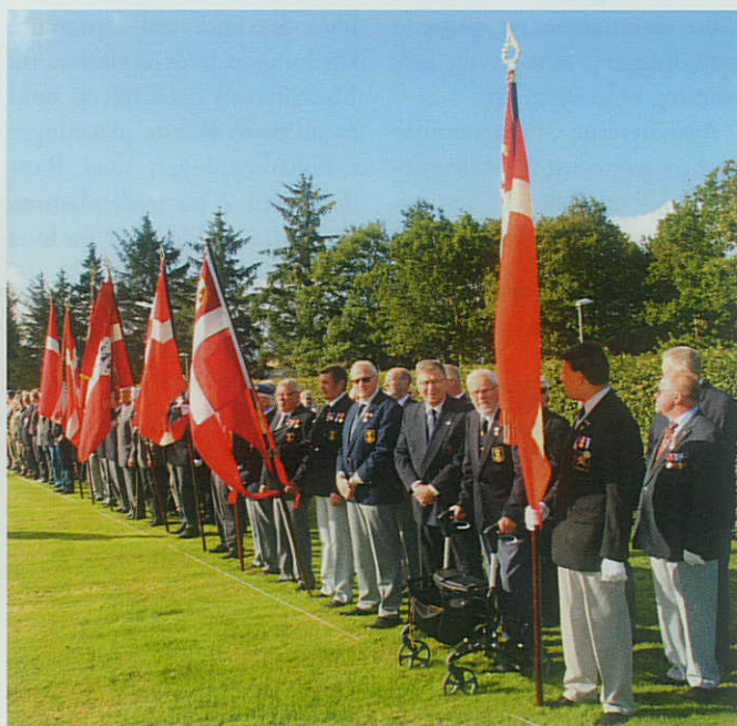
▲ Ti mand fra Skive Marineforening deltog den 5. september i markeringen af Den Nationale Flagdag på Skive Kaserne.

fra de to arbejdsgrupper omkring Danmarks Marineforenings fremtidige opbygning.