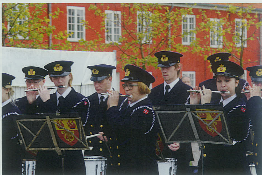
▶ Marinehjemmeværnets Musik- og Tamburkorps underholder på Kastellet i København.

Musik må der til! Sådan har parolen altid lydt i Marinehjemmeværnets Musik-flotille, der har hjemme i Randers og hvis speciale er leverancen af stemningsfulde toner til alle formål.