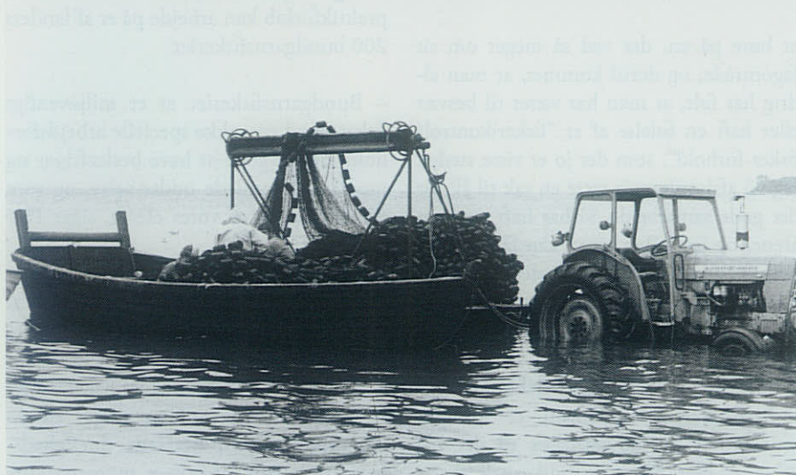
▲ Landbaseret maskinkraft er en del af bundgarnsfiskeriet.

plads og samlede fiskeriet i én samlet bedrift.