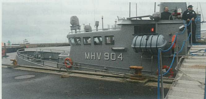
▲ Besætningen på MHV 904 LYØ gør klar til havnerundfart med gæster fra Esbjerg Marineforening.