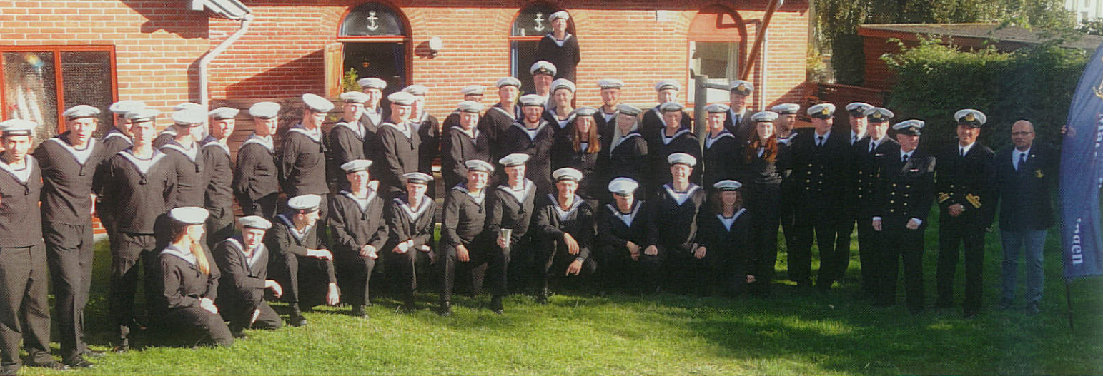
▲ Vagtfri besætning fra kongeskibet DANNEBROG på plænen foran marinehuset i Frederikshavn.

ager Fjord. – I år gik turen til Hølet som er fjordens perle. Vi sejlede kl. 10.00 i fire af medlemmernes både. Besætningerne havde selv medbragt fortæring og drikkevarer. Hølets Bådelav har en dejlig overdækket terrasse, hvor vi spiste frokost. I alt var vi 14 personer med på turen, der sluttede ved Hobro Lystbådehavn sidst på eftermiddagen.