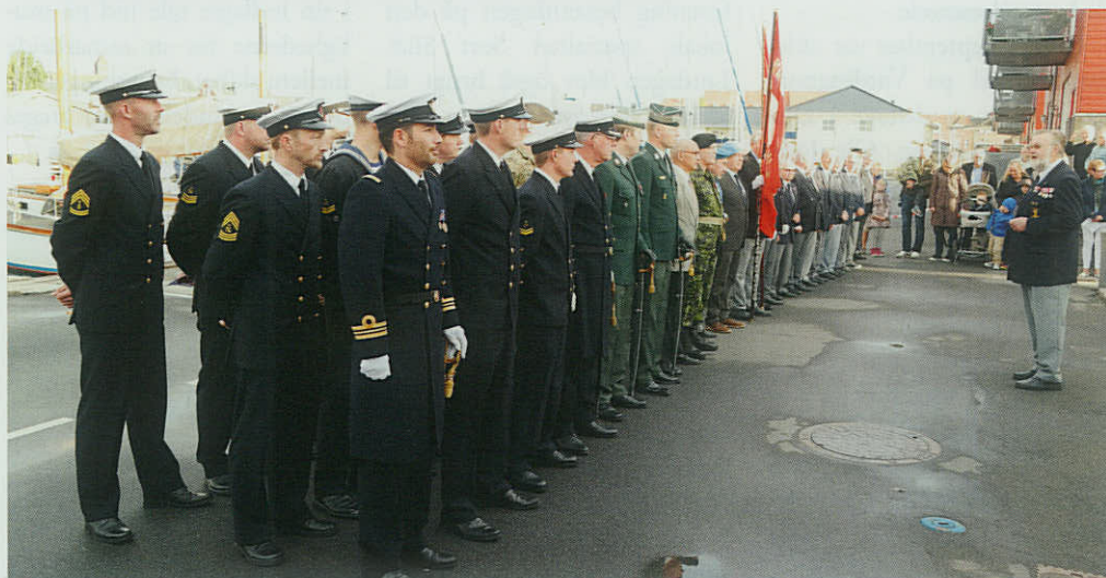
▼ Vagtfri besætning fra patruljefartøjet P 522 HAVFRUEN deltog den 5. september i markeringen af Den Nationale Flagdag i Nyborg.