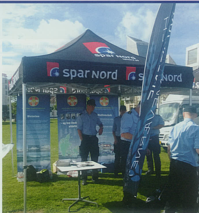
▲ Aalborg Marineforening og Marinehjemmeværnets fællesudstilling på havnefronten i Aalborg under arrangementet "Kajakroning fra Nibe til Aalborg".

først stået på et velbesøgt jazzmatine med hovmesterfrokost. Dernæst middag til de medlemmer der gennem godt to uger malede hele marinehuset fra øverst til nederst.