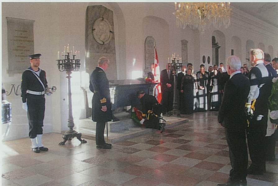
◀ Kronprinsen lægge krans ved Tordenskiolds sarkofag i Holmens Kirkes Kapelsal.

Tordenskiolds fødselsdag den 28. oktober markeres hvert år i København og Frederikshavn. I år kunne Selskabet Danske Tordenskiold-Venner samtidig fejre selskabets 50 års-jubilæum.