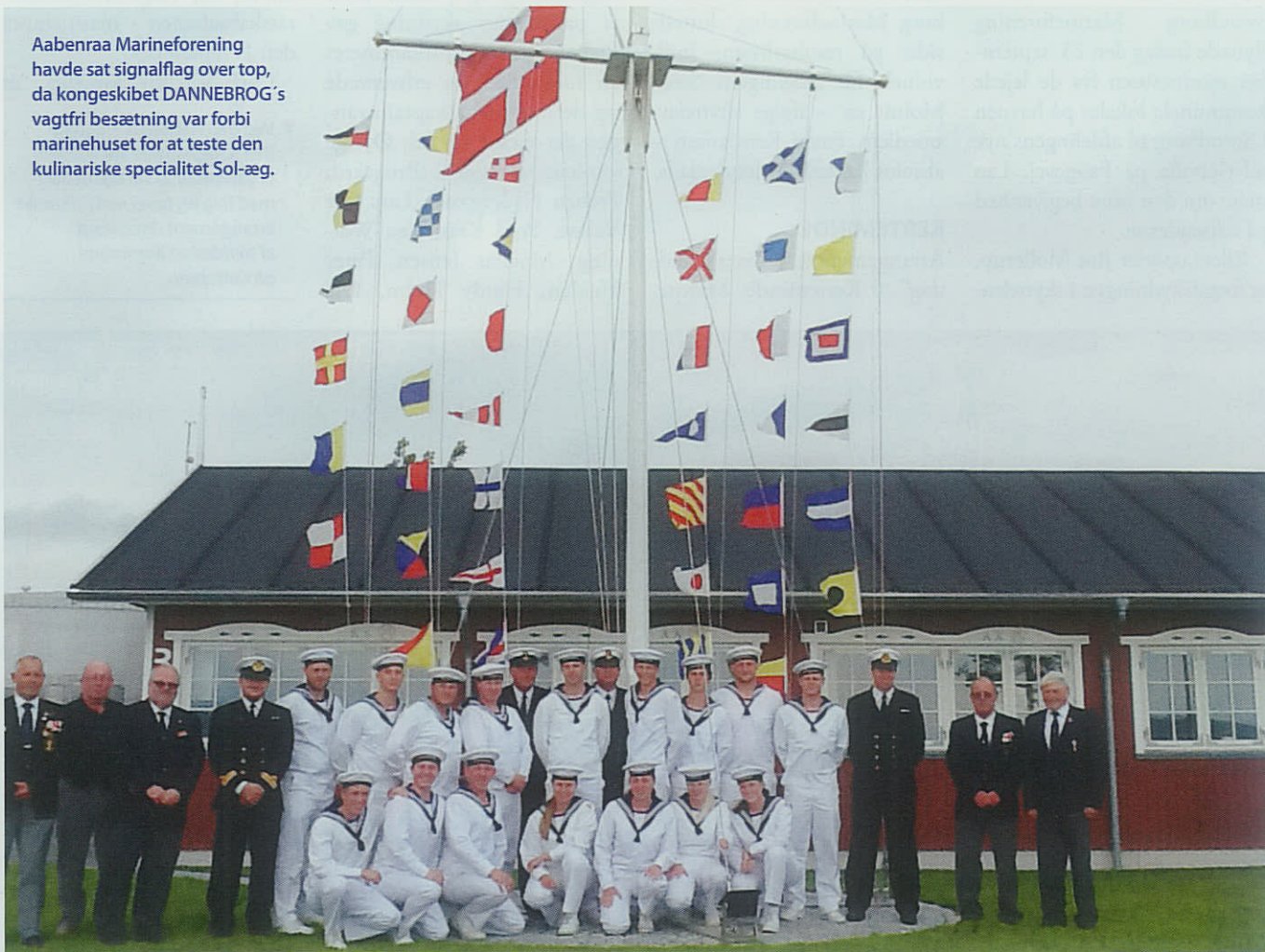
Aabenraa Marineforening havde sat signalflag over top, da kongeskibet DANNEBROG's vagtfri besætning var forbi marinehuset for at teste den kulinariske specialitet Sol-æg.