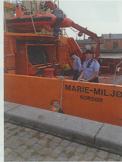
▲ Miljøskibet Y 563 MARIE MILJØ lægger til kaj i Stege i forbindelse med skibets adoptionsbesøg i Vordingborg Kommune.

Lørdag den 5. september bød Møens Handelsstandsforening besætningen på den lokale specialitet Sort Sild. Lørdagen blev også brugt til at åben skib arrangement med mange gæster, samt en afslut-