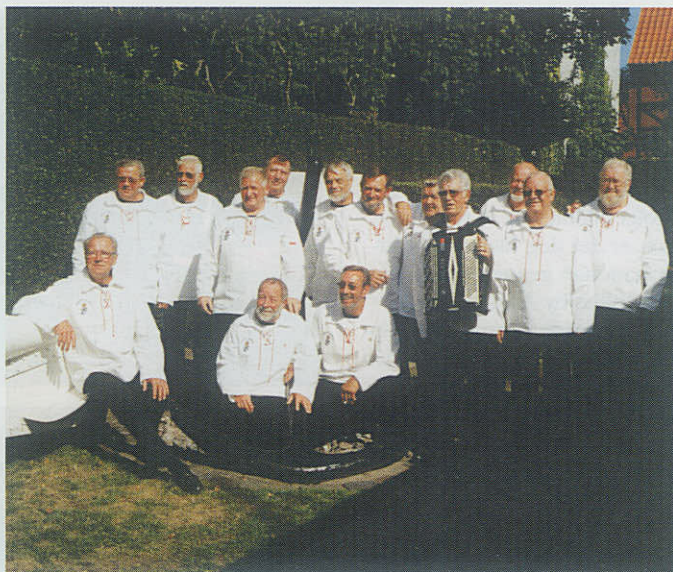
Shanty koret under Assens Marineforening anno 2004.

Det bliver til ca. 7 – 10 arrangementer om året, spændende fra optræden på plejehjem til større havneshow under byens store træskibstræf.