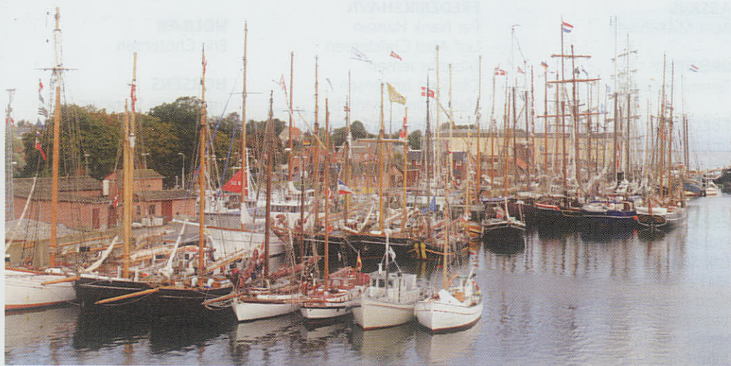
Marstal Havn fyldt op med 54 enheder der sammen fejrede Marstal Søfartsmuseums 75 års jubilæum.

I alt 540 mennesker deltog i spisning og dans ombord på færgen "Marstal" der i en god sags tjeneste var taget ud af den ordinære drift. Herudover var der Jazz i lastrummet på coasteren "Samka", skipper-