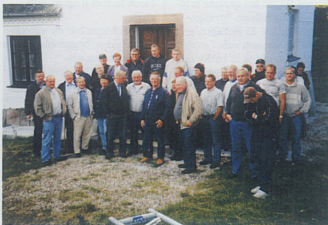
Deltagerne ved Gilleleje Marineforenings sommerudflugt opstillet foran Nakkehoved Fyr.