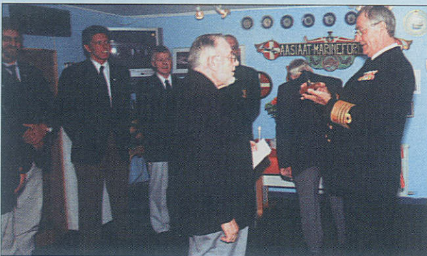
Prinsen modtager her gaven fra Egedesminde Marineforening. Gaven er fremstillet af barder fra grønlandshval og forestiller en hvalhale med Marineforeningens emblem.