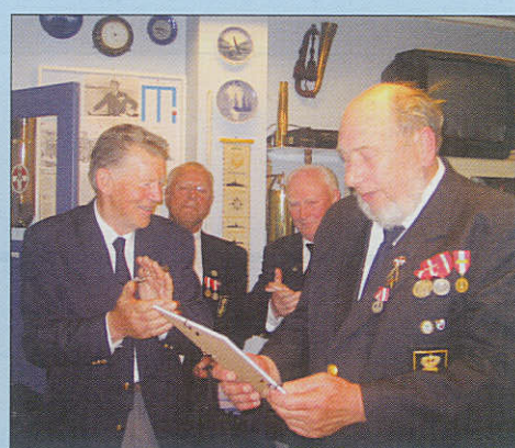
Glade miner præger jubilæumsreceptionen hos København Marineforening.