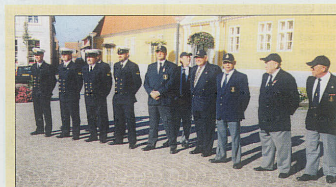
Besætningsmedlemmer fra "Marie Miljø" og medlemmer af Møens Marineforening på torvet i Stege.