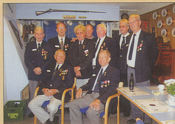
Brøndby Skyttelavs bestyrelse anno 2004

en pragtfuld aften med mas- ser af taler, muntre indslag og masser af sang og musik.