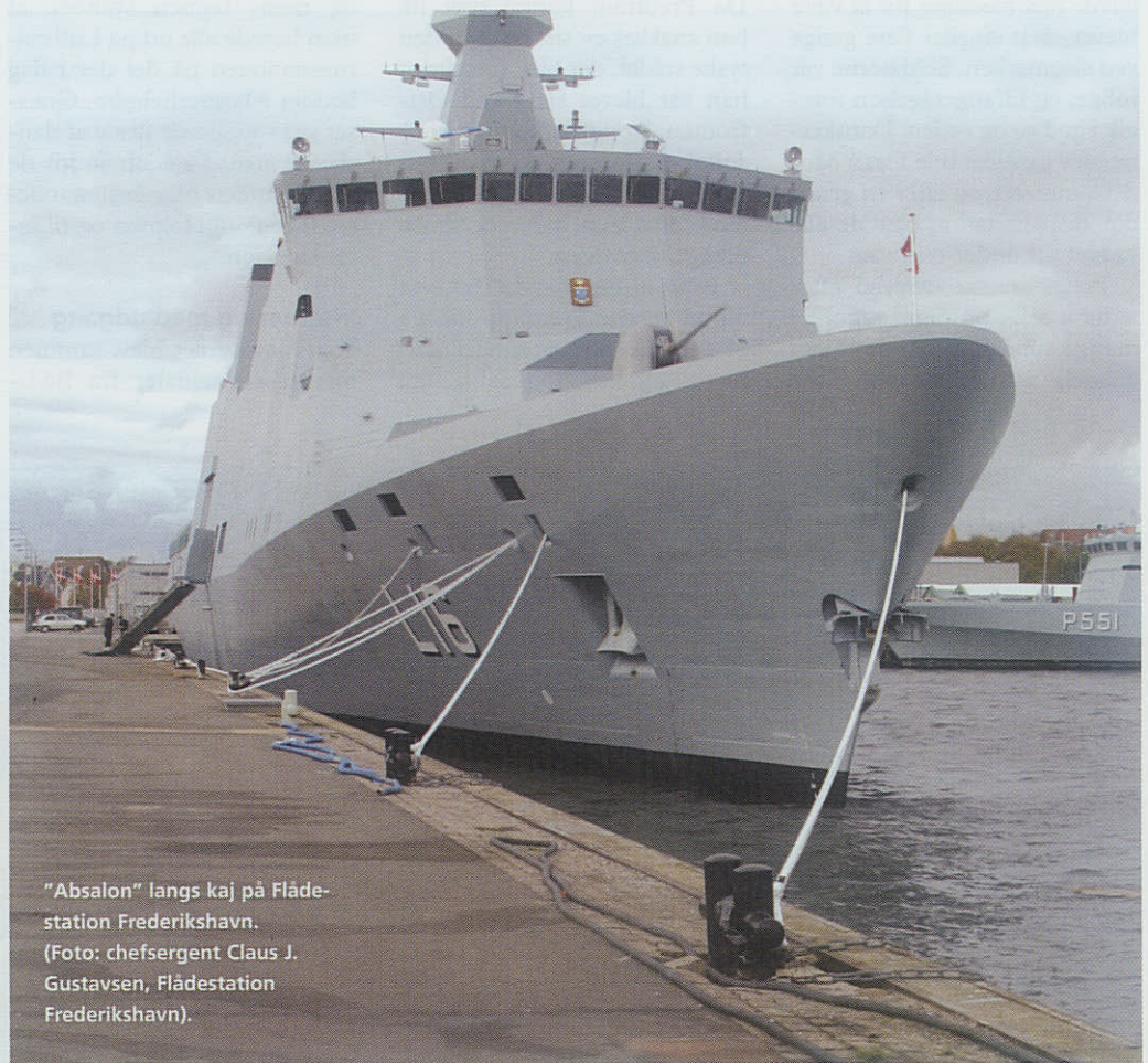
"Absalon" langs kaj på Flådestation Frederikshavn. (Foto: chefergent Claus J. Gustavsen, Flådestation Frederikshavn).

"Absalon" vil de kommende måneder gennemgå en række materielinstallationer samt gennemføre afprøvning af såvel skib som installeret materiel. Selvom skibet er klar til at udføre sine første roller i løbet af et par måneder, forventes det ikke færdigudrustet og fuldt operationsklart før i 2007.