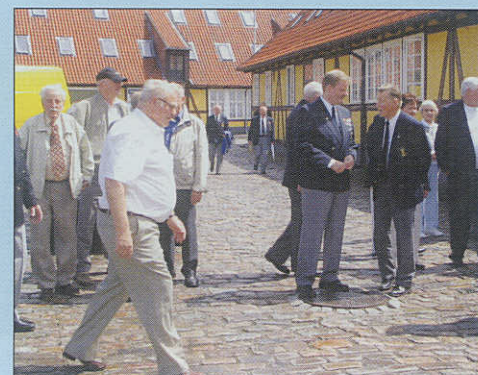
Trængsel foran København Marineforenings indgang. Godt 125 mødte frem til jubilæumsreceptionen.