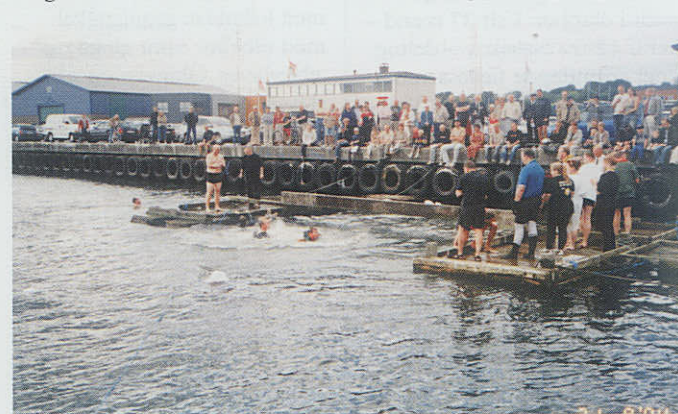
Det blev Kolding Marineforening der kom nogenlunde tørskoet i land ved "Gå planken ud" konkurrencen.

September bød på fisketur med få fisk men god stemning.