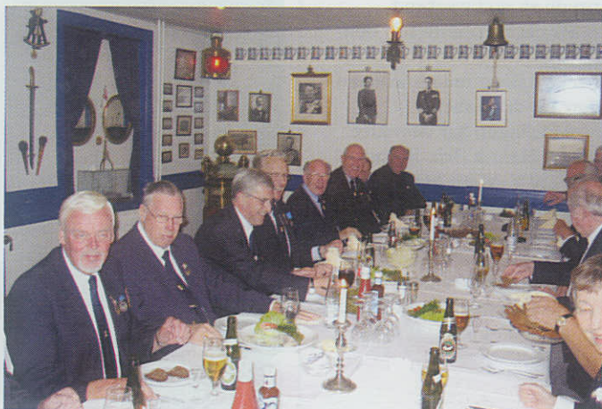
Så er der medlemsaften i Kongens Lyngby.

Turens hovedattraktion var Politimuseet på Blegdamsvej i København. Her fik deltager-