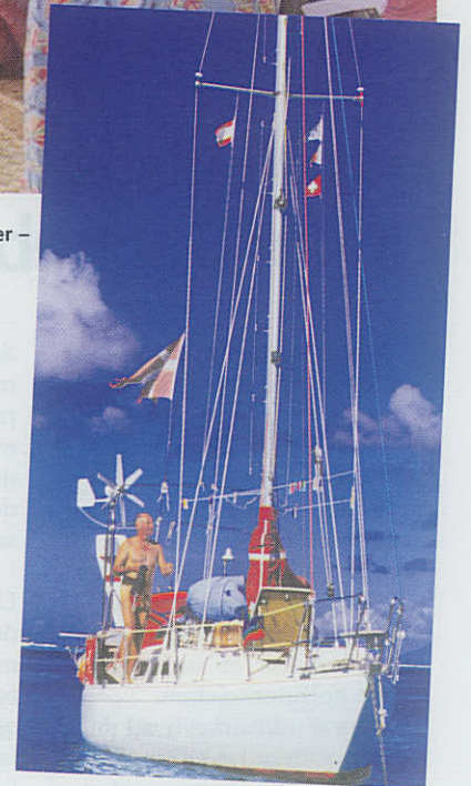
S/Y Joy for anker.

Møde med teknologisk vidunder – et kamera.