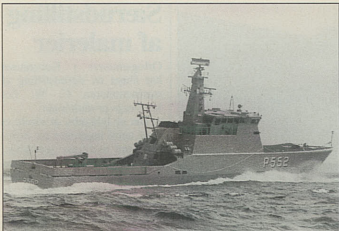
En standard Flex 300, som Aalborg nu får i trediedel størrelse.