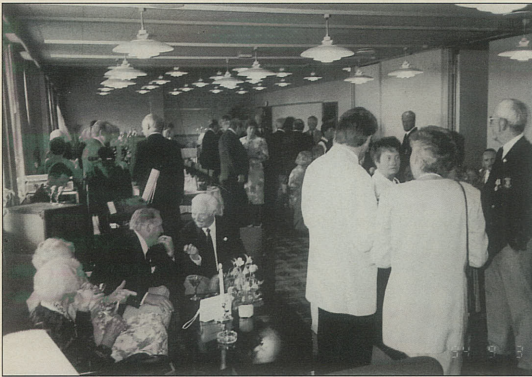
Festdeltagerne ved Assens-afdelingens jubilæum, inden gallamiddagen på Marcussens Hotel, i anledning af den driftige afdelings 80 års jubilæum. Tidligere har der i den anledning været afviklet reception.

Juelsminde blev der arrangeret frokost med tilbehør på et langbord ved kajen, hvilket også var medvirkende til at arrangementet blev en succes.