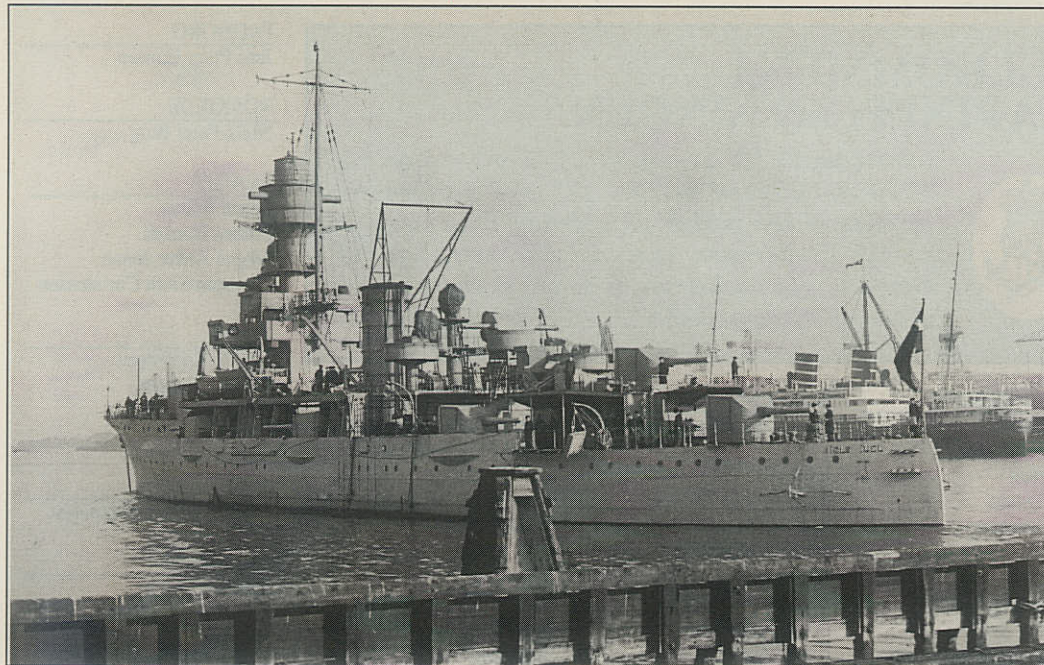
Artileriskibet »Niels Juel«, der sammen med »Peder Skram« overlevede søværnsordningen af 1932.