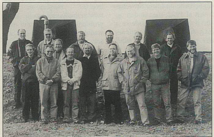
»Fylla«s tidligere besætningsmedlemmer samlet til et vellykket jubilæumstræf på Holmen.