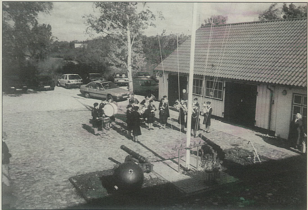
Kvindelige Marineres Musikkorps spiller op til Brøndby Skyttelavs 40 års jubilæumsreception.