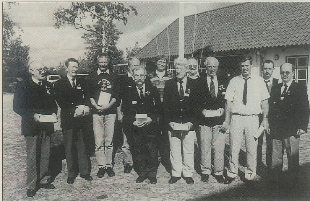
Her ses de 12 deltagende lavs bedste skytter med deres præmier fra årets landsskyttestævne.