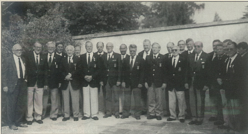
De herlige gutter, der deltog i distrikt 4s distriktmøde, der blev holdt i Haslev.