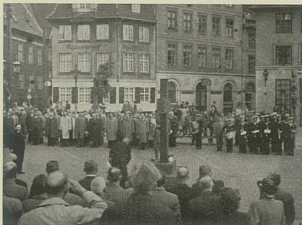
Kransenedlægningen ved Mindekorset i Nyhavn under Sendemandsmødet i København 23/5 1948.

Foreningens Økonomi. Det forrige Aars store Underskud paa ca. 10,000 Kr. krævede jo et alvorligt Greb i Kassen. Den paa sidste Sendemandsmøde vedtagne Kontingentforhøjelse paa 1 Krone har bragt Balance i Regnskabet i Aar, saaledes at vi har et beskedent Overskud; men her maa erindres, at „Under Dannebrog“, som bemærket, paa Grund af Typografstrejken ikke udkom i nogle Maaneder, hvorved de normale Udgifter, men ogsaa Indtægter ved Bladet, reduceredes i nogen Grad. Vi har i Hovedbestyrelsen vedtaget et bestemt Beløb, som Redaktionen af „Under Dannebrog“ skal overholde, fordi vi ellers risikerer, at Budgettet igen sprænges, hvis Udgifterne stadig stiger til Bladet.