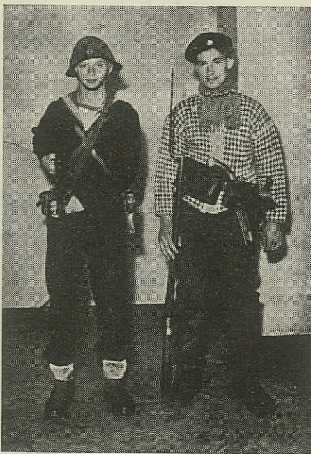
Skildvakterne fra Marineforeningens Festaften i National-Scala 22/5 1948 — i Uniformer fra 1948 og 1848.

Men Aaret 1947 bragte en lang og hæmmende Typografstrejke,