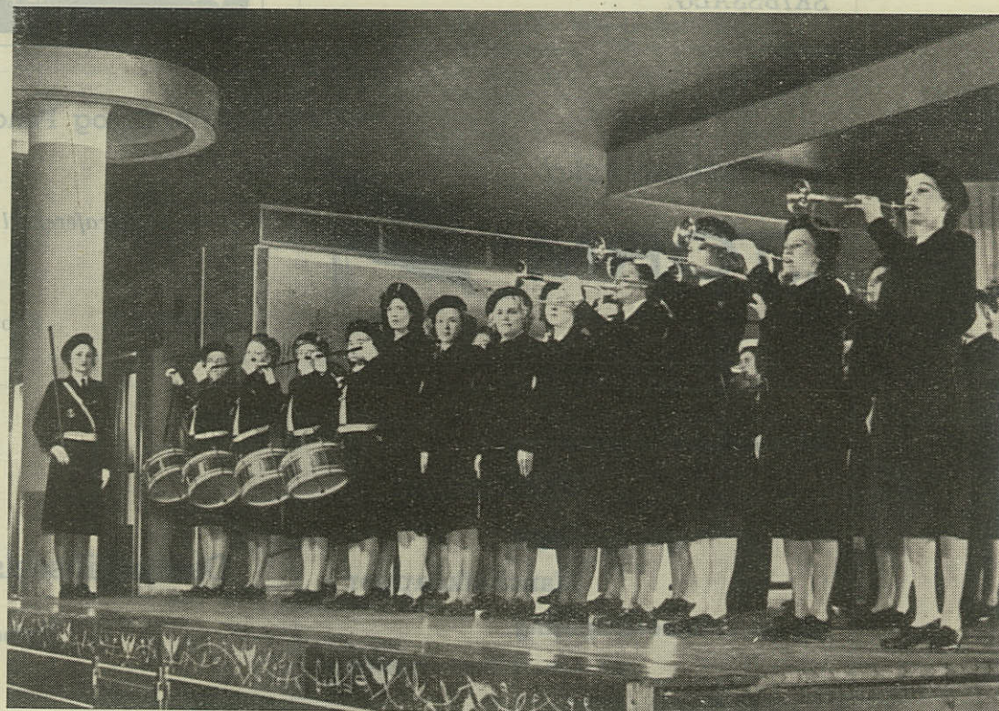
Hjemmeværnsforeningen KVINDelige MARINERE's Musikkorps ved Marineforeningens Festaften i National-Scala i København den 22. Maj 1948.