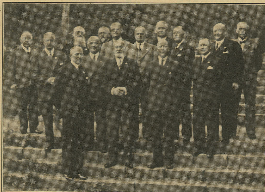
Marineforeningens Hovedbestyrelses Medlemmer ved Landsmødet i Kolding den 17. Maj 1936.