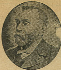
Dr. Alfred Nobel, Aktieselsk. Grundl.

Krudstof af spunden Nitrocellulosa. Røg- og askefri Forbrænding.