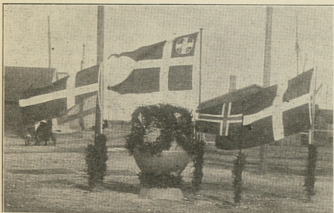
Minebøssen ved Grenaa Havn.