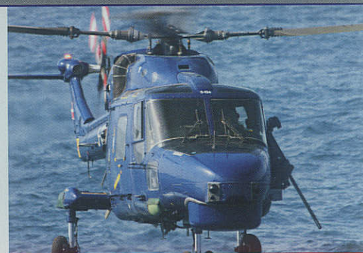
Lynx på Nato arbejde i Adenbugten. Derfor bevæbningen med tungt maskingevær.

Det er ikke længere kun Adenbugten, men hele det arabiske hav, som er skueplads for pirater-