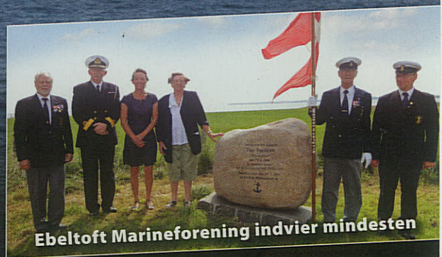
Ebeltoft Marineforening indvier mindesten