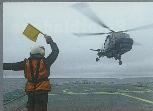
Afsæt fra helikopterdækket.

Og ude i horisonten venter en endnu ukendt skibsbaseret helikoptertype på at gøre sin entre i Flyvevåbnet som den nye afløser for Lynx'en. Selv om den nye helikopter ikke er valgt, og i øjeblikket endda ikke forventes anskaffet før i 2015, overvejes det allerede nu, hvordan man kan have uddannet personel klar til at blive omskølet til en ny helikopter. Uanset størrelsen på helikopteren og antallet af indkøbte helikoptere, skal eskadrille 723 have tilgang af mere personel. Enheden skal jo kunne levere deres produkter til kunderne i Nordatlanten, i Danmark og til internationale operationer, samtidig med at besætningsmedlemmerne og det tekniske personel bliver omskølet til en ny helikoptertype.