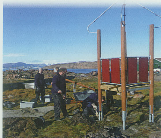
En sømand skal kunne lidt af alt. Det beviste besætningen på inspektionsfartøjet EJNAR MIKKELSEN, da de på bedste vis udførte entreprenørarbejde i Qeqertat.

Foto: Inspektionsfartøjet EJNAR MIKKELSEN