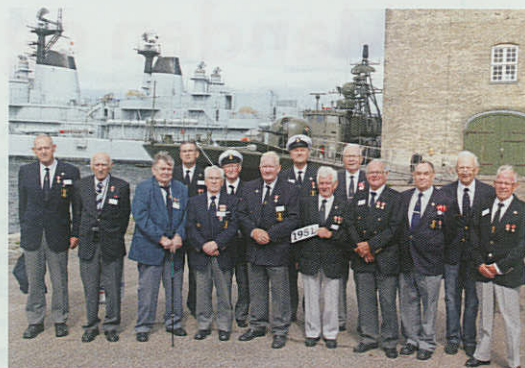
60 års jubilarerne.