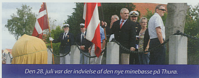
Den 28. juli var der indvielse af den nye minebøsse på Thurø.