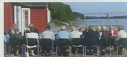
Pinsemorgenarrangementet ved Middelfart Marinestuen blev benådet med et fantastisk vejr.