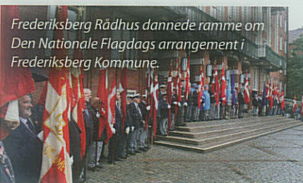
Frederiksberg Rådhus dannede ramme om Den Nationale Flagdags arrangement i Frederiksberg Kommune.