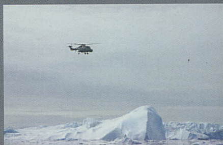
Lynx helikopter på arbejde i Grønlands farvand.

Der er lige nu, men også i en overskuelig fremtid et stort og stadig stigende behov for eskadrillens kerneydelser, som er skibsbase-rede helikopteroperationer. Alene antallet af nye flådefartøjer med helikopterdek kombineret med et stadigt større politisk ønske om tilstedeværelse i både Nordatlanten og i Aden-bugten peger på, at eskadrillens særlige kompetence ikke umiddelbart bliver overflødig. Tværtimod. Derfor er der både behov for at få ansat medarbejdere til at fylde hullerne i organisationen og behov for at producere flere flyvetimer, så nye besætningsmedlemmer og teknisk personale kan blive uddannet og trænet. - Og set i det lys er det bestemt væsentligt og rigtigt godt, at der synes at vise sig en tendens til, at vi kan udnytte de samme timer bedre, siger TUR.