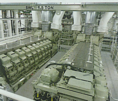
Maskinrummene på IVER HUITFELDT fremstår flot og skinnende.