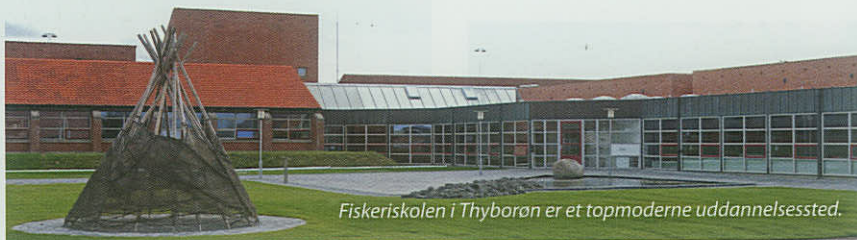
Fiskeriskolen i Thyborøn er et topmoderne uddannelsessted.

Interesserede kan læse mere på fiskeriskolen.dk