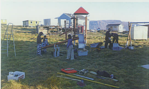
Børnene i Qeqertat er i gang med at lege på deres nye legeplads inden den er færdig.

Det "skæve" er som regel forbundet med noget, der ikke ligger inden for det normale og opfattes ofte, som noget der er forkert, defekt eller en fejl. Men under skibet EJNAR MIKKELSEN's togt i Nordvestgrønland var de skæve opgaver derimod dem, som gav den til tider rutineprægede arbejdsdag for besætningen et kærkommen afbræk til også at løse "bløde" opgaver til glæde for dem selv og andre.