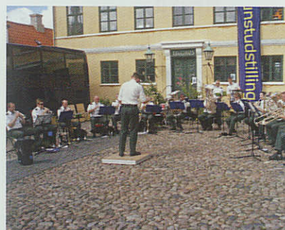
Torvekoncerterne i Ebeltoft med Prinsens Musikkorps, arrangeret af blandt andet Ebeltoft Marineforening, er blevet en publikumssucces.

Randers, Grenaa og Ebeltoft Marineforening.