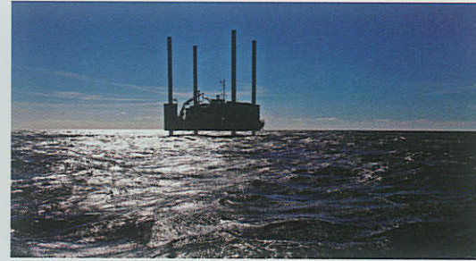
Forberedelserne til Anholt Havmøllepark er i fuld gang

Kraner, læssemaskiner, trucks samt diverse udstyr Max kapacitet 120 t ved 23 m, rækkevidde op til 48 m, 18 m 3 Se flere detaljer på www.grenaaahavn.dk