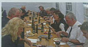
Med folkene i Vejle Marineforenings nye skyttelav som tovholder blev sommerfesten i juni en stor succes.