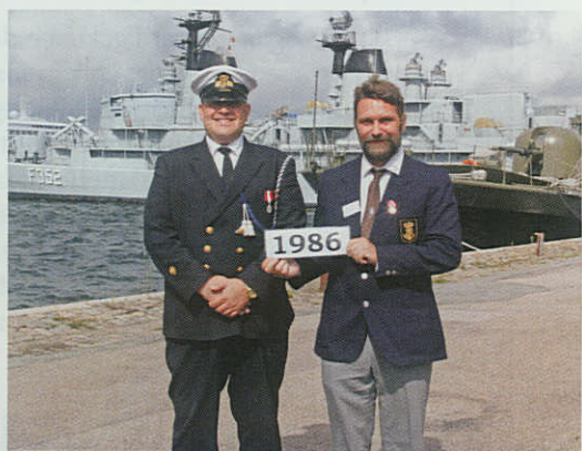
25 års jubilarerne.

På den baggrund blev årets jubilarstævne også i år afsluttet til samtlige 250 deltagere fulde tilfredshed.