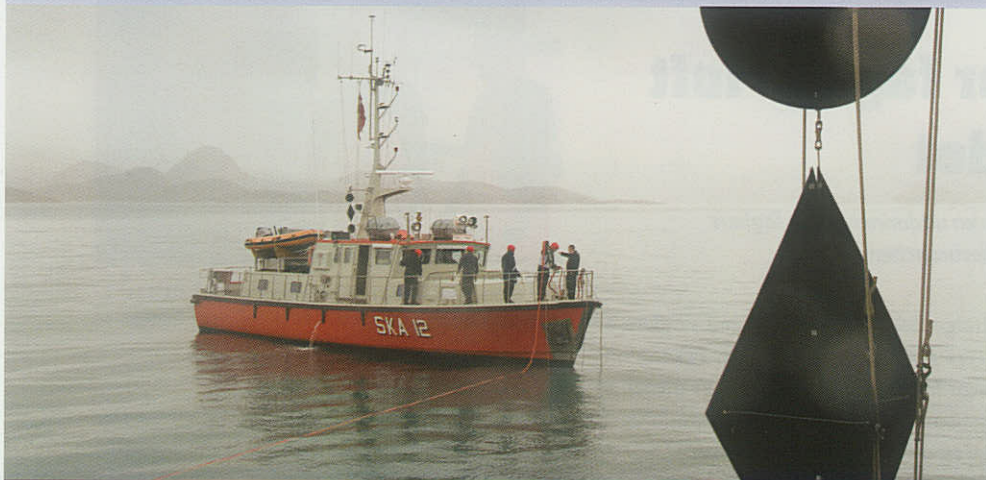
Opmålingsskibet SKA12 har sejlet søopmåling i grønlandske farvande siden 1989. Begge skibe hejser signalet kugle-diamant-kugle, inden en opmåling begynder. Det betyder begrænset manøvreedygtighed.

– SKA12!” BIRKHOLM svarer straks: “SKA12 – BIRKHOLM her.” De enes hurtigt om en ankerplads for natten et par timers sejlads væk. Det er fyraften onsdag den 27. juli 2011.