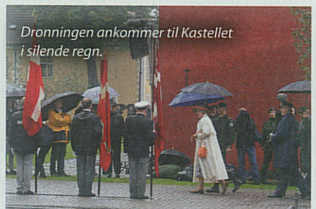
Dronningen ankommer til Kastellet i silende regn.