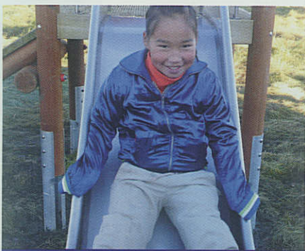
Hjælpen fra besætningen på EJNAR MIKKELSEN fik de store smil frem.

Udover de daglige opgaver, som består i suverænitetshævdelse, fiskerikontrol, søredning og meget andet, deltog EJNAR MIKKELSEN i en større redningsøvelse sammen med inspektionsskibet HVIDBJØRNEN og en fregat fra Canada. Skibets besætning fik i den forbindelse også mulighed for et besøg i Canadas nordligste by "Grisefjord".