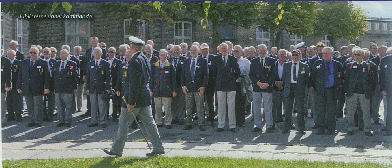
Jubilarene under kommando.