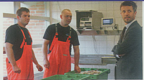
Ved et tidligere besøg på Fiskeriskolen i Thyborøn ser Kronprinsen ud til at være tilfreds med de faglige forhold.

Indgangen til uddannelsen kan starte på tre forskellige måder. Eleverne kan starte direkte på grundforløbet, begynde med en praktikaftale eller som den tredje mulighed gennemgå uddannelsen via en ny mesterlære. Forløbet tager minimum 3 år og afsluttes med en svendeproeve.