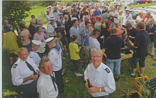
Mindestensafsløringen den 29. juli 2011 var tilsmilet af godt sommervejr.

Da vandet blev så dybt, at det nåede ham til brystet, tog han linen i munden, og satte skuldrene op mod bølgerne. Med lange seje svømmetag lykkedes det ham at svømme ud til de nødstedte, der nu var meget for-