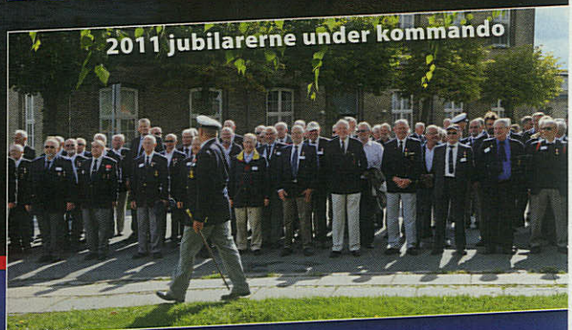
2011 jubilarene under kommando