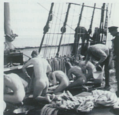
Store vaskedag på Georg Stage.

Men hvorom alting er – skibene er stadig de samme her snart 80 år efter søsætningen.