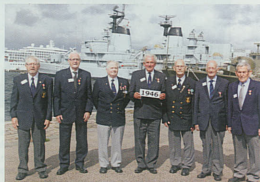
65 års jubilarerne.

Et af Jubilarstævnernes vigtigste ingrediens er de mange marineforenings kollegaer fra Sjælland, der år efter år stiller op, og gør et kæmpe arbejde, for at den afsluttende forplejningsdel foregår så optimal som muligt. De senere år