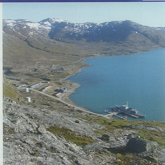
Forsvarets fremtidsplaner for Grønnedal i Arsurk Fjorden i Grønland er endnu ikke klarlagt.

mære opgave bliver at styre og koordinere indsættelse af forsvarets enheder i Nordatlanten og Arktis. Kommandoen vil være kontaktpunkt i samarbejdet mellem forsvaret og de lokale myndigheder. Herunder Grønlands selvstyre, rigsombudsmanden, politimesteren i Grønland med flere. Forbindelseselementet på Færøerne vil være ansvarlig for dialogen og samarbejdet med de lokale myndigheder på Færøerne. Tidshorisonen for etablering af den nye kommando afhænger af en række forhold, blandt andet tilvejebringelse af faciliteter i Nuuk og Tórshavn.