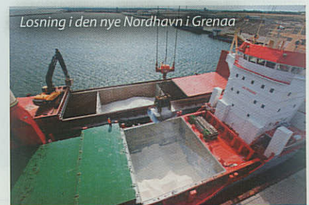
Losning i den nye Nordhavn i Grenaa

Kajnære arealer er eftertragtede, hvilket også har været en vigtig faktor for, at Siemens Wind Power har valgt at benytte Grenaa Havn som formontage- og udskibningshavn for Anholt Havmøllepark. Grenaa Havn er for øjeblikket i gang med at klargøre 130.000 m 2 til Siemens Wind Power, som yderligere skal leje 360 meter kaj i forbindelse med havmølleprojektet. Der skal opstilles 111 stk. 3,6 MW havmøller i Anholt Havmøllepark og i 2012 vil man i Grenaa for alvor begynde at mærke "invasionen" af tunge køretøjer, møl-