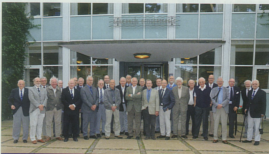
29 mand fra Søværnets kadetaspiranthold "august 1951" foran Søværnets Officersskole, Holmen, København.