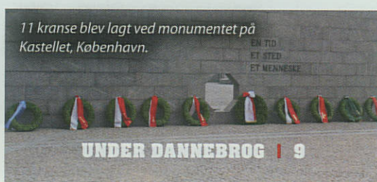
11 kransede blev lagt ved monumentet på Kastellet, København.