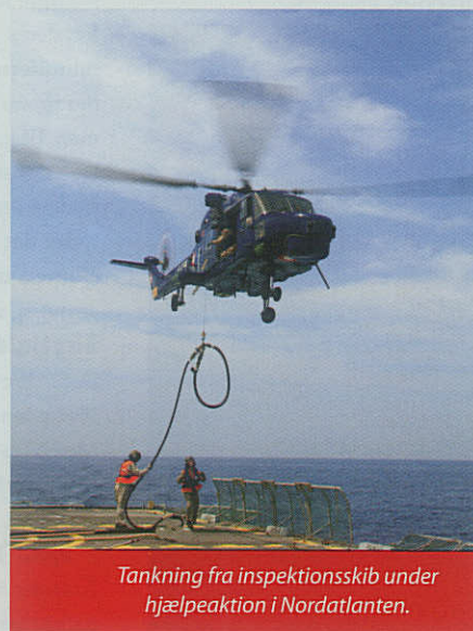
Tankning fra inspektionsskib under hjælpeaktion i Nordatlanten.

Missionen blev en succes. Men kort tid lå mellem succes og nederlag, for vejret var en utilregnelig modstander. Og rigtigt meget ligger i hænderne på besætningen, når der skal reddes menneskeliv. Kendskab til vejr og til terræn er ofte afgørende for udfaldet.