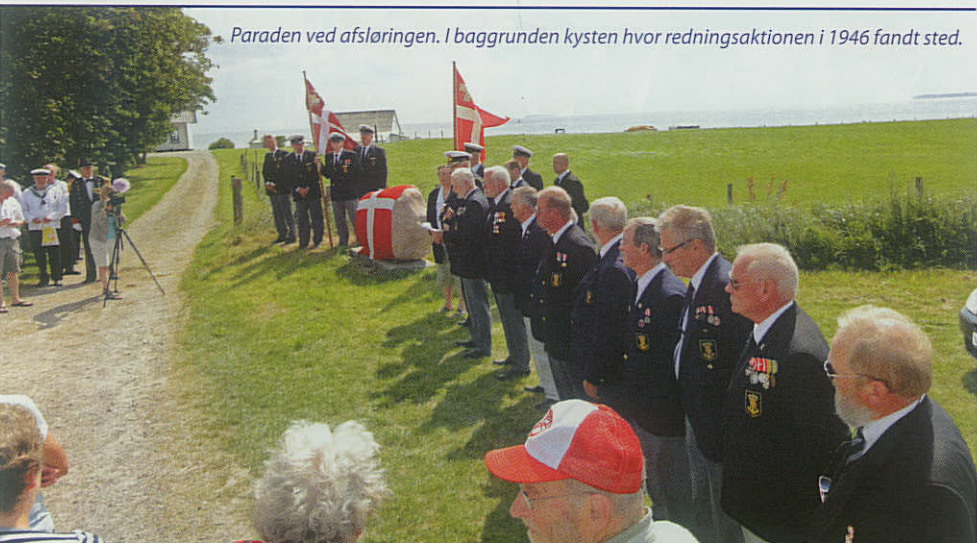
Paraden ved afsløringen. I baggrunden kysten hvor redningsaktionen i 1946 fandt sted.