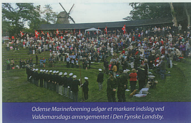
Odense Marineforening udgør et markant indslag ved Valdemarsdags arrangementet i Den Fynske Landsby.