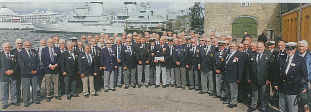
50 års jubilarerne.