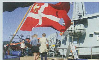
Danmarks Marineforening og Marinehjemmeværnet udgør et stærkt makkerpar under havnefesten "Frederikssund for fulde sejl".

Arrangementet gav lejlighed til at vise flaget samt udlevere brochurer og anden information om Danmarks Marineforening.