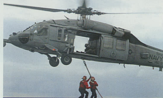
MH-60R SEAHAWK klar til landing på US enhed.

Den Amerikanske Flåde ser Romeoen som en helikopter, der forsat vil udvikle sig over