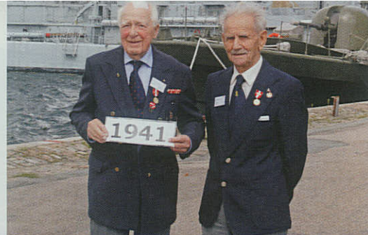
Tre af de fire 70 års jubilarer.