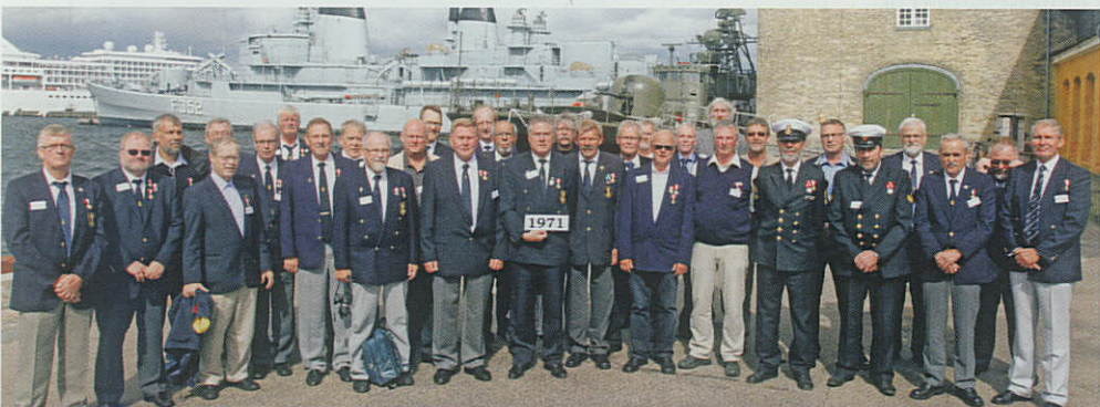
40 års jubilarerne.