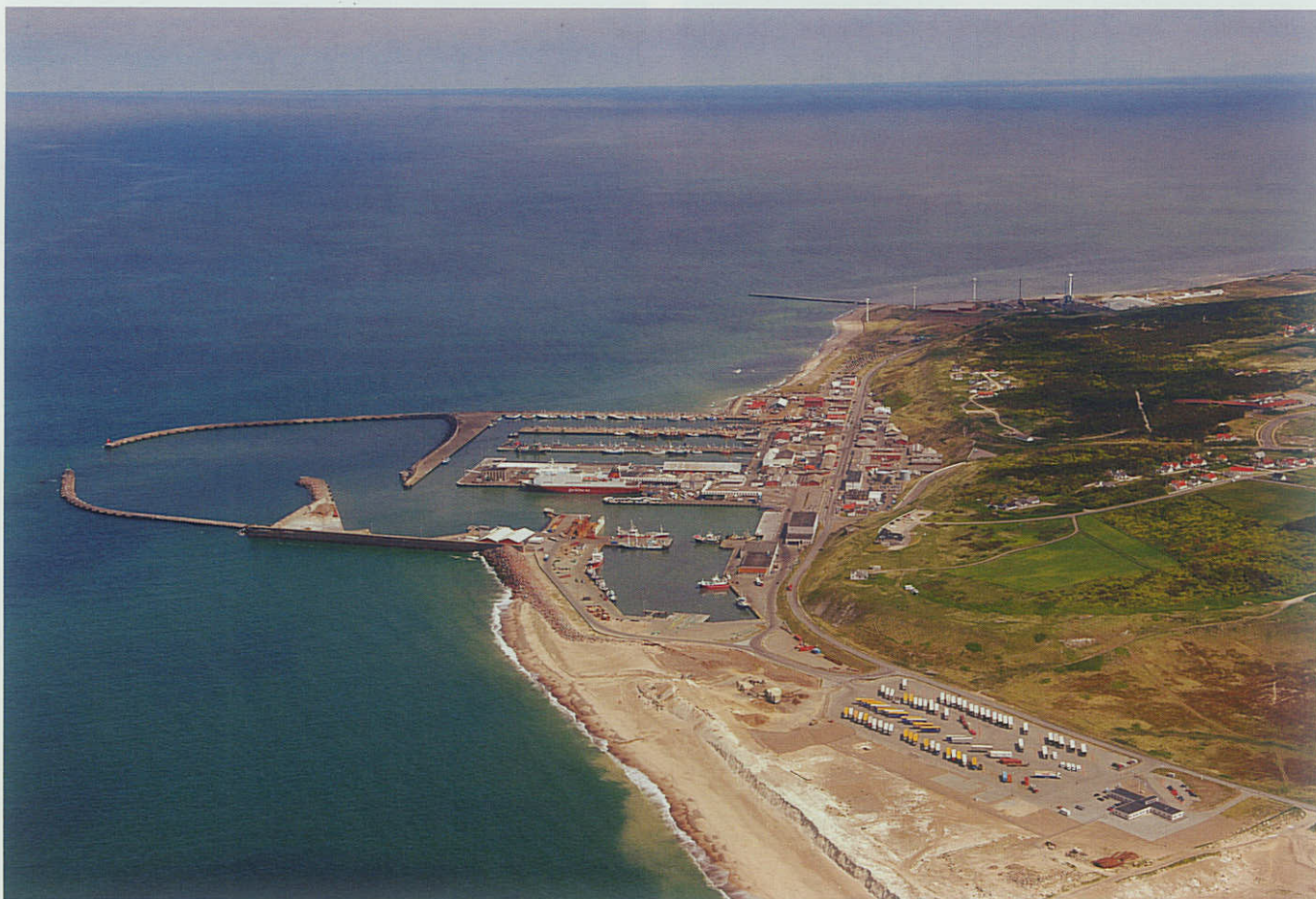
Den store yderhavn (tv i billedet) nedbryder ikke søen nok til, at Fjordline vil anløbe Hanstholm Havn i hårdt vejr.

ning i indeværende år sammenlignet med tilsvarende periode i 2007. På den baggrund kommer den kommende udviklingsplan for Hanstholm Havn i høj grad til at beskæftige sig med udviklingen af fiskerihavnen.