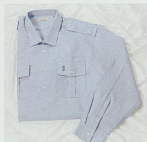
Skjorte med lange ærmer. Leveres i hvid og lyseblå. Str. 37/38-49/50