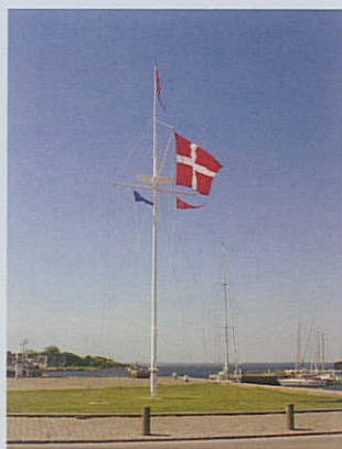
Vordingborg Kommunes nye flagmast på Stege Havn. Bemærk Marineforeningens vimpel tv.

Inden starten på fregatskydningen den 16. august, blev landsbestyrelsesmedlem og flere