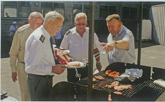
Medlemmer af København Marineforening griller i Søofficersskolens gård.

sluttede med manér på Hvids Vinstue. Her gjorde håndmadder plus diverse sammen med hyggesnakken godt. (Begge indlæg er bragt i fuld længde i Brøndby Marineforenings lokalblad. red.).