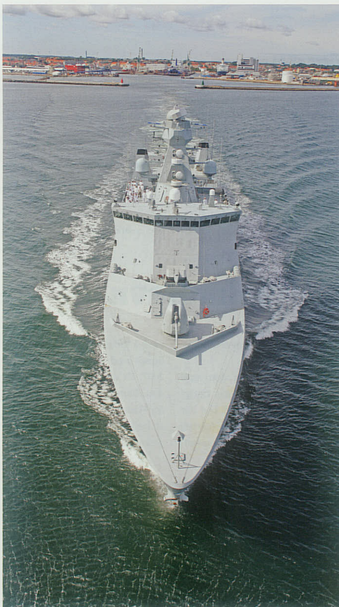
ABSALON står ud fra Frederikshavn under deployering til Afrikas Horn.