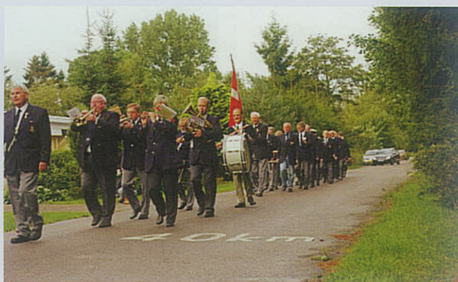
Køge Marineforening sendte en styrke på 44 mand til kamp mod fregatten SCHWARZENBERG.

Arrangementer sluttede med frokost til de 50 fremmødte medlemmer og ledsagere. Tre halve flasker brændevin fra det nye