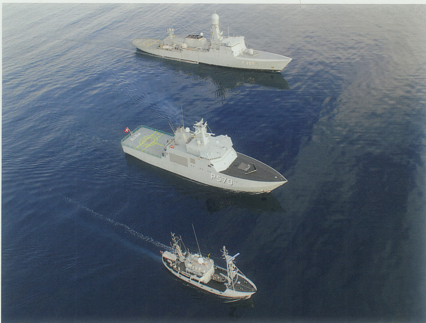
Søværnets tre typer enheder i Nordatlanten. Øverst THETIS-klassen. I midten den nye KNUD RASMUSSEN- klasse og nederst AGDLEK-klassen.

Det viser også, at Søværnet er pa- rat og at Søværnet besidder kapa- citeterne til indsættelse hvor det måtte være nødvendigt.