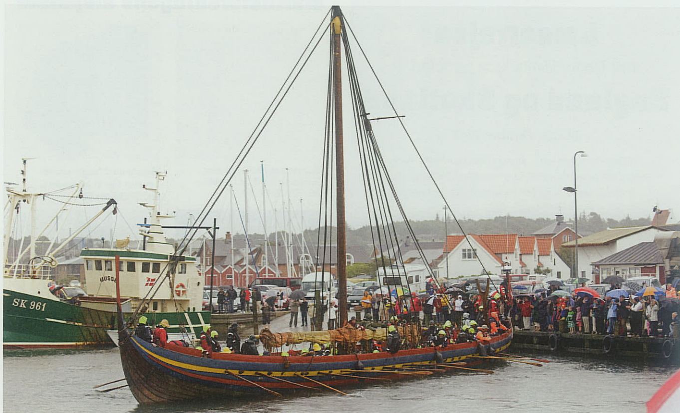
»Havhingsten fra Glendalough« afgår i en regnbyge fra Glyngøre Havn med kurs mod Hals og efterfølgende Roskilde.