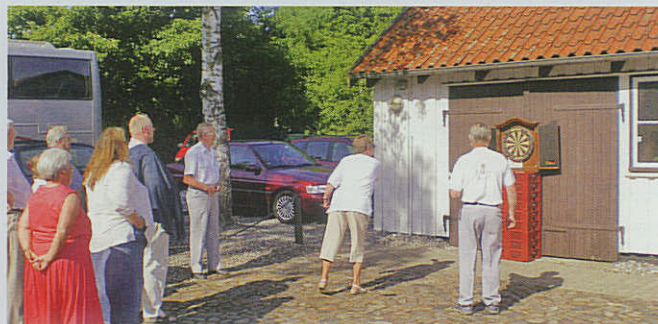
Der kæmpes hårdt i Marinegården i Brøndby.