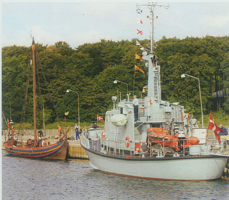
»Havhingsten« og MHV 807 JUPITER ved kaj i Kongsøre

»Havhingsten« fik heldigvis ikke brug for hjælp med sikkerheden på turen fra Glyngøre til Roskilde, så opgaverne for de to marinehjemmeværnsfartøjer bestod hovedsagelig i at transportere lidt materiel, stille plads og internetforbindelse til rådighed for »Havhingstens« sekretariat, og så var der et par journa-