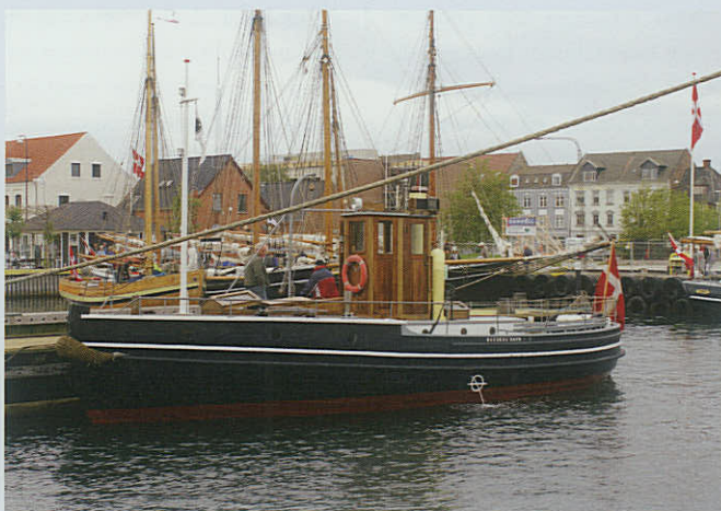
Idyllisk ser det ud med de mange gamle fartøjer i Fredericia Havn.

ESBJERG – Mange var mødt frem for at tjekke Esbjerg Marineforenings kanonsalut ved åbningen af »Esbjerg Festuge« den 8. august. – Selvom den umiddelbart ikke syner af meget, blev dette års salut det højeste knald nogensinde affyret i Esbjerg Marineforenings historie, skriver Erik Lassen Sørensen. Erik Lassen Sørensen er også af den formening, - at det halve Esbjerg den efterfølgende dag mødet frem til »Åbent Hus« med musik og tilbehør. Sjældent har vi haft så mange mennesker på så, efter forholdene, lidt plads.