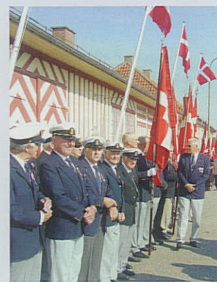
15 mand fra Svendborg Marineforening klar til at modtage Kronprinsparret på Honnørkajen i Svendborg.

Støtten til afdelingens nye Marinestue stiger jævnt. Der er registeret støttebidrag for over kr.