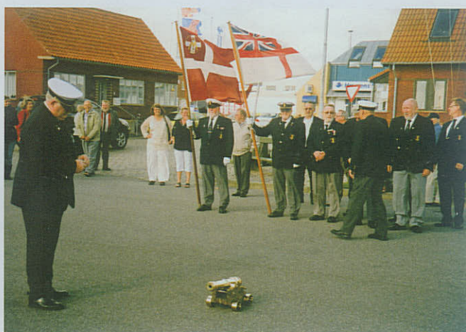
Esbjerg Marineforening afgiver salut ved åbningen af »Esbjerg Festuge«.