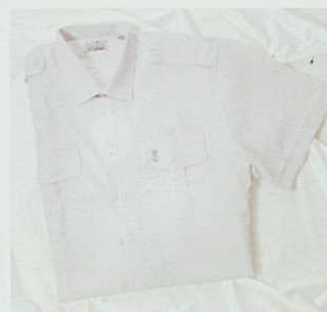
Skjorte med korte ærmer. Leveres i hvid og lyseblå. Str. 37/38-49/50