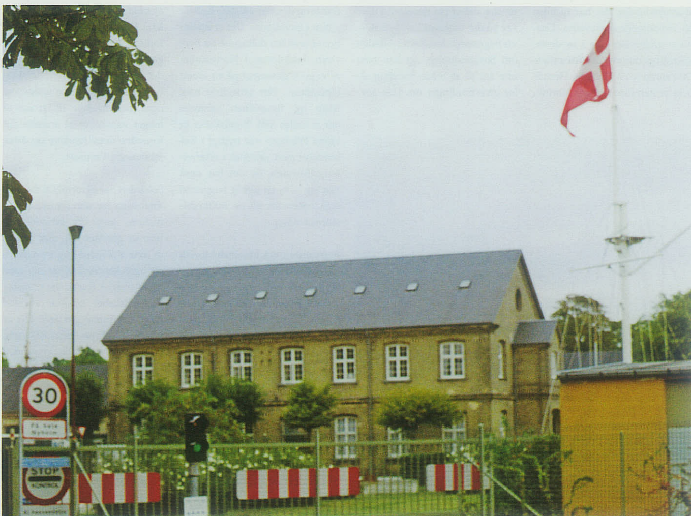
Marinens Bibliotek ved indkørslen til Nyholm. Selv om bygningen ligger på militært område, ert der offentlig adgang.

Orlogsmuseets Modelbyggerlaug er en selvstændig forening, men har fælles tidsskrift med Marinehistorisk Selskab/Orlogsmuseets Venner. Lauget blev oprettet i 1989 på initiativ af Orlogsmu-