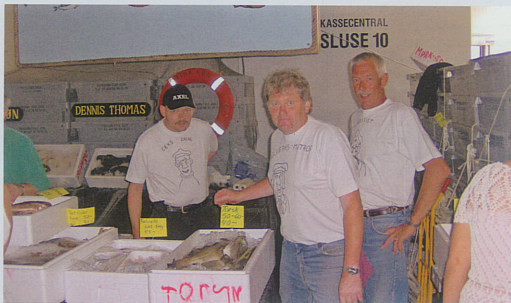
Så er der friske fisk fra Thyborøn Marineforening.

Bestyrelsens beslutning om, at det altid skal være lørdagsåbent i marinestuen, ser ud til at være en god idé. Mange medlemmer