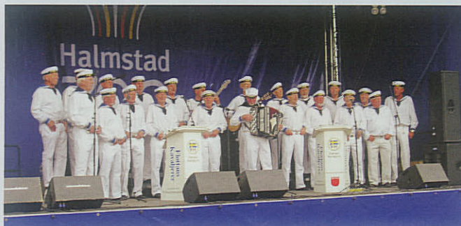
Det populære »Flottans Kavaljerer« optræder lørdag den 4. oktober på scenen i Lyngby Storcenter.