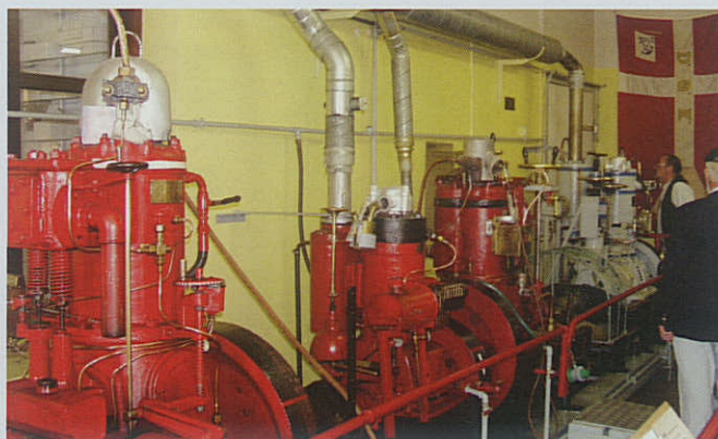
Rødvig Skibsmuseum blev en god oplevelse for medlemmerne fra Kalundborg Marineforening.

Udflugten til Stevnsfortet og Rødvig Skibsmotormuseum havde 40 deltagere. Her blev frokosten indtaget på Skipperkroen i Køge.