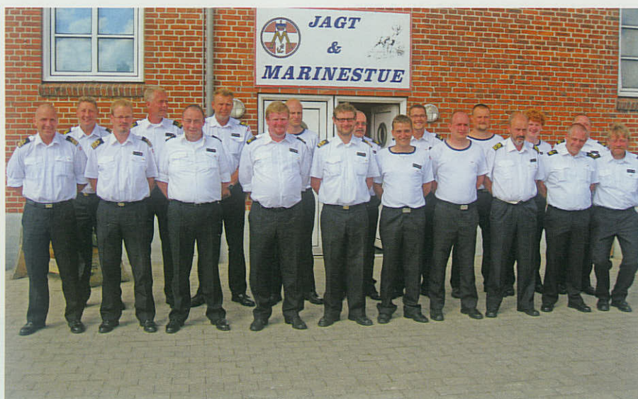
Besætningen fra KNUD RASMUSSEN foran Hanstholm Marineforenings Jagt & Marinestue.