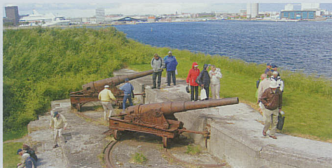
Old Boys and Girls fra Brøndby Marineforening tjekker kanonstillingerne på Trekroner.

Oktober byder på »åbent hus« i Marinestuen den 11.