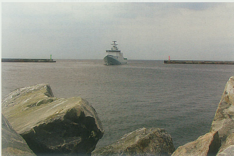
KNUD RASMUSSEN på vej til første besøg i Hanstholm Havn