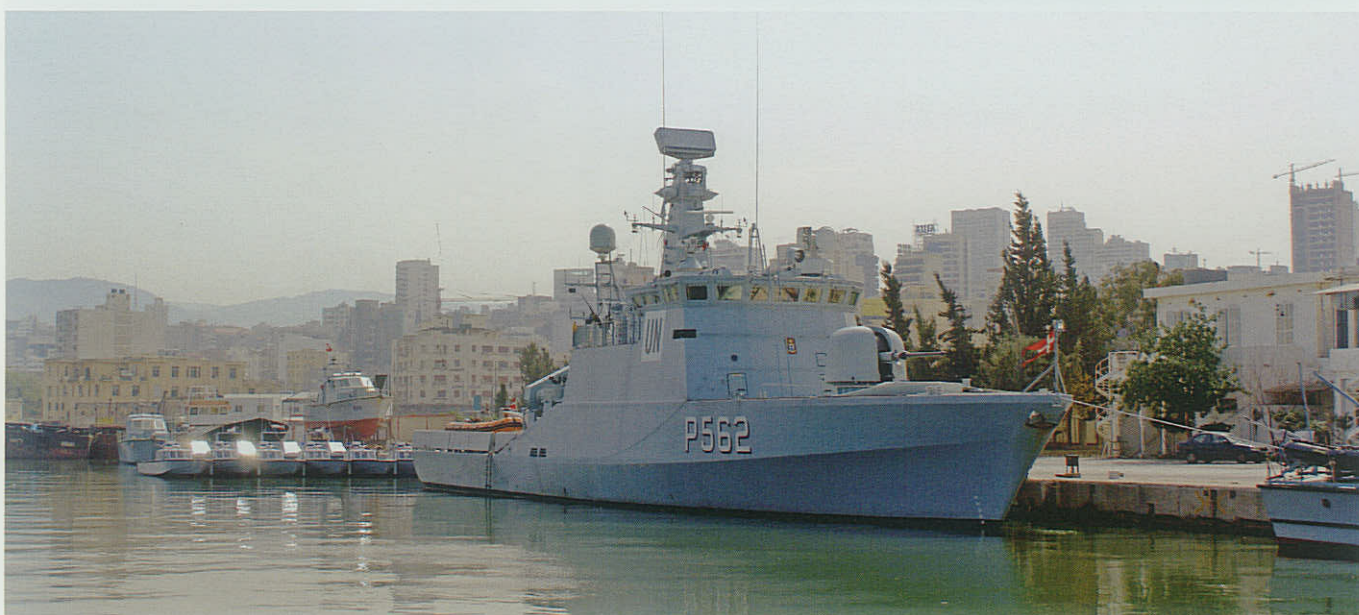
VIBEN ved kaj i Beirut under UNIFIL operationen.