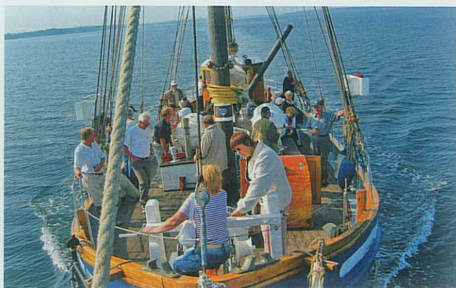
Brøndbyfolkene ombord på »Frem« i Østerløb ved Orø.