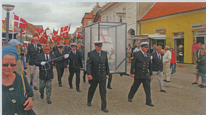
To marinespecialister fra MARIE MILJØ fører kirkeskibet »Justitia« frem til Sct. Hans Kirke i Stege.