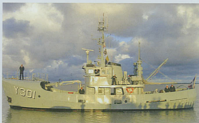
Orlogskutteren Y301 DREJØ forlader i solnedgang for sidste gang adoptionskommunen Fanø.

FANØ – Orlogskutteren Y301 DREJØ og besætning aflagde i weekenden den 11.-13. juli besøg på Fanø for sidste gang, beretter Per Hesdorf. Skibet udfases, og Fanø Kommune er ikke på nuværende klar over, om – og i givet