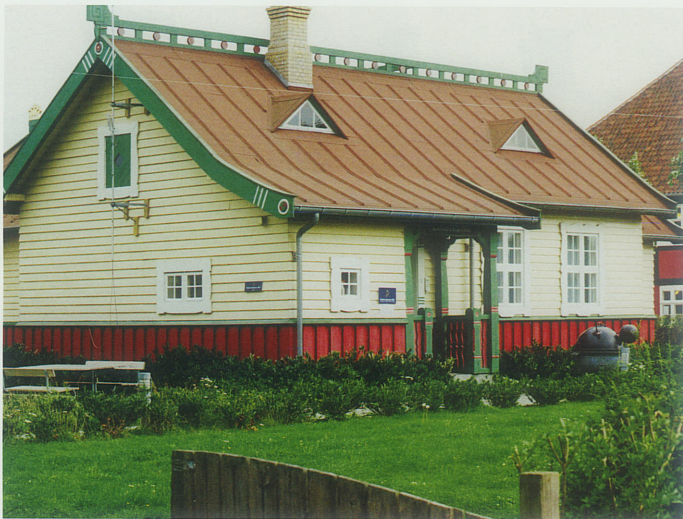
Radiohytten på Holmen er en aktiv radiostation med kaldesignalet OXA.

er allerede sat en del i værk i den anledning, og det er nok lidt for tidligt at løfte hele sløret for programmet, men jeg kan da afsløre, at marineforeningernes landsformand også har deltaget i forberedelserne i et stykke tid. På selvedagen vil flåden paradere for Hendes Majestæt Dronningen, og i dagene inden forventer søværnet, at flådens skibe vil sprede sig i provinshavnene. I den følgende weekend vil der komme et meget stort antal udenlandske orlogsskibe til København, og de vil herefter afgå til en fælles øvelse. Når det er sagt, så skal der jo