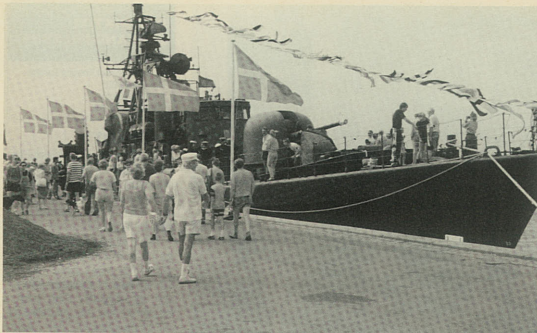
Besøget af »Willemoes« i Willemoes egen by Assens, vakte – som billedet viser – megen interesse blandt fynboerne.

Marinestuen på havnen vil også i det kommende efterår være åbne hver lørdag formiddag fra kl. 09.30 samt fra oktober også hver den første og tredje tirsdag aften fra kl. 19.00.