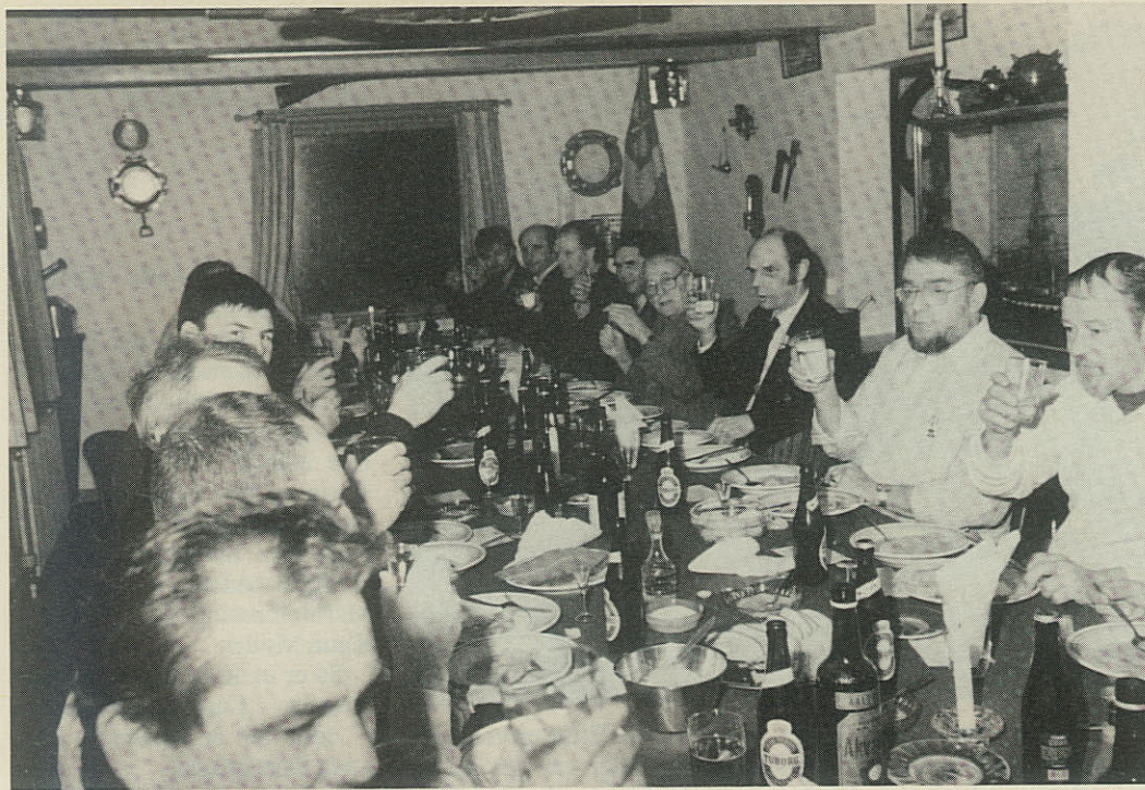
Det er nok af lutter benovelse over at skulle fotograferes til UNDER DANNEBROG, der får gutterne her til at se så alvorlige ud. For vi skal ellers hilse og sige, at de har det ualmindeligt muntert i Haslev Marineforening. Og mad og drikke i rigelige mængder, som billedet viser.