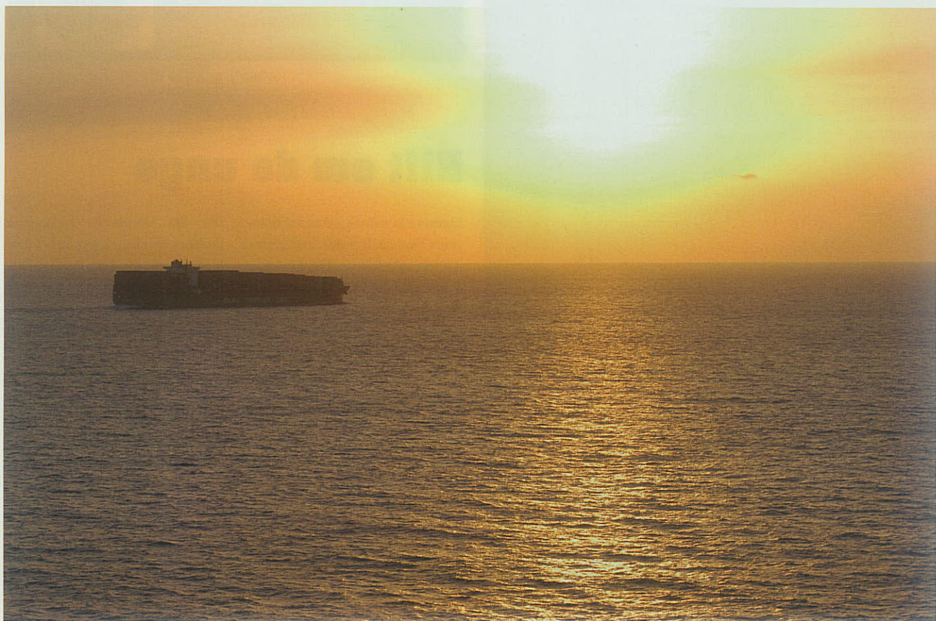
Et dansk handelsskib på vej.

“ Det giver en helt særlig fornemmelse at tænke på det på den måde, men det er et godt mål at have, og det er i hvert fald hammerfedt. Tænk, at kunne sejle verden største skibe – uden begrænsninger ”