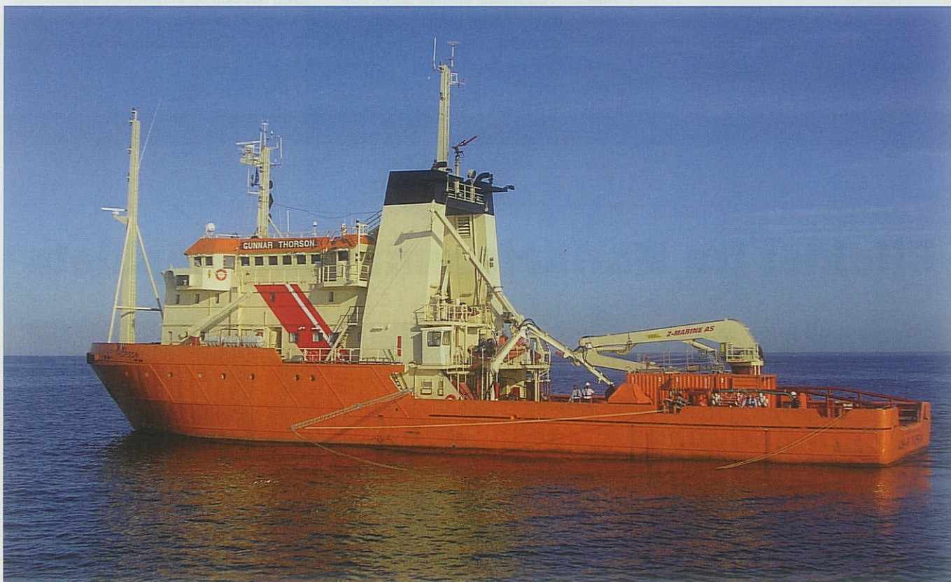
Miljøskibet GUNNAR THORSON i magsvejr

En meget flot gestus. Sådanne oplevelser gør det lidt lettere at være stolte!