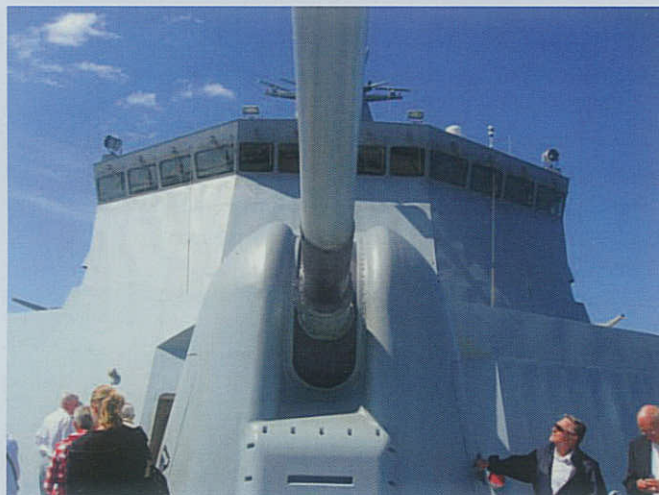
L17 ESBERN SNARE lagde slut maj dæk til besøg af medlemmer fra Kongens Lyngby og Ishøj Marineforening.