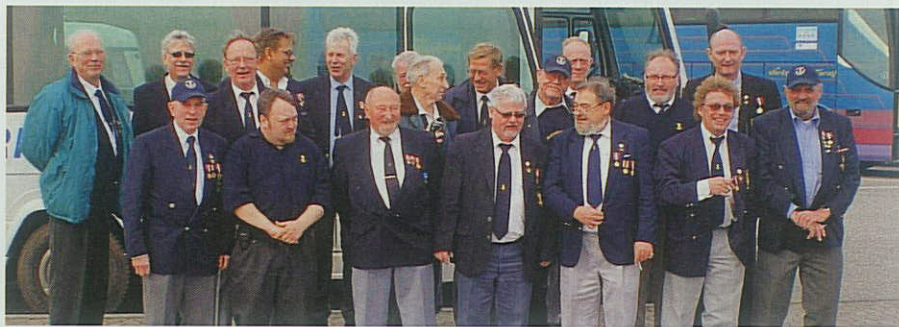
Brøndby Marineforenings Skyttelav klar til afgang til Landskyttestævne i Svendborg.