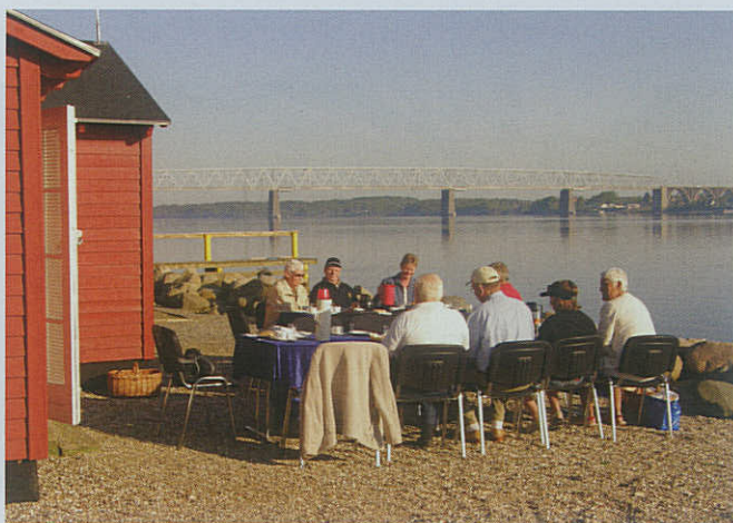
Pinsemorgenstemning foran Marinestuen i Middelfart.

5. maj deltog afdelingen sammen med Sømandsforeningen og Marinehjemmeværnet i flaghejsning og kranselægning ved mindestenen på midtermolen for omkomne søfolk.