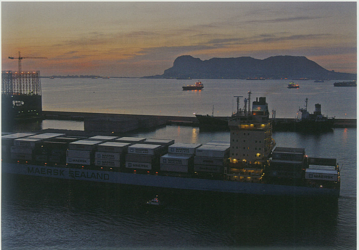
En Mærsk enhed på vej ud af havnen med Gibraltar klippen om styrbord.