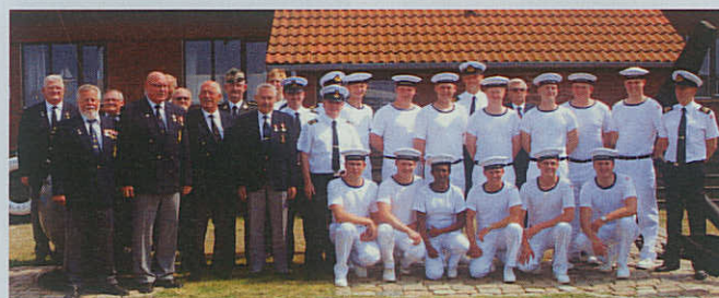
Repræsentanter fra besætningen på Kongeskibet DANNEBROG sammen med medlemmer af Esbjerg Marineforening.