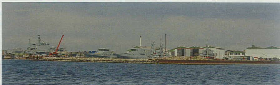
De militære enheder fylder godt op og giver mange arbejdspladser på Faaborg Værft.

vedstående artikel) kommer Faaborgs gamle adoptionsskib HAJEN efterfulgt af LOMMEN ind til opgradering og udrustning, inden de overdrages til Litauerne.