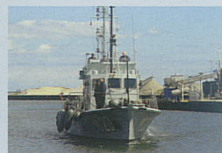
Svenske M20 på vej til kaj i Køge Havn.