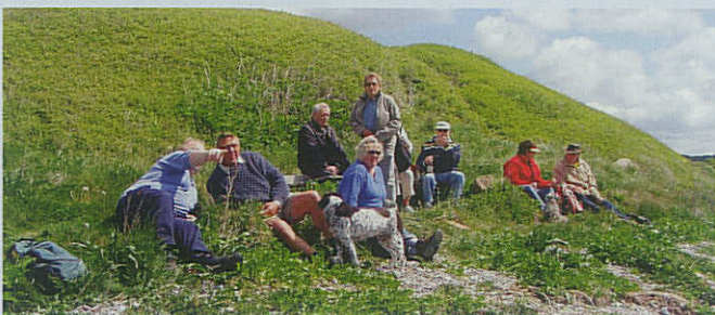
Velfortjent rast på Asnæs for deltagerne i Kalundborg Marineforenings travetur.