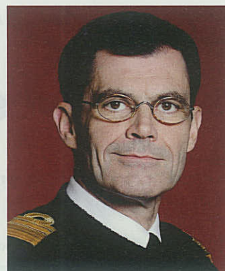
Admiral Tim Sloth Jørgensen. Danmarks forsvarschef fra 1. august 2008

Det er vi ikke. Forsvaret løser vidt forskellige opgaver – fra kampopgaver i Afghanistan til søredning i Nordatlanten – der fortsat nødvendiggør en stor operativ specialisering og professionalisme. Specialiseringen er dybt forankret i værnene og udover den ekspertise er der naturligvis også en tradition og en kultur som følger med. Når det så er sagt, må vi også erkende, at vi i dag er en organisation med kun ca. 23.000 fastansatte. Det vil sige, at vi er mindre end f.eks. de store kommuner. Det betyder, at der er flere og flere ting, som vi skal være fælles om – også organisato-