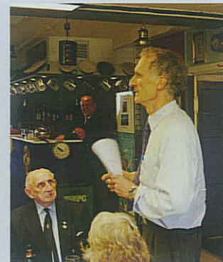
Undervisningsminister Bertel Haarder på besøg i København Marineforenings stue.