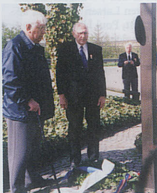
Randers Marineforening nedlægger krans ved mindekorset i Romalt.