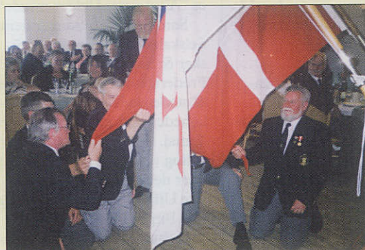
Ny skik i Esbjerg - aflæggelse af faneed.

Der er i øvrigt masser af tilbud til medlemmerne i den kommende tid. August byder på Esbjerg Festuge med underholdning og musik på kajen, samt bustur til Flensborg med sejltur til Glücksburg. I september får afdelingen besøg af United Navy Ceremonial Guards der opfører tæto på pladsen foran Marinestuen. Oktober har ulkeaften med klipfisk samt filmaften på programmet.