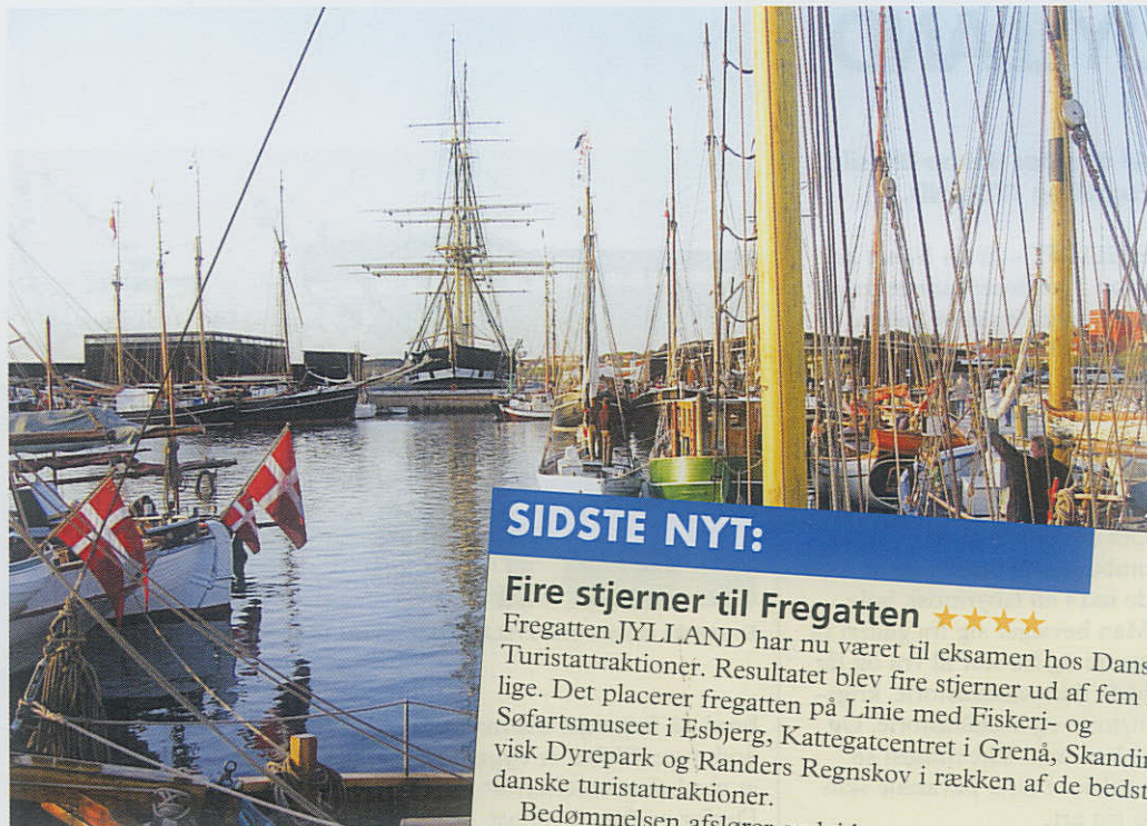
Stemmingsbillede fra Ebeltoft nye skudehavn med Fregatten JYLLAND som et naturligt centrum.

Allerede nu kan man holde receptioner, konferencer og bryllupper om bord med op til 400 spisende gæster på banjerdækket eller 220 i den nye café. Og Fregatten har åbent 360 dage om året, så der er ingen undskyldninger for ikke at lægge kursen forbi Fregatten i Ebeltoft.