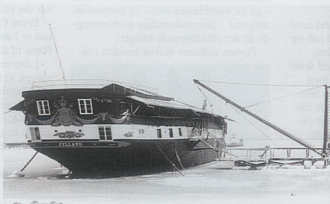
Fregatten JYLLAND, vinteren 1960.

Kun fantasien og teknikken sætter grænser for, hvordan vi vil formidle historien om fregatten og alle sidehistorierne.