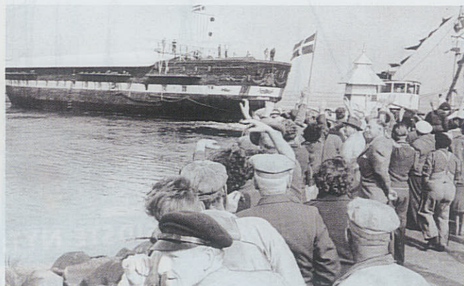
En stærkt ramponeret JYLLAND ankommer til Ebeltoft.

Selv om man er blandt de knap 2 millioner mennesker, der har besøgt skibet siden 1994, kan man roligt tage af sted igen, for der venter en helt ny verden med andre og meget større oplevelser. Den nye verden er Fregatten JYLLANDS helt egen. Den nye udstillingshal på 2.200 kvadratmeter svarer til et middelstort dansk museum, og her får man en mængde informationer om fregatten. – Og om