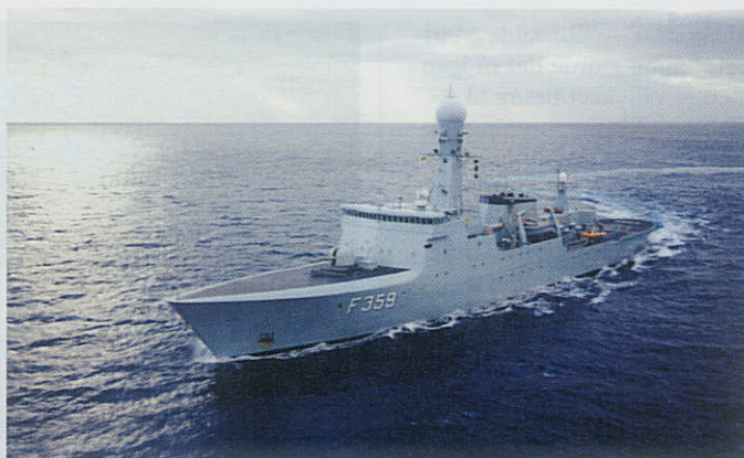
VÆDDEREN skal måske deltage i den tredje Galathea-ekspedition.

I 1993 promoverede VÆDDEREN dansk skibsbygning og -udrustning ved en interna-