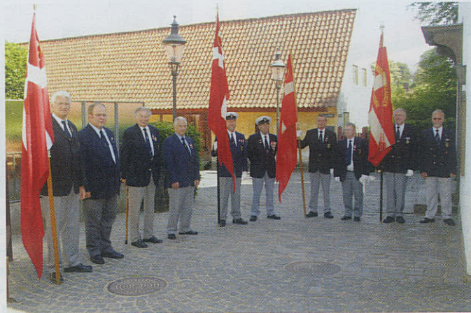
Sammen med medlemmer fra Våbenbrødreforeningen i Århus, stod repræsentanter for Marineforeningens lokalafdelinger i Ebeltoft, Grenå og Korsør flagvagt ved indvielsen af Dansk Center for Byhistories monumentdatabase i Den Gamle By.

Databasen er frit tilgængelig for alle på www.byhistorie.dk/monumenter . Den er delt i to dele. Den ene er en registrant der viser mange oplysninger om og billeder af monumenter fra de danske købstæder fra Krigen i 1864, 1. verdenskrig 1914-18 og Genforeningen i 1920. Den anden består af artikler om mange forskellige aspekter af monumenter. Herunder indgår også resultaterne af den undersøgelse om minebøsser