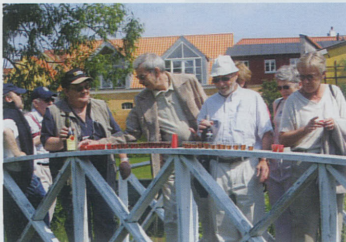
Deltagerne fra Brøndby hygger sig under byvandringen i Køge.