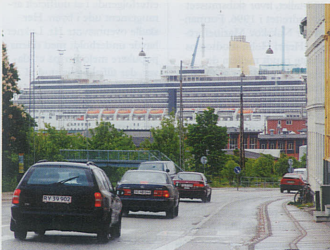
81.769 BT fylder godt op i det århusianske havne- og bybillede.

De 21 anløb er fordelt på seks skibe. Heraf er der tre nybygninger. Ud over "Arcadia" fra P&O Cruises på 81.769 BT, er det fra samme rederi "Artemis" på 44.588 BT og