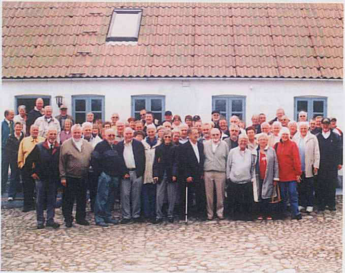
En flok glade Aalborgfolk på skovtur til Djursland.