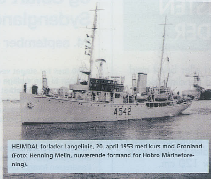
HEJMDAL forlader Langelinie, 20. april 1953 med kurs mod Grønland.

Dagen efter nåede vi Holsteinsborg. Vi stoppede op uden for Ulkebugten, ved Møllers Ø og frigjorde LCM'eren. Derefter