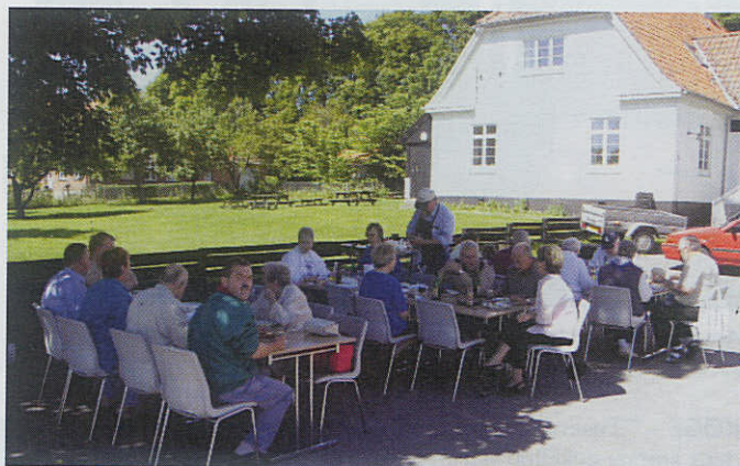
Frederikssunderne nyder gastronomisk grillmad i skyggefulde omgivelser.

På grund af Fregatskydningen i august havde bestyrelsen valgt at flytte arrangementet til juni. På baggrund af fremmødet i år afholdes grillfesten fremover i denne måned.