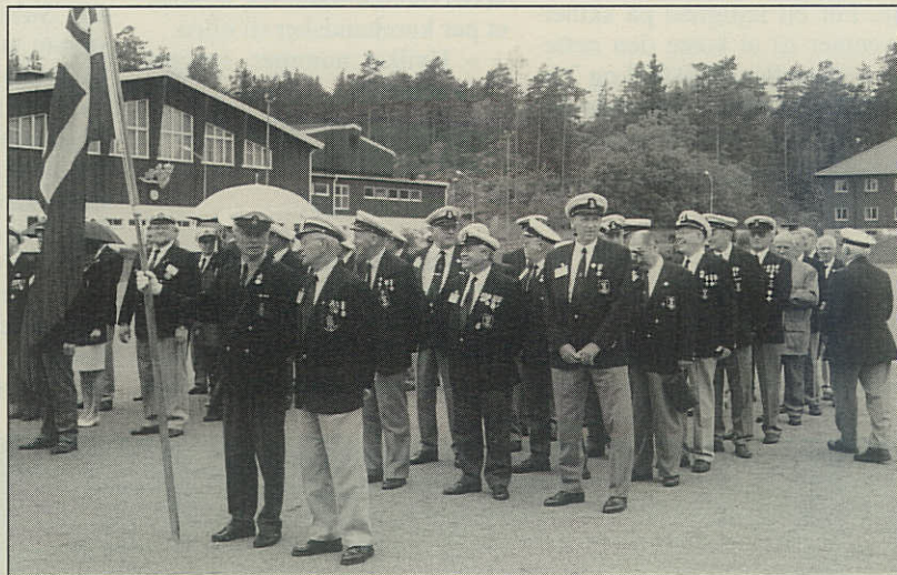
Det danske hold ved paraden på sportspladsen