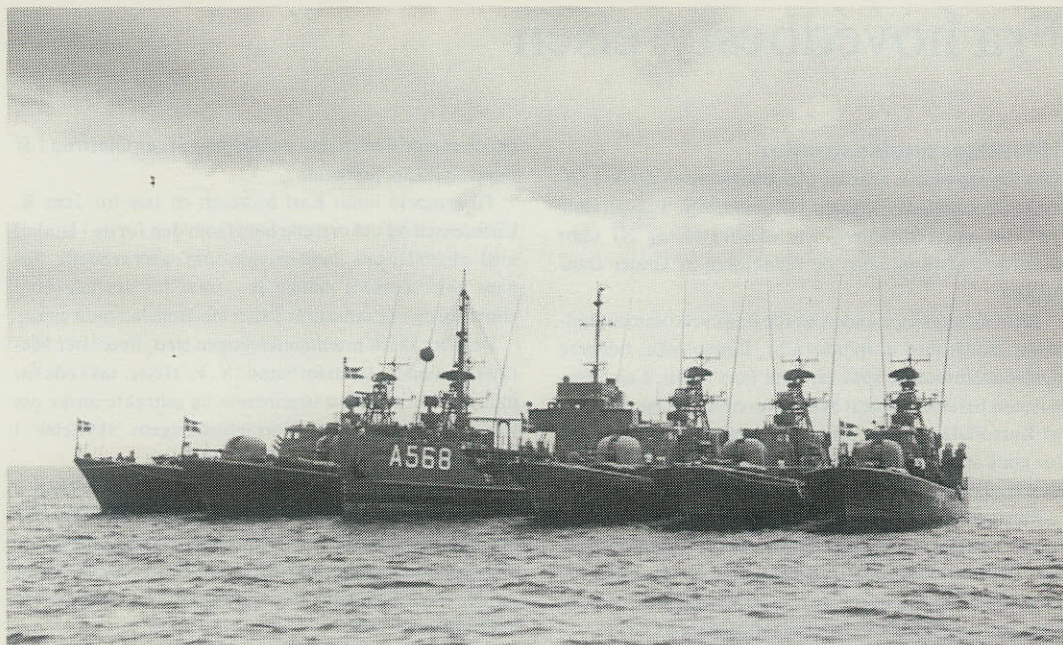
Torpedobådseskadren et sted i Kattegat.

Vejrforholdene tillod desværre ikke torpedoskydning den dag, da der kræves en vis sigtbarhed for at kunne genfinde de afskudte torpedoer. Naturligvis blev der heller ikke fyret med missiler, da hvert skud, uanset om det er solskin eller tåge, koster 3,3 millioner kroner.