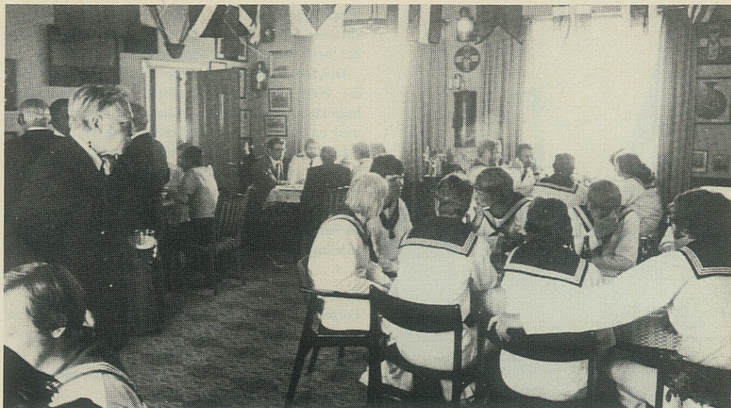
Gæster i marinestuen i Nykøbing Mors.

rieskydningen var der pokal til den bedste mand og den bedste dame. – Et vellykket arrangement, som vil blive tradition.