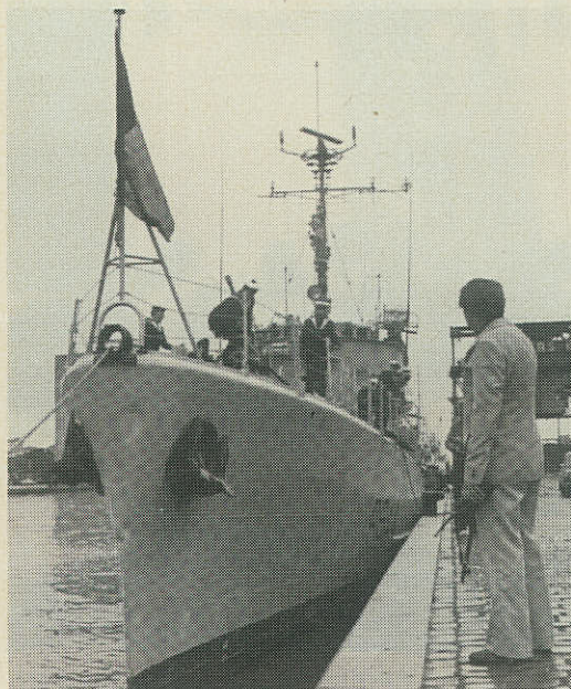
Fregatten »L'Adroit« ankommer til Randers.

bruar kombineres med fælles spising, og 60 års stiftelsesdagen den 8. marts skal fejres med en reception i marinestuen på Hotel Randers.