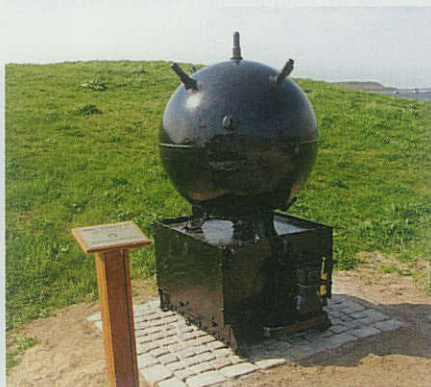
Hornminen fra 1. Verdenskrig er nu genplaceret ved havnefronten i Frederikssund.

Dagen igennem var der åbent hus på MHV 905 ASKØ. En velbesøgt middagsreception samt festmiddag om aftenen dannede festrammerne for et godt og velbesøgt jubilæumsprogram.