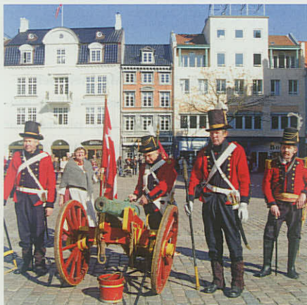
Faaborg Kanonér Laug klar til at afgive Dansk Løsen.