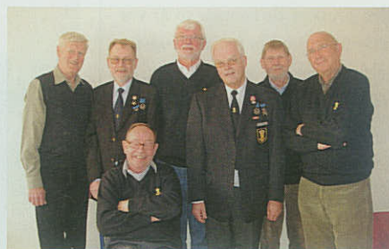
Det syv mand store skyttehold fra Kongens Lyngby klar til Landskyttestævne.

Skydningen på Stadion holder sommerferie fra den 2. juni med genopstart den mandag den 1. september.