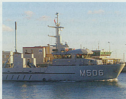
MSD6 SALTHOLM på vej ud af Skagen Havn under de afsluttende prøvesejladser i november 2007.

Det er fjerde gang et dansk orlogsfartøj bærer navnet SALTHOLM. Første enhed var en hugert der indgik i flådens tal den 7. november 1761. Næste enhed var en kanonchalup fra 1806. Tredje var et inspektionsskib, der gjorde tjeneste ved Færøerne i perioden 1916-1919.