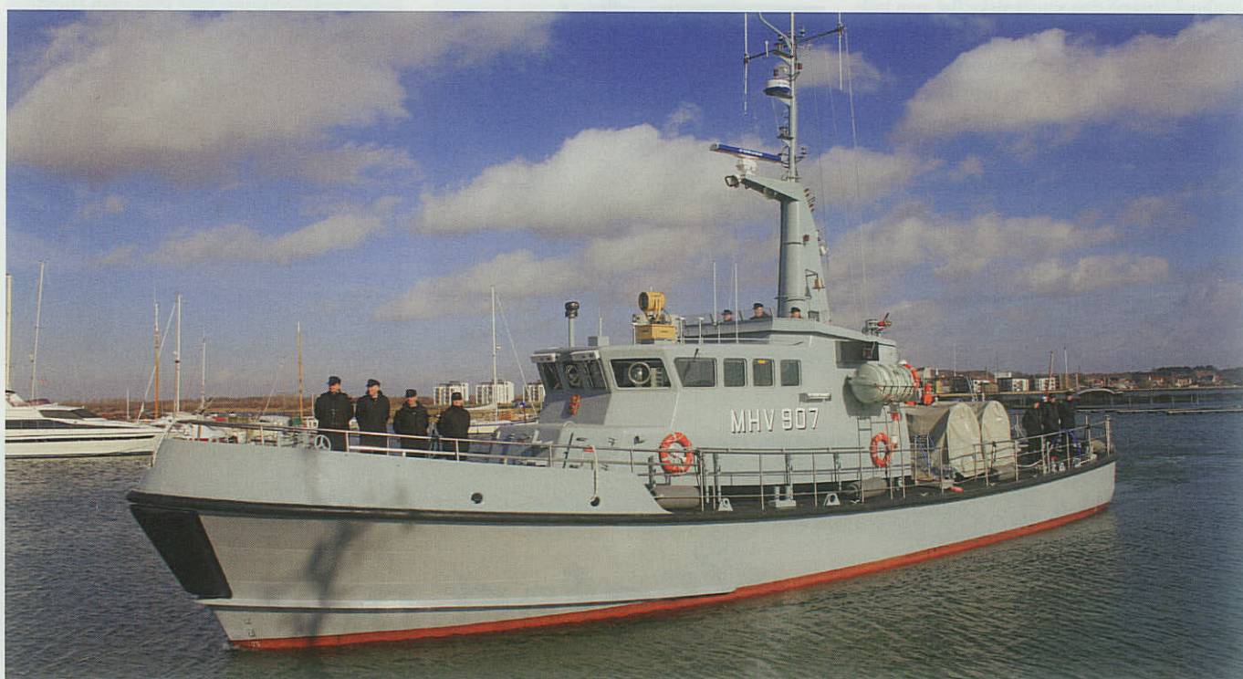
MHV 907 HVIDSTEN på vej ind i Aalborg Skudehavn.

Dagens sidste officielle taler var flotillechefen, premierløjtnant Jørn Holst, der på vegne af hele sit mandskab takkede for det store fremmøde og den udviste interesse.