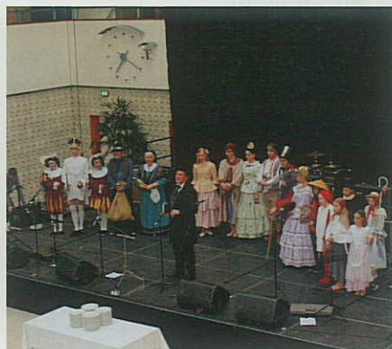
H. C. Andersen og 24 eventyrbørn underholder.