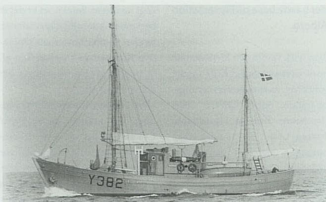
Y382 SKARVEN. En markant spiller i beretningen om inspektionskutterne ved Grønland.