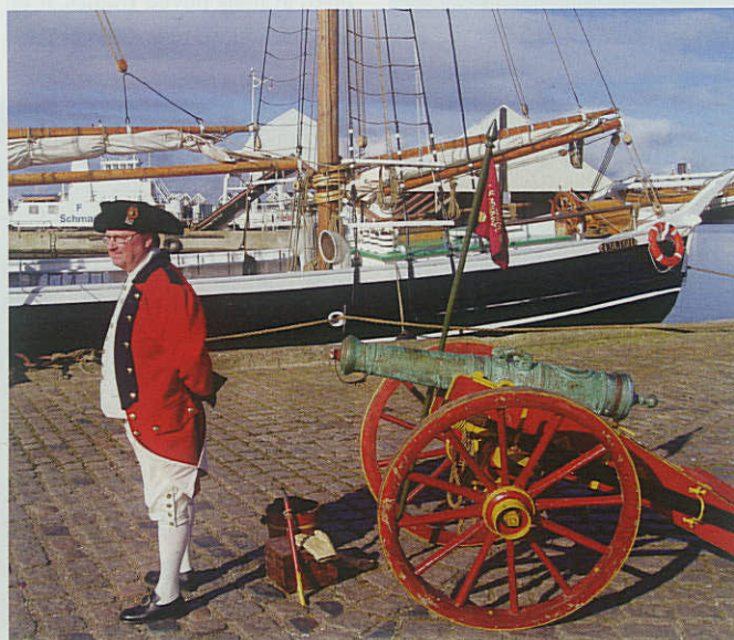
Faaborg Kanonerlaug klar til afskydning af Dansk Løsen.

derevner gør, at manges opmærksomhed rettes mod ham. Selv admiral Nelson har lagt mærke til