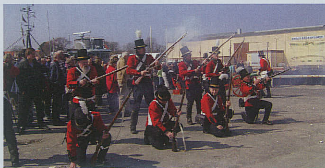
Medlemmer af Marstal Marineforening agerer kampklare englændere under 1808 eventen på havnen i Marstal.

onsskib, Søopmålingsfartøjet BIRKHOLM besøg i byen. Den var ledsaget af søsterskibet FYRHOLM. Besætningerne var på besøg i Marinehuset, hvor der blev serveret en god skipperlabskovs og selvfølgelig en Riga dram. Vi havde nogle fornøjelige timer sammen.