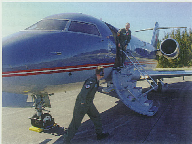
Flyvevåbnets Challengerfly klargøres til operation Super CEPCO.

Næste Super CEPCO er planlagt til at finde sted i 2009 med Holland som vært.