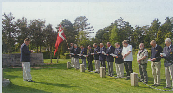
Fanø Marineforening markerer 5. maj med kranselægning ved mindestenen på Vestre Kirkegård.