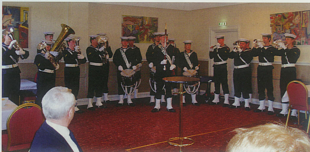
Søværnets Tamburkorps underholder på Marcussens Hotel.

I dagens anledning havde både det navnkundige Fulton og orlogskutteren SAMSØ lagt til kaj. Dagen indledtes med sang og musik, leveret af henholdsvis Shantykoret og Brasseneserne. Disse tiltag var med til at mane den rette maritime stemning frem. Shantykoret lagde ud med at synge