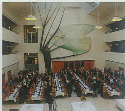
Klar til gallafest.