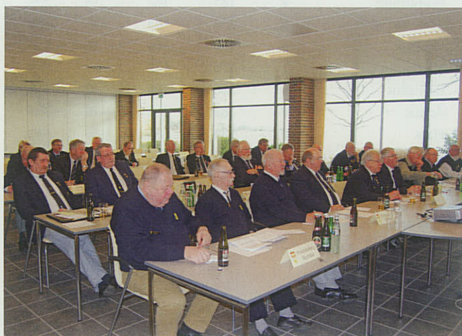
Opmærksomme deltagere ved skyttegeneralforsamlingen i Svendborg.