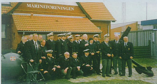
De 18 mand fra franske FALMANT samt repræsentanter fra værterne klar til fotosnapshot foran Esbjerg Marineforenings hus.