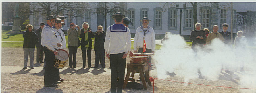
Dansk Løsen før afgang fra Kongens Have.