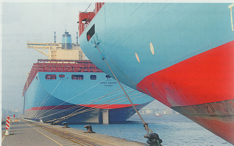
»Emma Mærsk« er en af de enheder, der fylder godt op i blandt andet Århus Havn.

havne. På en andenplads kommer Norge med en samlet tonnage, der udgør ca. 50 pct. af den danske. Århus Havn har ikke opgjort, hvor stor en del af den samlede tonnage, der kommer fra danske hhv. udenlandske skibe.