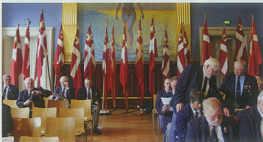
20 flag gjorde sig godt i salen under Sendemandsmødet.