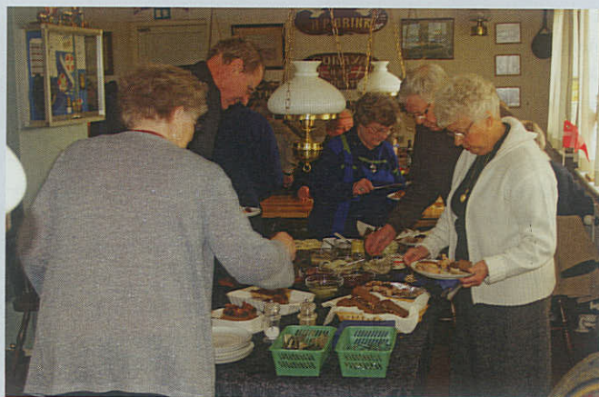
Medlemmernes og ægtefællernes indsats som frokostleverandør til billige penge i Marinestuen, er blevet en succes i Hundested Marineforening.

HUNDESTED – For ca. 2 ½ år siden nedsatte bestyrelsen i Hundested Marineforening et aktivitets-udvalg. Det resulterede i et