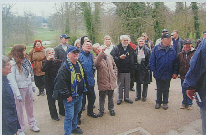
Gruppen fra Brøndby Marineforening på studietur i Frederiksberg Have.