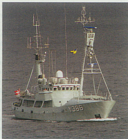
Y386 AGDLEK under Søværnets Kommando i 2006.

for kr. 2.725.000,-. BARSØ-klasse orlogskutteren Y306 FARØ indbragte kr. 710.000,- fra selskabet RI 345 Inger Lene, Hvide Sande. MHV 90-klasse kutteren MHV 91 BRIGADEN kostede Sylvest Trading, Faaborg 420.000,- medens samme classes MHV 93 HVIDSTEN blev solgt til Water Technique, Hundvaag, Norge for kr. 490.000,-.