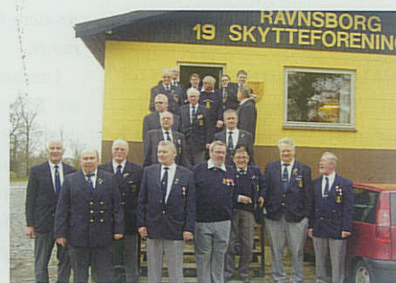
Skytterne fra Nakskov Marineforenings Skyttelavs Fregatskydning forevigtet før den spændende dyst.