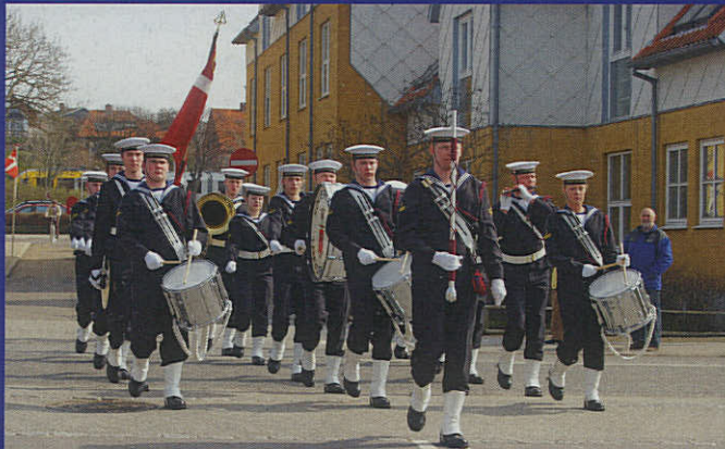
De formiddagsstille gader i Hundested fik musisk underholdning af første klasse, da Søværnets Tamburkorps gæstede byen.