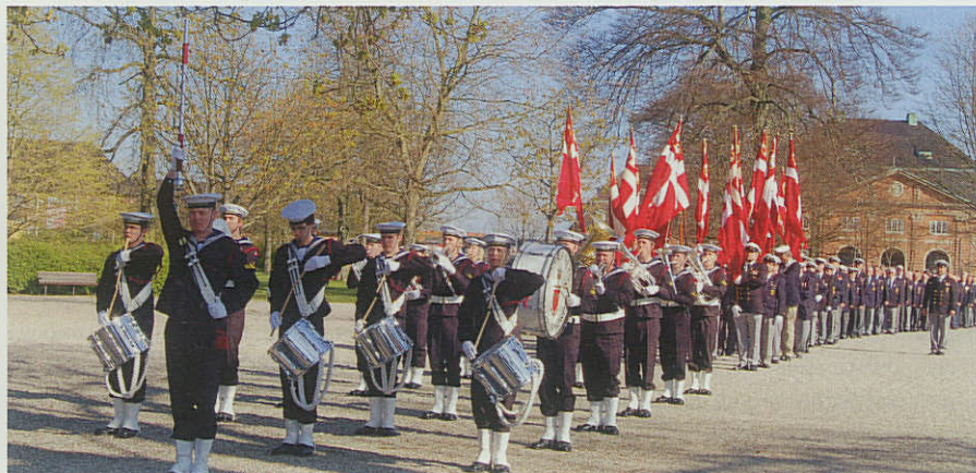
Søværnets Tambur Korps og Sendemændene klar til afgang fra Kongens Have.

eningen, og melder sig ind. Her er nøgleordet igen synlighed i lokalsamfundet, lød det fra Landsformanden.