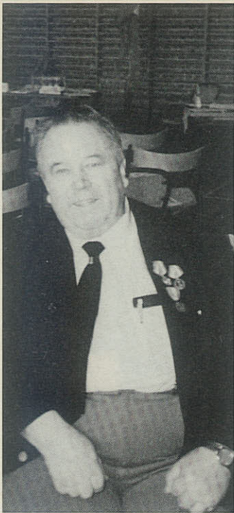
»Bas Hans« – Skælskørs humørbombe.