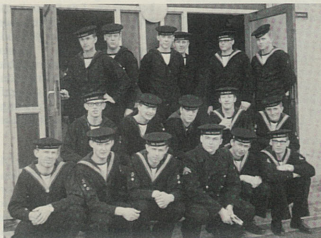
5. kompagni fra Februarskolen i Auderød 1966 opfordres til at mødes til 25 års jubilæet i år.

Jeg kunne godt tænke mig at mødes med gamle gaster ved jubilæet på Holmen den 25. august. Jeg bringer her et billede, der viser første deling fra 5. kompani efter endt rekruttskole – februarskolen – i Auderød i 1966. Jeg kan oplyse, at jeg selv står øverst til venstre.