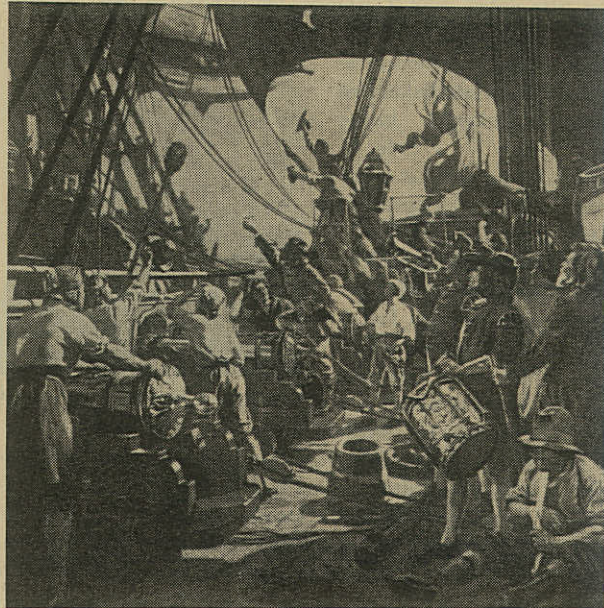
Mølsteds kendte maleri »Paa Kanoner og Pokaler« hvor Tordenskiold skaaler med den svenske skibschef

Tordenskiolds mærkelige inspirerende magt over sine omgivelser skyldes sikkert medfødte evner. Han havde de samme evner over for dyr. Han elskede at være omgivet af store rovdyr, som han let tæmmede ved sin personligheds magt.