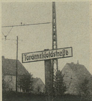
Hjørnet af Hildesheimerstrasse og —

Fra Autobahn Hamburg-Hannover-Hildesheim er der syd for Hannover Ost udkørsel mod vest til Rethen og videre til Gleidingen, og fra hurtigvejen — »Messevejen« — Hannover-Hildesheim (Nr. 6) er der udkørsel ad (Nr. 443) til Rethen-Gleidingen.