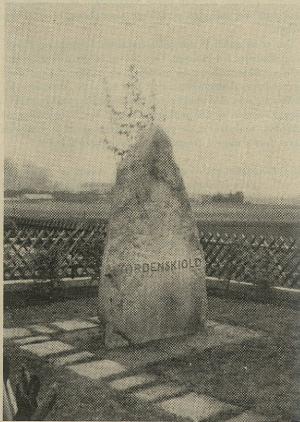
Mindestenen paa Tordenskiolds dødsted i Sehlwiese ved Gleidingen