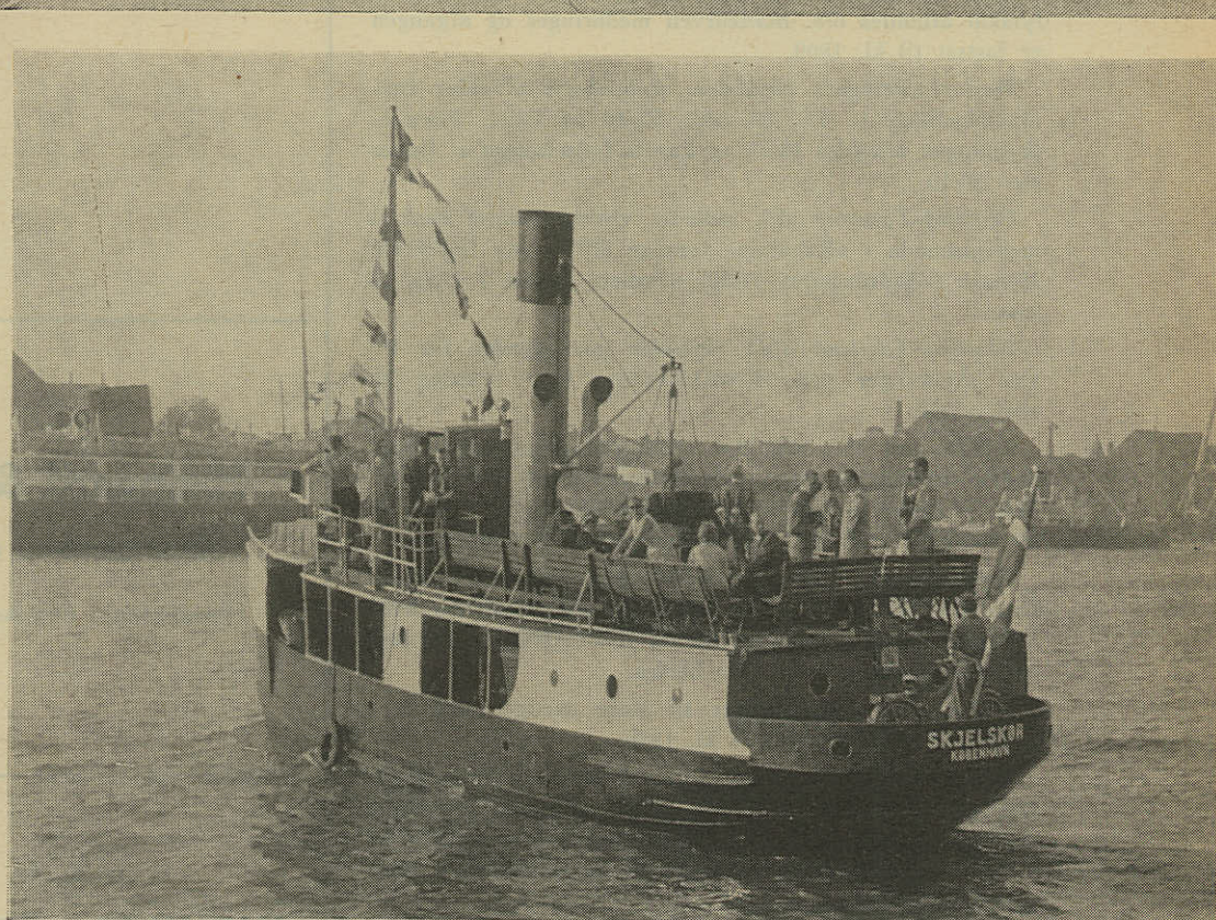
»Veteranskibet« S/S SKJELSKØR Danmarks ældste, stadig sejlene skruedampskib