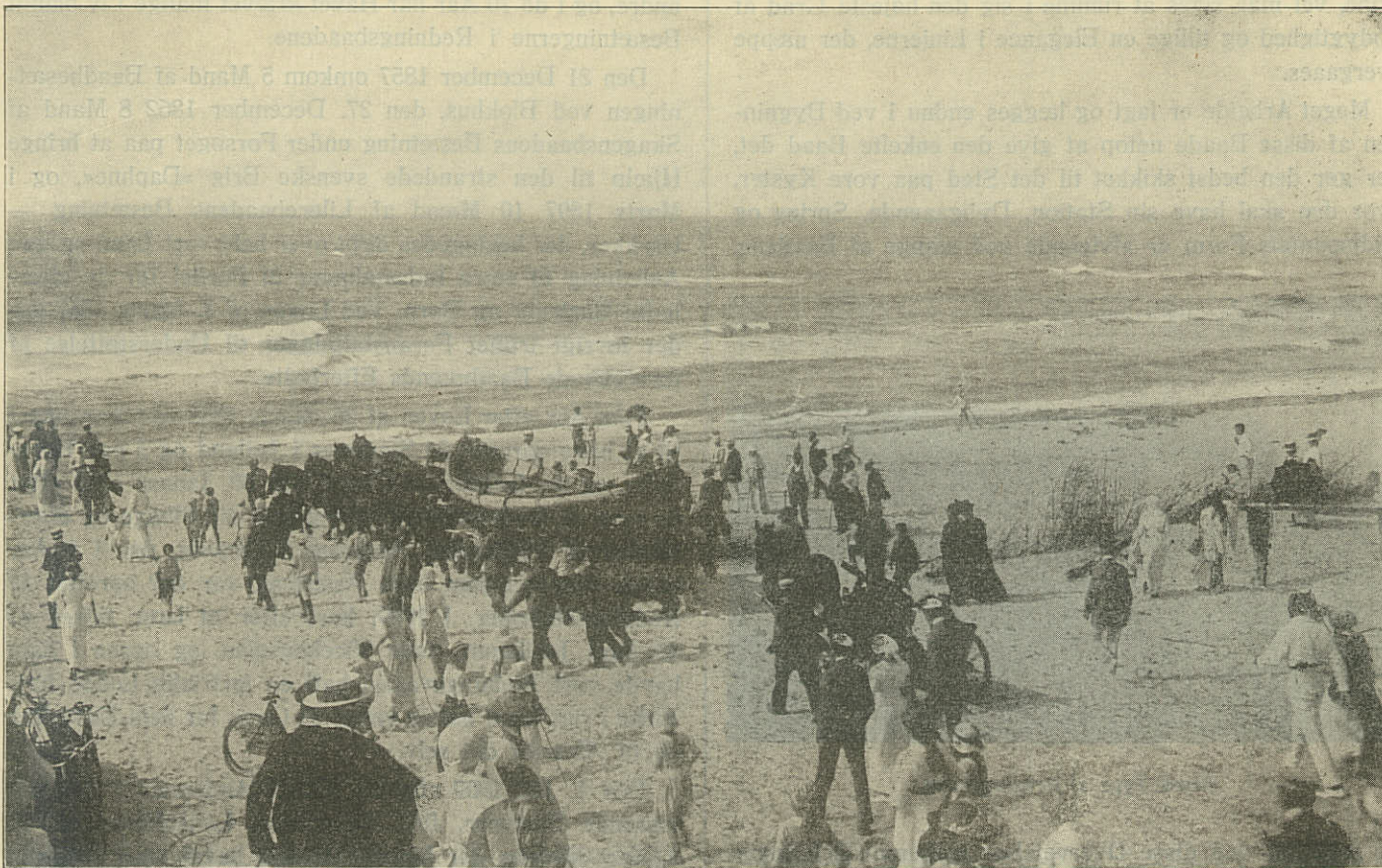
Redningsbaaden køres ud.