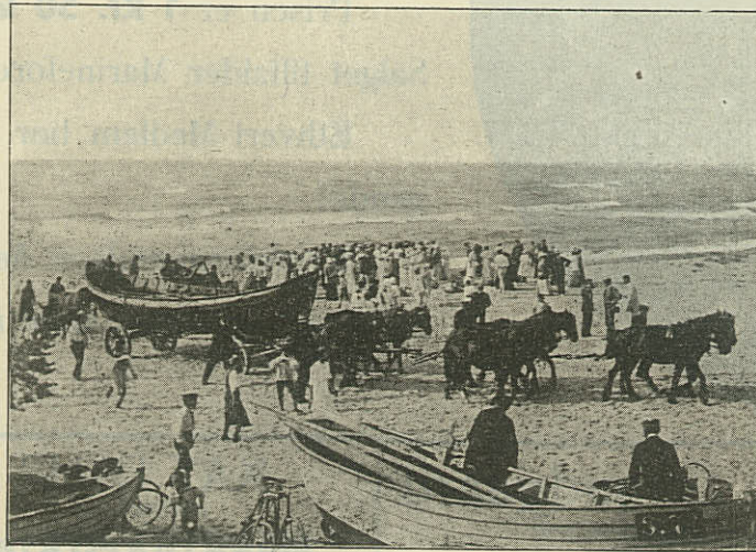
Efter endt Øvelse.