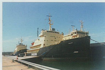
▲ OPLOG Frederikshavn forventer snarest at holde afskedsreception for én eller flere af de udfasede isbrydere.

med egen side. - Her kan man følge lidt med i de begivenheder - store som små, der udspiller sig på flådestationen.