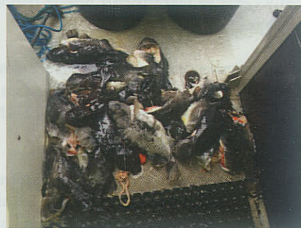
▲ Der er ikke meget rogn tilbage til kaviarproduktionen, når først sælerne har taget deres del.

Stenbidder hannernes kød er mere fast og god som spisebisk. Brystfilerne er en lækkerbisk såvel stegt som røget. ■