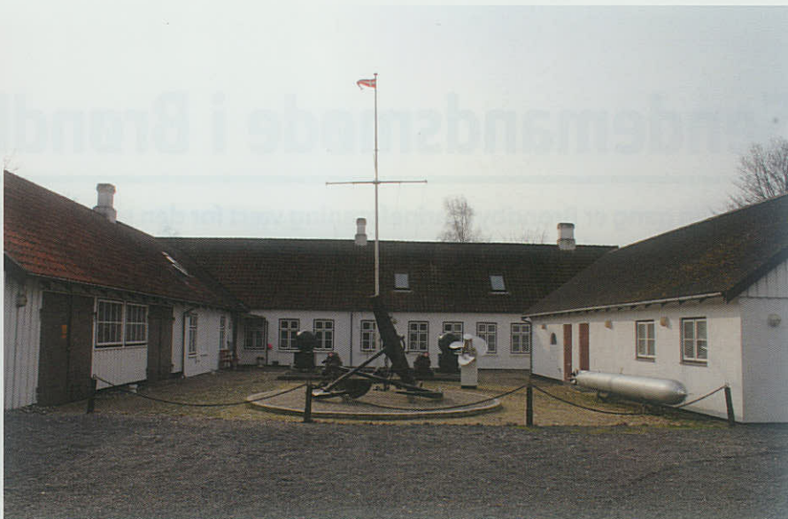
▲ Marinegården i Brøndby er under Sendemandsmødet 2015 faglig kommandostation samt social omdrejningspunkt.