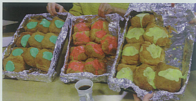
▲ Fastelavnsskydningen i Brøndby Marineforenings Skyttelav bød på kagegastronomi af høj klasse.

Kørelærer Gert Allan Larsen Maglemosevej 33, Marbjerg • 2640 Hedehusene Tlf.: 20 43 87 96 • E-mail: gert-allan@larsen.dk Amager, Brøndby, Frederiksberg, Gentofte, Ishøj, Kongens Lyngby, København, Roskilde