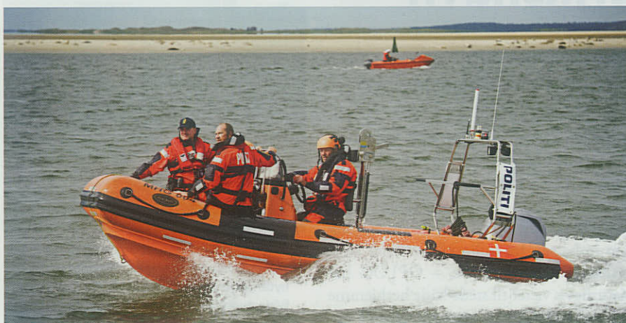
▲ Marinehjemmeværnets opgaver med politiet er øget fra 18 sejldage i 2011 til 152 sejldage i 2014.