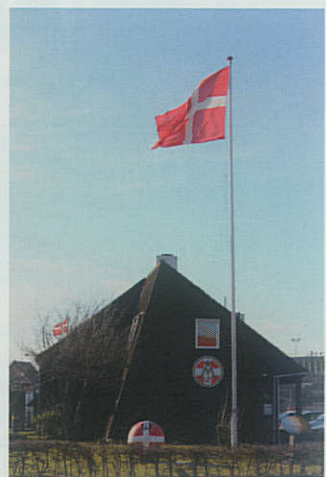
► Efter træfældningen kommer Bornholms Marineforenings marinehus, flagstang, minebøsse og skibsskrue nu til sin fulde ret på havnen i Rønne.