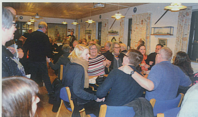
▲ Der synges og rokkes igennem under nytårsfrokosten i Køge Marineforening.

Efterfølgende var der knejpehygge og sømandsviser med stor hjælp af husorkesteret Kuling fra