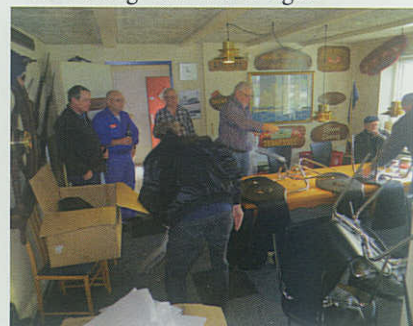
▲ Bestyrelsen og tilkaldte medlemmer fra Lemvig Marineforening samlede i januar over 70 nye stole doneret af Tuborg Fonden.