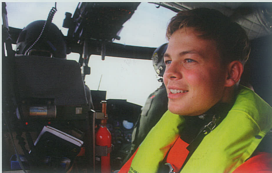
▲ En af de store oplevelser for kommentarskribenten var helikopterflyvningen under skibstræningen.

Nu står jeg så på den anden side af de 4