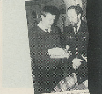
Her skabte de bane på Haderslev og omegn. De gamle marinere vil frem i lyset.