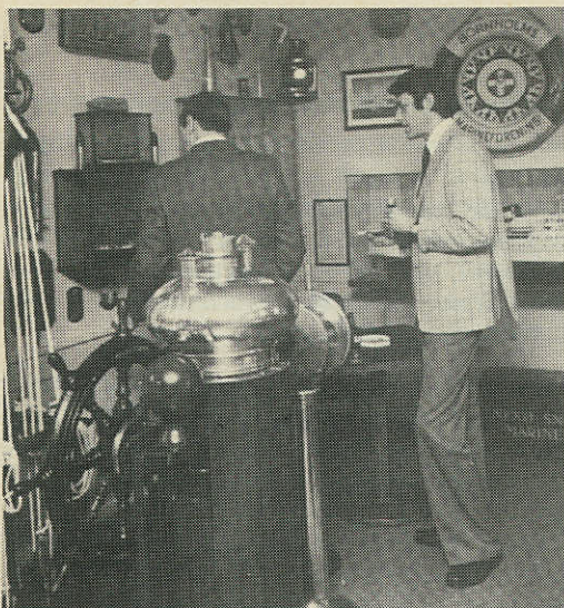
Et kikk ind i den nye marinestue i Rønne.