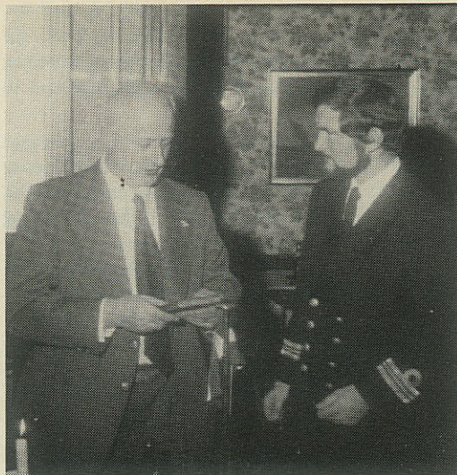
Der udveksles gaver i marinestuen i Hadsund.