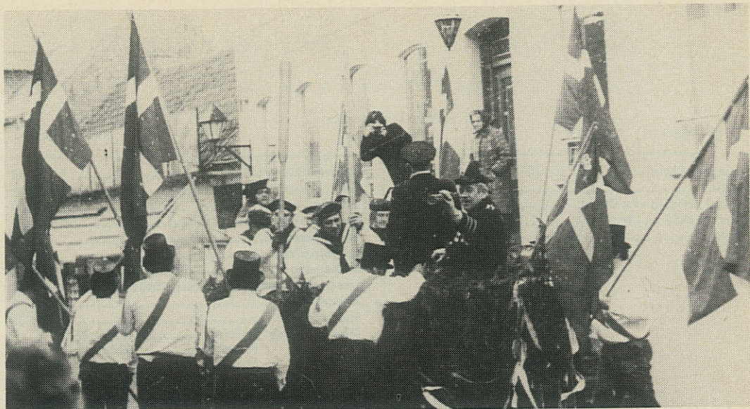
Endnu en gang sejlede »sluppen« gennem Ebeltofts gader.