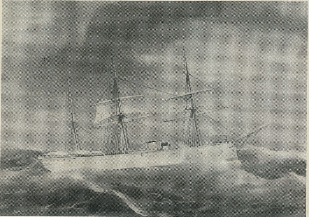
På Marineforeningens hovedkontor hænger denne farvelagte tegning af krydsfregatten »Fyen«, som den antagelig præsenterede sig på togtet i 1885. Billedet er signeret 1899 D-krimskrams-?