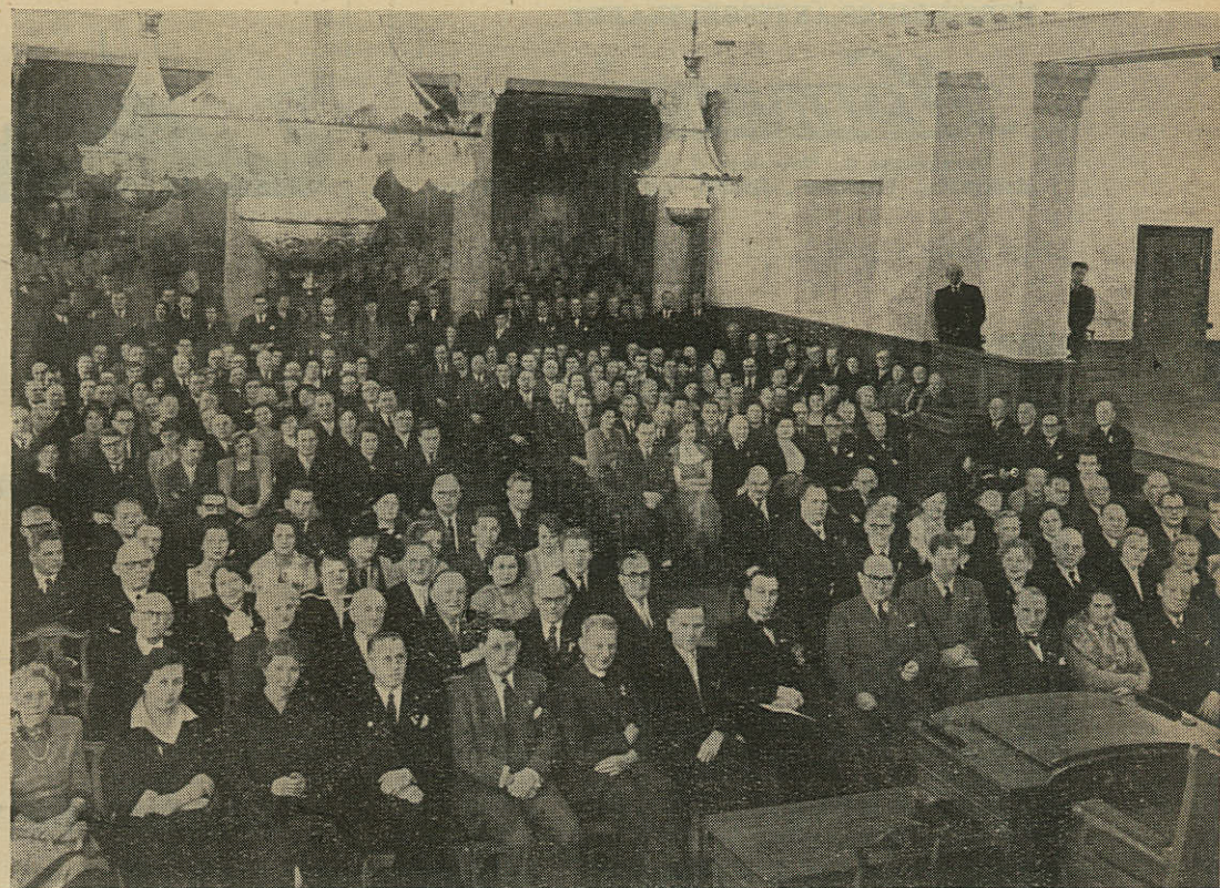
FRA DET SVENSK-DANSKE MARINEFORENINGSSTÆVNE I KØBENHAVN 27.—28. JANUAR 1951.