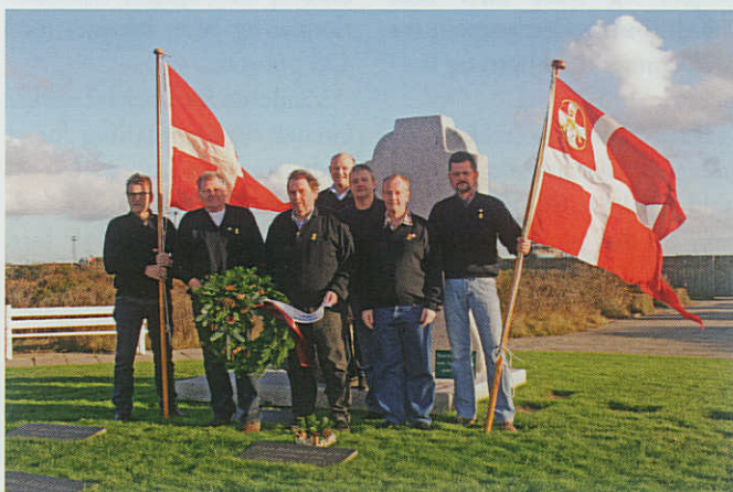
▲ En samlet bestyrelse fra Thyborøn Marineforening lagde den 6. december krans ved mindestenen på Thyborøn Kirkegård.