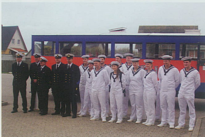
▲ Kongeskibet DANNEBROG's vagtfri besætning blev under opholdet i Thyborøn den 1. september serviceret af Thyborøn Marineforening.