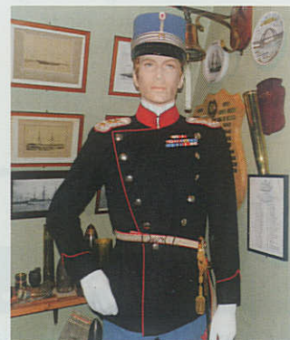
▲ Mannequinen med oberstuniformen står flot placeret i marinestuen i Nakskov.