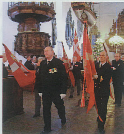
▲ De mange flag og faner bæres ud af Holmens Kirke efter nytårsgudstjenesten den 4. februar.

Bertel Haarder tog i sin tale udgangspunkt i det frivillige arbejde og indsats som eksempelvis Marinehjemmeværnet yder. En indsats, der er af uvurderlig betydning for samfundet. Han kom også ind på betydningen af de danske sømænds indsats under 2. Verdenskrig, der i 2014 resulterede i, at Danmark endelig blev anerkendt som allieret nation, og derfor i juni officielt deltog i markerin-