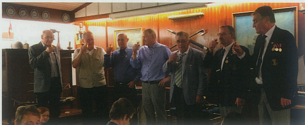
▲ Deltagerne ved Nibe Marineforenings julefrokost byder velkommen til en række nye medlemmer af Danmarks Marineforenings afdeling i den gamle Limfjordskøbstad.