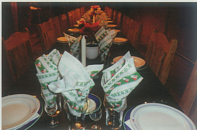
▼ Så er der dækket bord og klar til julefrokost i Hanstholm/Thisted Marineforening.

Efter velkomstdrink, skydning og præmieuddeling blev der serveret luksus smørrebrød. Så selv om rapportøren igen gik hjem uden præmie, fik alle en god aften såvel fagligt som social.