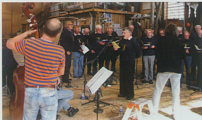
▲ Ebeltoft Marineforenings populære Slupkor sendte i december korets tredje CD "Alt vel om bord" ud i julehandlen.

I december gik aktiviteterne hånd i hånd. Julefrokost for medlemmer med ledsagere, julefamilieminebanko med såvel sponsor- som deltagerpræmier, reception i forbindelse med udgivelsen af Slupkorets tredje CD med titlen "Alt vel om bord", juleskafning på fregatten JYLLAND med proviant á la julen 1880 og løbende