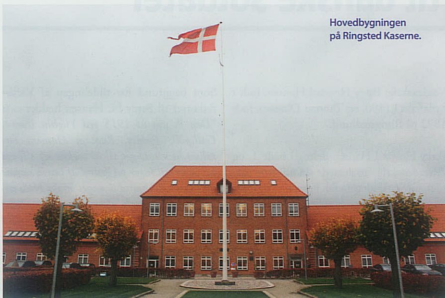
Hovedbygningen på Ringsted Kaserne.