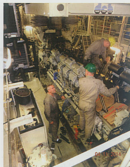
▲ Et godt samarbejde mellem civile teknikere og personel fra OPLOG Korsør, OPLOG Frederikshavn og besætningen sikrede at støtteskibet ESBERN SNARE holdt tidsplanen under efterårets operation ved Afrikas Horn.

Der var afsat 11 dage til udskiftningen. Det var ikke meget, da der pludselig opstod uventede forhindringer – eksempelvis Power Units, der ikke kunne bruges. Opgaven med at fremskaffe ekstra reservedele i ekspresfart så langt fra Danmark var lidt af en omstændelig opgave. Men det lykkedes ved fælles hjælp at få løst opgaven bare 14 timer før ESBERN SNARE's planlagte afgang fra havn. ■