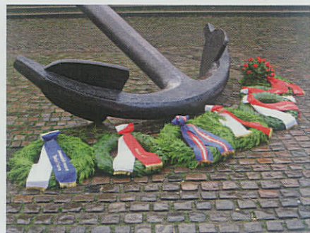
▲ Syv krans blev lagt ved Mindeankret den 24. december. (Foto: Jørgen Kjeldsen).

Se mere på sitet dan-flanger.dk Dan-Flanger A/S Tingvej 4, Hal 11 4652 Hårlev telefon 47172804 • 40532345