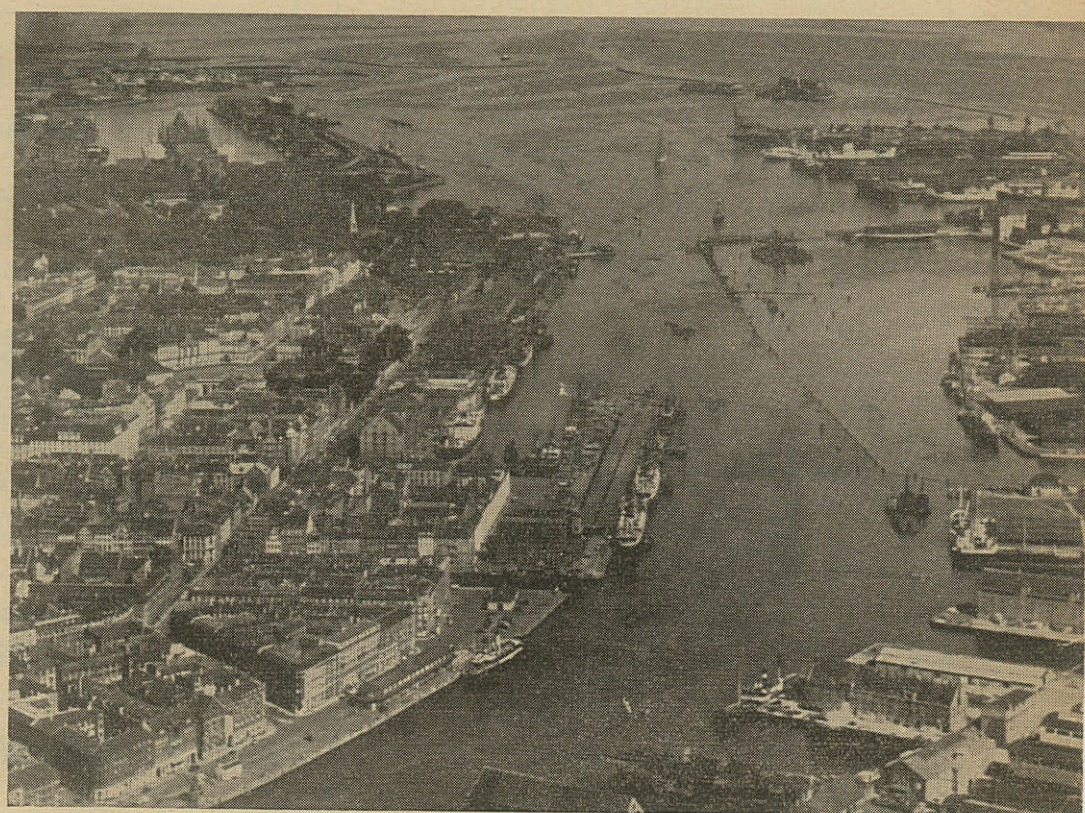
Udsigt over Københavns Havn.