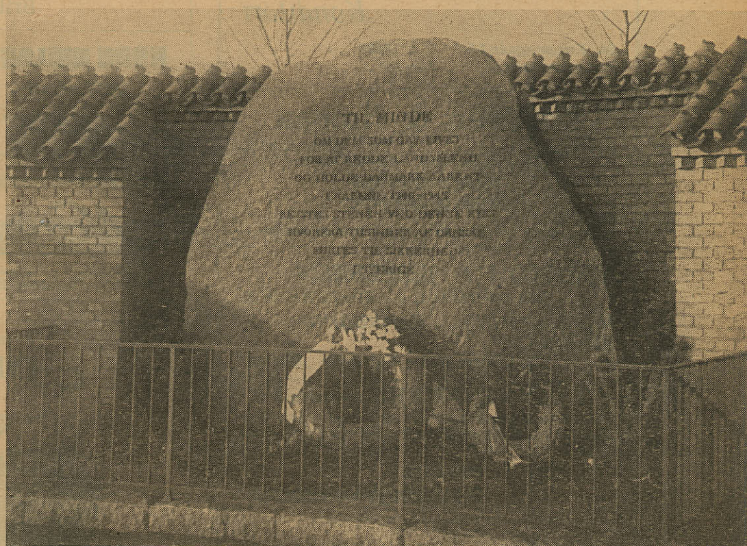
MINDESTENEN VED TUBORG HAVN FOR DE UNDER „SUND- TRANSPORTERNE“ OMKOMNE I AARENE 1940—45 Udsmykket til Julen 1948 af Marineforeningens Gentofte Afdeling, der sammen med Tuborgs Bryggerier havde henlagt smukke Kranse.