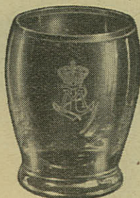
PORTVIN KR. 3,85