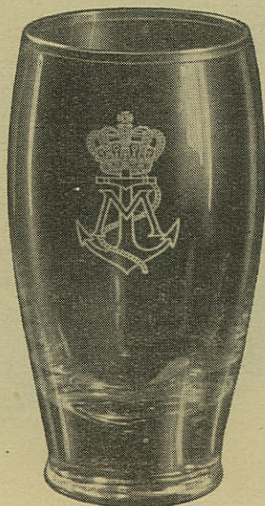
ØLGLAS KR. 5,50