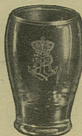
SNAPS KR. 2,75