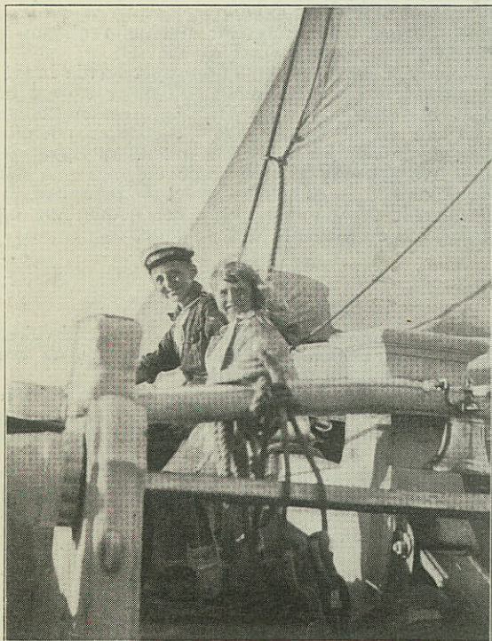
»Søspejdere i venlige Omgivelser«.