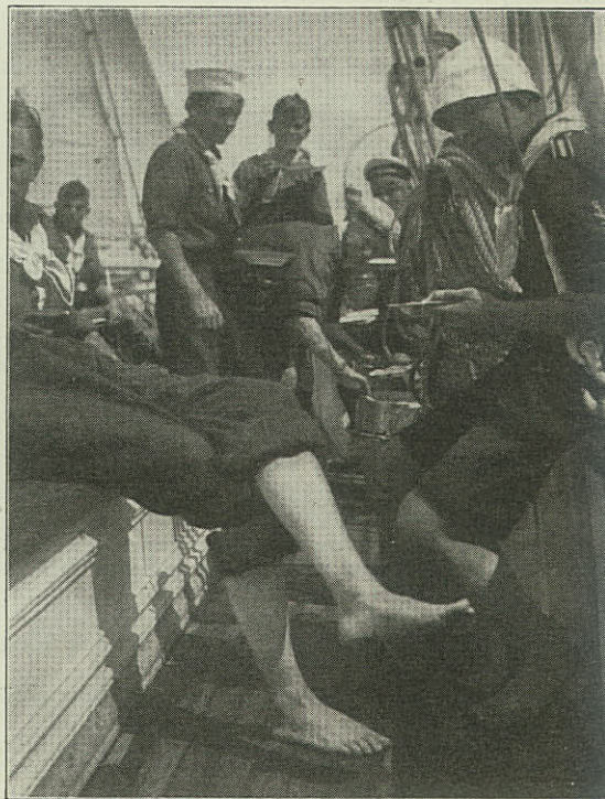
»Morgenmaaltid ombord inden Rengøringen«.

Den 1. Februar foranstalter Søspejderne i Langelinie-Pavillonen en Eftermiddagskoncert, ved hvilken Marinens Orkester forventelig vil musicere, medens der i Restauranten bliver Theservering. Hertil er Adgang for Alle uden Entré. Senere vil der i Yachtklubbens Selskabslokaler, der velvilligst er stillede til fri Raadighed af Værten, Direktør Christensen, blive Aftenunderhold-