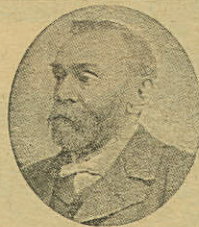
Dr. Alfred Nobel. Aktieselsk. Grundl.