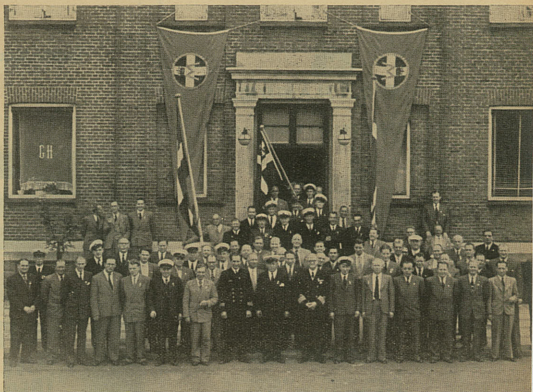
Fra Marineforeningens Landsskyttestævne i Herning den 3. September 1950.