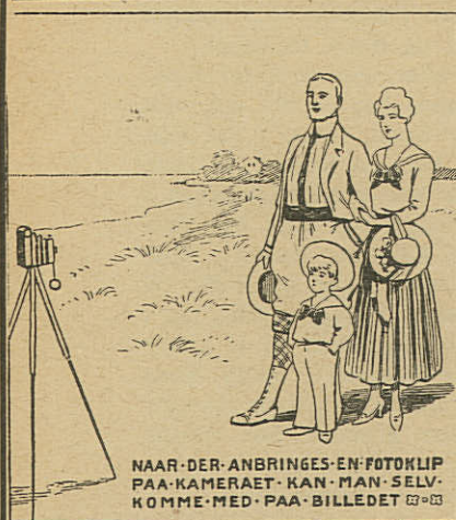
NAAR DER ANBRINGES EN FOTOKLIP PAA KAMERAET - KAN MAN SELV KOMME MED PAA BILLEDET

Förkallvalsadt och draget stål och järn samt trådspik post- och telegrafadress: MUNKFORS