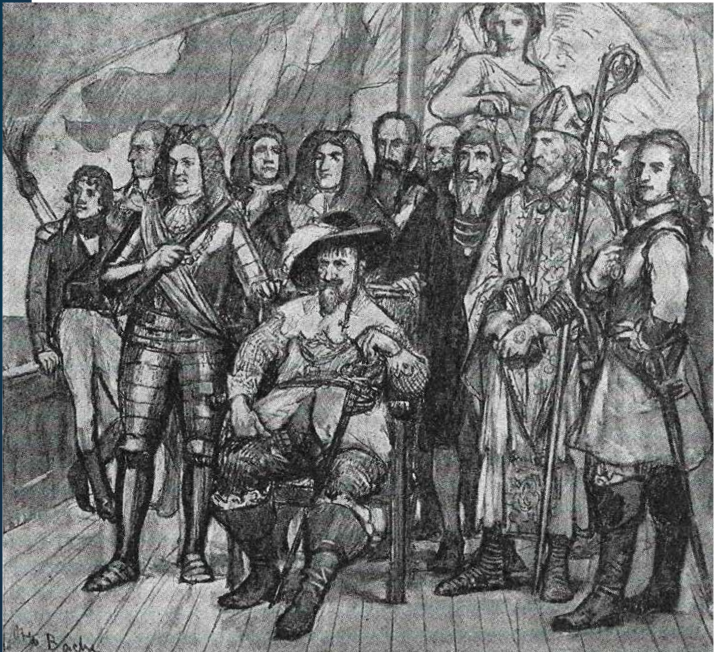
Et udsnit af den danske flådes officersbeklædning gennem et par århundreder vist af nogle af vore søhelte. Udkast til en illustration til Christian Winthers digt "Matrosen" (Ved Toldboden steg en Matros i Land). Matrosen møder efter at have forladt sin sidste ankerplads på agterdækket en række af flådens søhelte, der har stillet sig op bag ved Christian IV. Blandt andet ses fra venstre Willemoes, Niels Juel, Cort Adeler, Hertuf Trolle, Peder Skram, Bisp Absalon og Tordenskiold. Kultegning af Otto Bache.