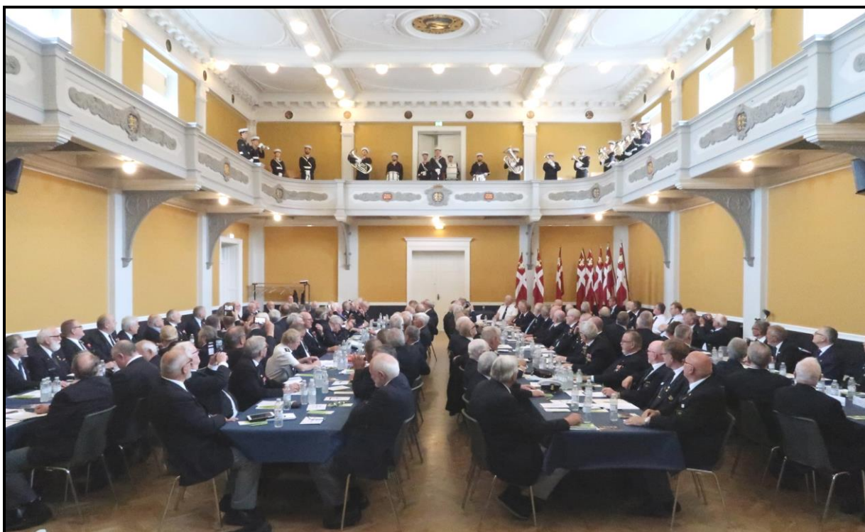
Fra Sendemandsmødet i Randers den 18. maj 2019.