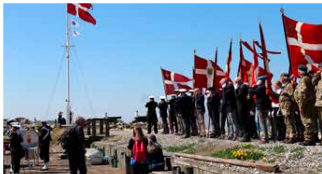
▲ Klar til Dansk Løsen på Bastionen på ydermolen ved fregathavnen i Ebeltoft.