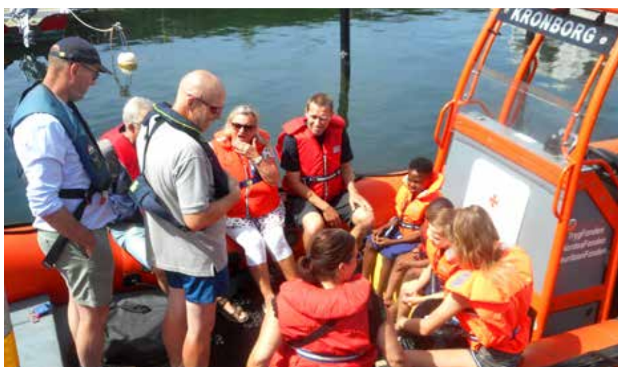
▲ Der rådgives i søsikkerhed ombord på Dansk Søredningsselskabs MOB-båd "Kronborg" i Helsingør.

Der er faste procedurer for de operative aktiviteter samt krav om særlig uddannelse for de frivillige i bådene. I forbindelse med hver operation orienteres Lyngby Radio og Forsvarets Operationscenter. ▶