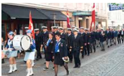
▲ March i byens gader med Randers Pigegarden forrest efterfulgt af vagtfri besætning på LAUGE KOCH og medlemmer fra Randers og Grenaa Marineforeninger.