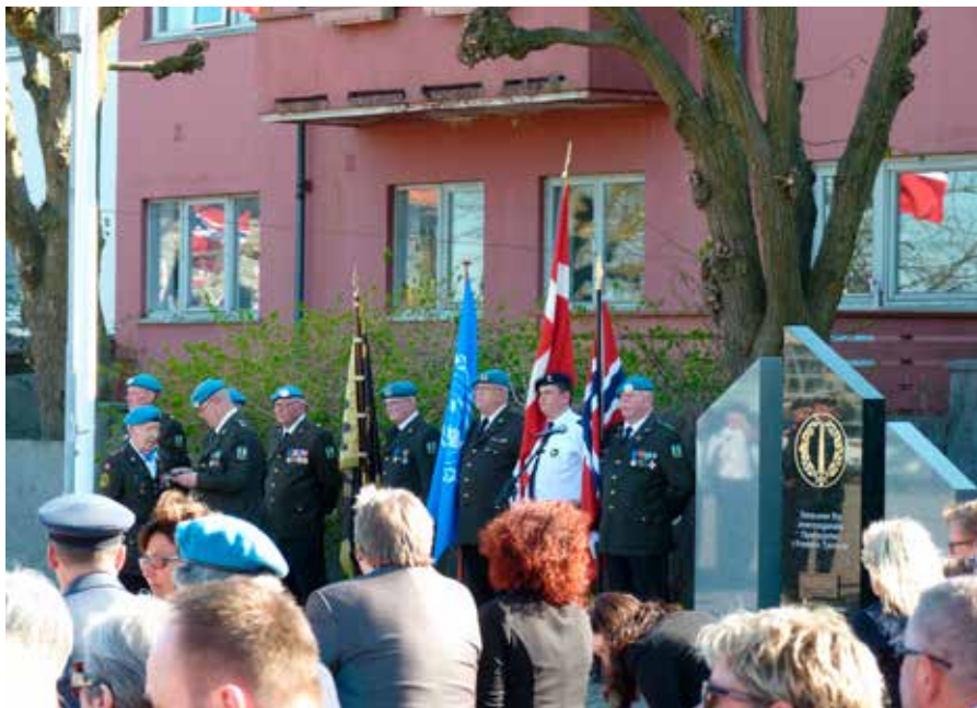
▲ Den danske delegation deltog også i højtideligheden den 8. maj for Norges befrielse og veterandagen ved mindesmærket i Kristiansand for internationale operationer i fredens tjeneste.

lem af Ribe Marineforening, lagde en krans fra Danmarks Marineforening.