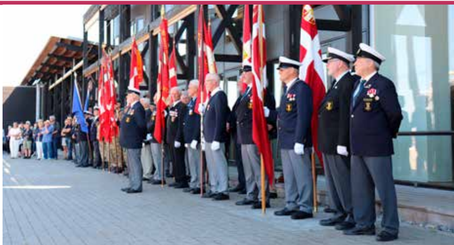
▲ Danmarks Marineforenings afdelinger i Grenaa og Ebeltoft deltog ved markeringen af Søværnets dag den 9. maj 2018 med flag og flaggaster sammen med en række andre forsvarsrelaterede foreninger fra Djursland.

– Turisme- og oplevelsesindustrien er under forandring, og Fregatten JYLLAND skal markere og udvikle sig i en turbulent verden, men også i en verden, hvor vi skal finde den rigtige