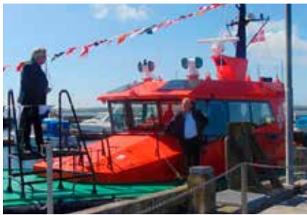
▲ Kalundborg Lodseris nye lodsåd "Danpilot Delta" med flag over top i forbindelse med overdragelsen den 4. maj 2018.