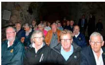
▲ Deltagerne ved Fanø Marineforenings udflugt i juni er klar til filmforevisning i Mønsted Kalkgruber.

Aabenraa Marineforenings gode køkken og marinehusets unikke beliggenhed trækker ofte kollegaer fra landets 75 lokalafdelinger forbi, når de i forvejen er i det Sønderjyske. Således også i juni hvor 25 personer fra Faaborg Marineforening nød en veltillberedt frokost efter et besøg i Frøslev Lejren.