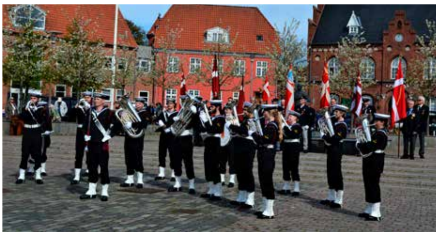
▲ Vanen tro er Søværnets Tamburkorps med til at festligeholde jubilarrangementer i Danmarks Marineforening. Således også i forbindelse med fejringen af Frederikssund Marineforenings 100 års-jubilæum, hvor de her giver koncert på byens torv.

ste for at sikre Danmarks interesser i Afrika, i Irak og i Afghanistan eller i de Baltiske lande og i Østersøen. Og de er alle villige til at sætte deres liv på spil for den frihed, som alt for mange tager som en selvfølge.