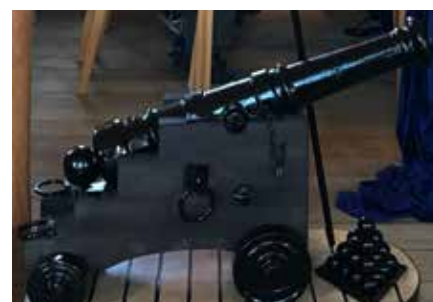
▲ Venner-Foreningen til Glyngøre Marineforening har foræret denne smukke og velrestaurerede salutkanon til Glyngøre Marineforening.

Den 16. juni sejlede 3 lystbåde med 11 medlemmer og ledsagere til Struer for at besøge kollegaerne i Struer Marineforening. Ifølge det oplyste blev Morsingboerne beværtet med en overdådig buffet tilsat diverse våde vare til at skylle maden ned med. Fra deltagerne lyder der en stor tak til Struer Marineforening for et særdeles godt arrangement.