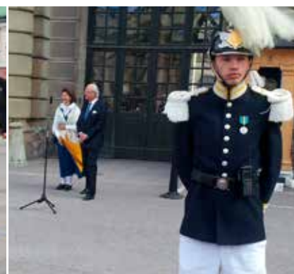
▲ Læserrejse nummer 30 i regi af først fagtidsskriftet Søfart og siden 2003 Marineforeningen Tidsskriftet "Under Dannebrog" gik den 2. til 7. juni 2018 til Sverige og Ålandsøerne. Blandt de mange unikke oplevelser var et besøg den 6. juni på det kongelige slot i Gamla Stan i det centrale del af Stockholm i forbindelse med fejringen af den svenske nationaldag. Her blev gruppen sammen med de fremmødte svenskere budt indenfor på slottet af Dronning Silvia og Kong Carl XVI Gustaf. På gruppebilledet er de 34 deltagere forevige foran Sveriges Riksbankbygning. På det andet foto hilser Kongen og Dronningen "Välkommen till!".