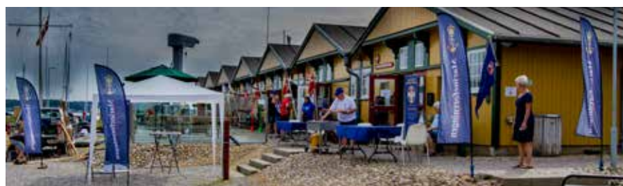
▲ Danmarks Marineforenings udstillingsæt vest var med til at gøre de mange gæster, der deltog i Havns dag i Kolding, opmærksom på marinehuset.

Støtteforeningen Esepigerne har heller ikke ligget på den lade side. Ifølge det oplyste har de arrangeret to vellykkede og velbesøgte arrangementer: Tapasaften og modeshow.