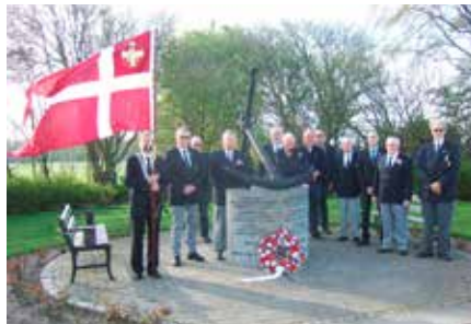
▲ Medlemmer fra Sømandsforeningen i Nykøbing Mors og Morsø Marineforening lagde den 5. maj krans ved mindeankret for omkomne søfolk fra de to verdenskrige.

nordlige del af Skive Havn om til Marinehuset, hvor de blev budt på forplejning samt yderligere informationer om det at være medlem af Danmarks Marineforening.