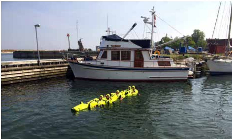
▲ Elever fra Marstal Navigationsskole øver brug af overlevelsesdragt i magsvejr i havnebassinet i Marstal.

Uddannelser, således at det til stadighed vil være muligt at sikre den studerendes mulighed for videreuddannelse i de øvrige maritime uddannelser som kystskipper, sætteskipper og skibsfører, efter at optagelseskrav på uddan-