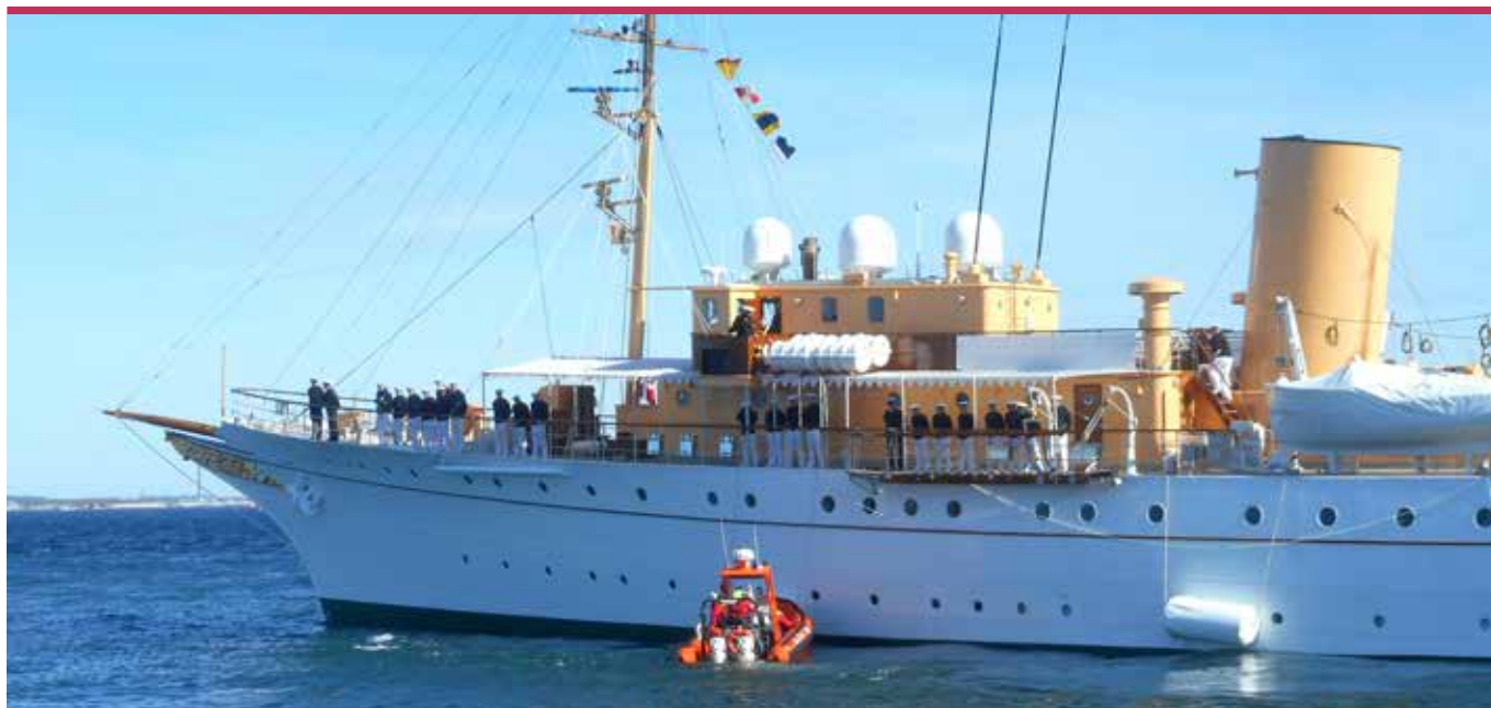
▲ Det 75 meter lange og 1.150 tons tunge Kongeskib A 540 DANNEBROG har tid til anden besvær med at anduve havnen i Helsingør. Her hjælper "Kronborg" DANNEBROG på ret kurs under et anløb i den nordsjællandske havneby.

DANSK SØREDNINGSSKAB ER EN ALMENNYTTIG FORENING, DER HER I 2018 BESTÅR AF 10 AFDELINGER MED OMKRING 170 FRIVILLIGE SOM 24 TIMER I DØGNET OG 365 DAGE OM ÅRET STÅR KLAR TIL AT HJÆLPE SEJLERE I INDRE DANSKE FARVANDE, SOM HAR BRUG FOR ASSISTANCE TIL NÆRMESTE HAVN. SELSKABET KALDER DET FOREBYGGENDE SØREDNING.