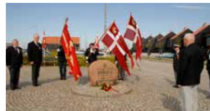
▲ Den 5. maj højtideligholdes altid ved den af Ebeltoft Marineforening opsatte mindesten for befrielsen i 1945. Således også i år hvor der deltog medlemmer fra Ebeltoft og Grenaa Marineforeninger samt Vaabenbrødreforeningen for Ebeltoft og Omegn.

Såvel Slupkoret som travaljen er i god gænge. Koret optræder løbende ved forskellige arrangementer medens besætningen i travaljen er på vandet hver onsdag. Medlemmer fra Ebeltoft Marineforening er med på fregatøen i forbindelse med et større 29. august arrangement.