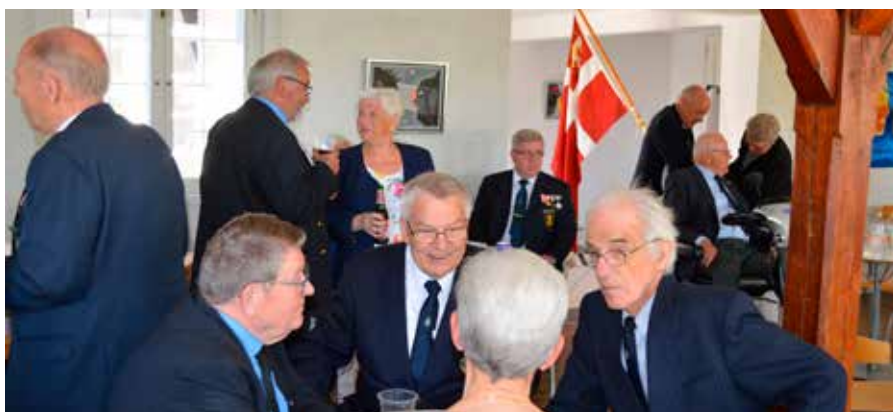
▲ Kulturhuset Elværket stillede deres smukke lokaler til rådighed for jubilæumsreceptionen i Frederikssund Marineforening.

Jubilæumsdagens seks variable arrangement udgjorde hen over lørdag den 5. maj og godt ind i søndag den 6. maj en god og mar-